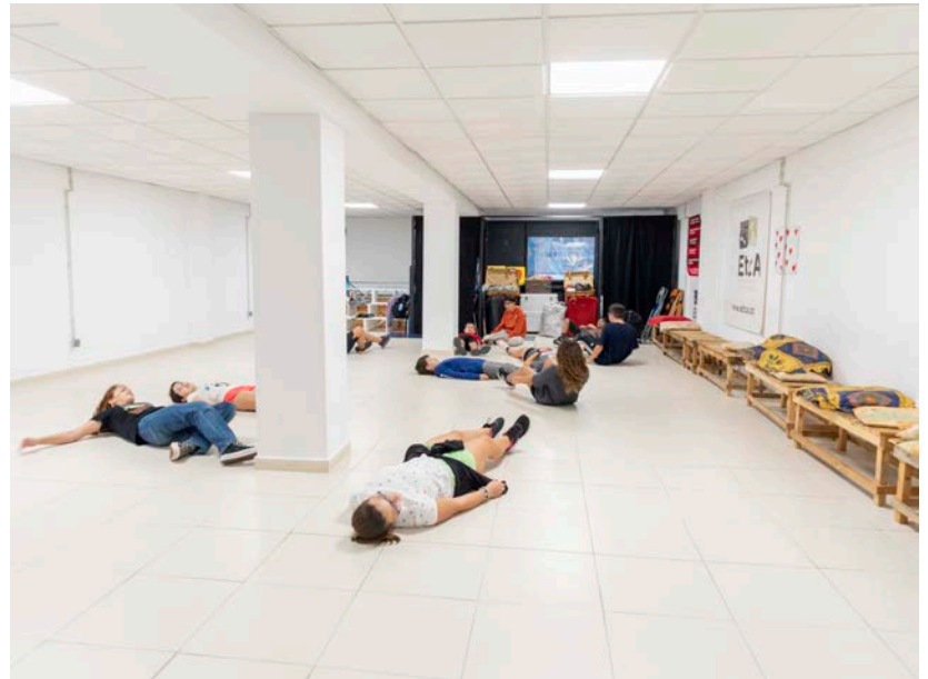
L'Escola de Teatre i Circ també va oferir classes de teatre juvenil i d'acrobàcia.