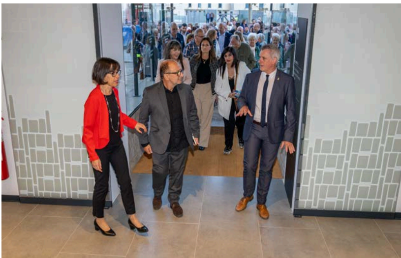
La regidora, l'alcalde, les bibliotecàries i les autoritats convidades, accedint a l'espai.