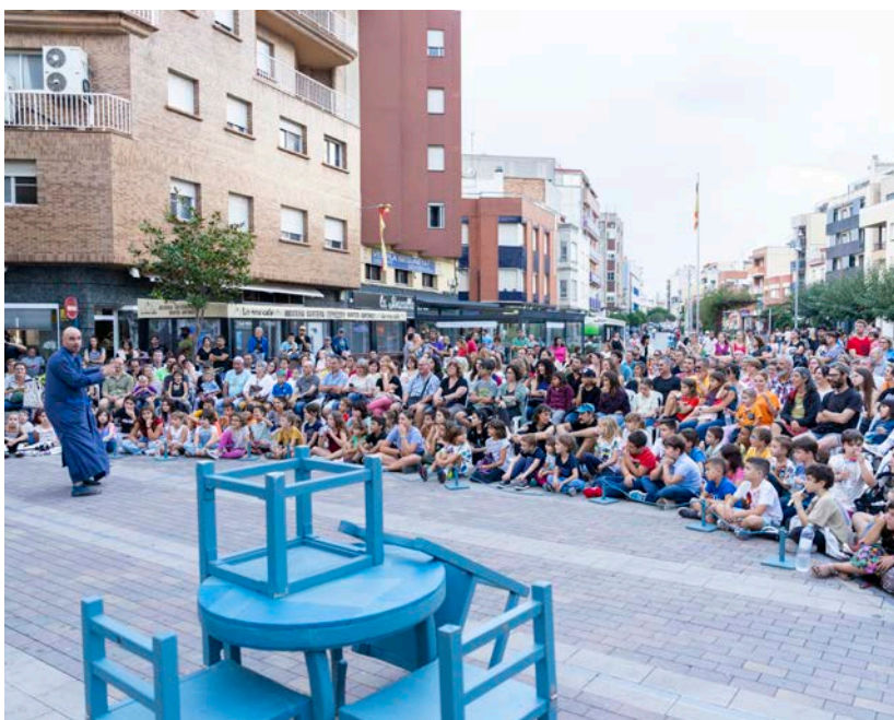
Un dels espectacles infantils amb més públic va ser 'L'actitud' de Cia. JAM.