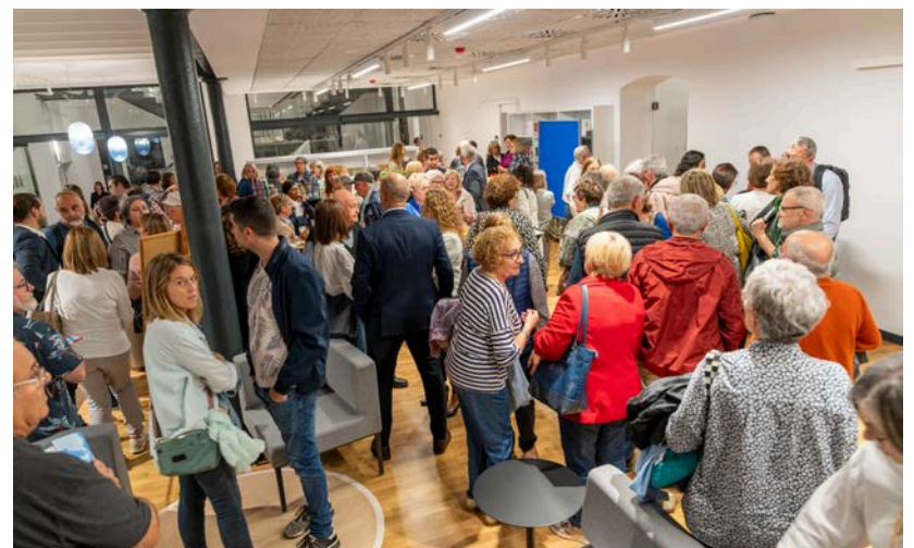
Alguns dels participants, abans de l'inici de les Jornades de les Lletres Ebrenques.