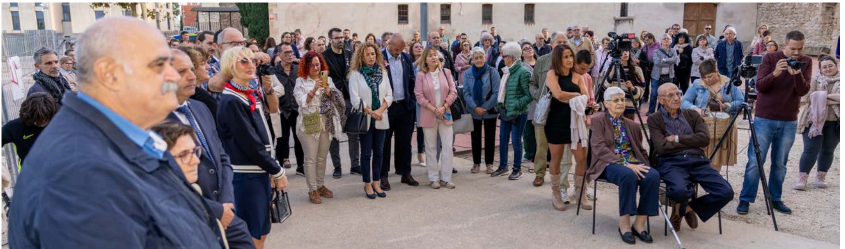
Centenars de persones van acudir a veure la renovada biblioteca.