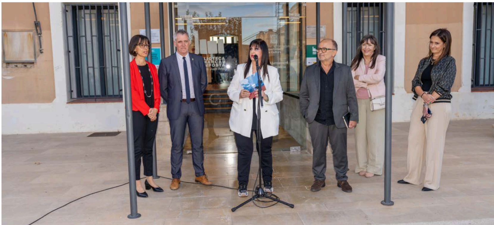
La inauguració de la rehabilitació de la biblioteca va tenir lloc el divendres 18 d'octubre.

CULTURA > La rehabilitació integral de la biblioteca ha suposat una inversió d'1,3 milions d'euros, subvencionada en part pels Fons Next Generation, la Generalitat i la Diputació de Tarragona