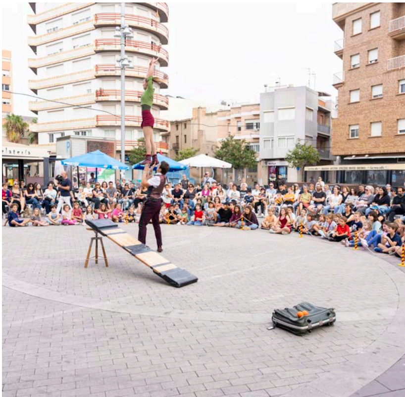
Cia. De Tal Palo amb l'espectacle 'Fisgoneo, el arte de lo ajeno', diumenge a la tarda.