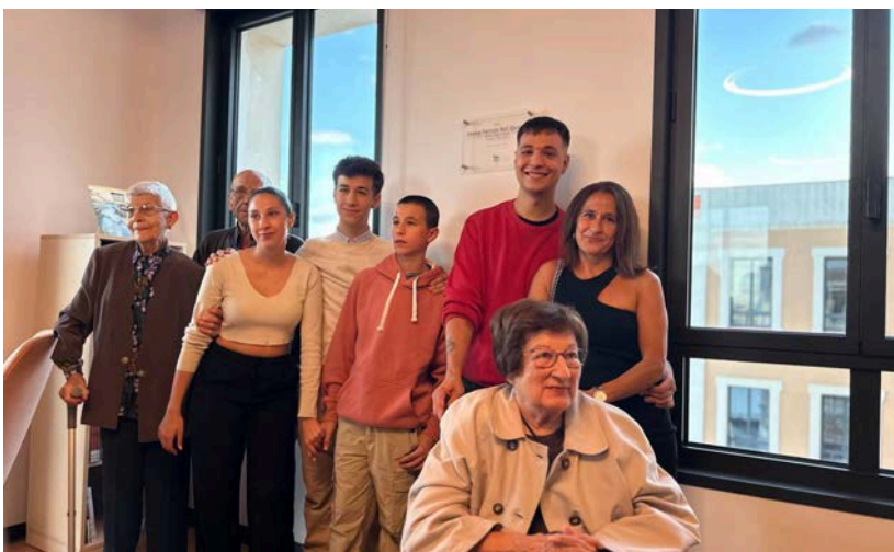
Durant l'acte també es va inaugurar la sala de recerca local Ferran Bel Querol.