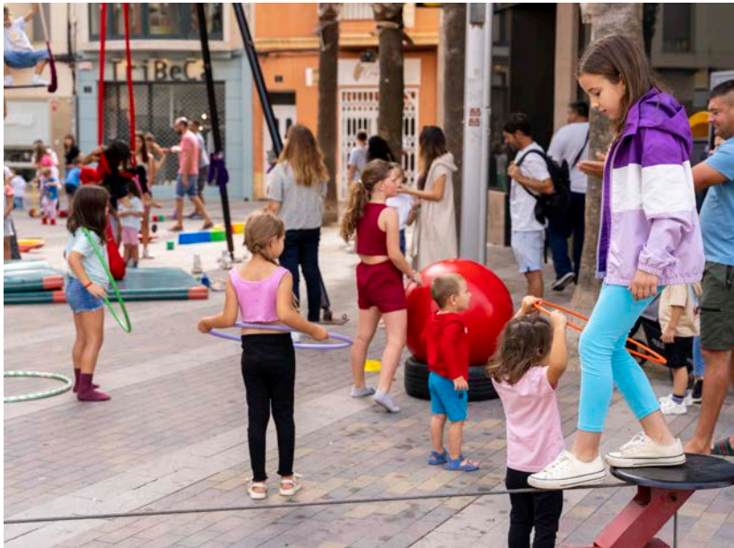
El taller d'arts de circ i teatre al carrer d'EtcA es va poder gaudir dissabte i diumenge.