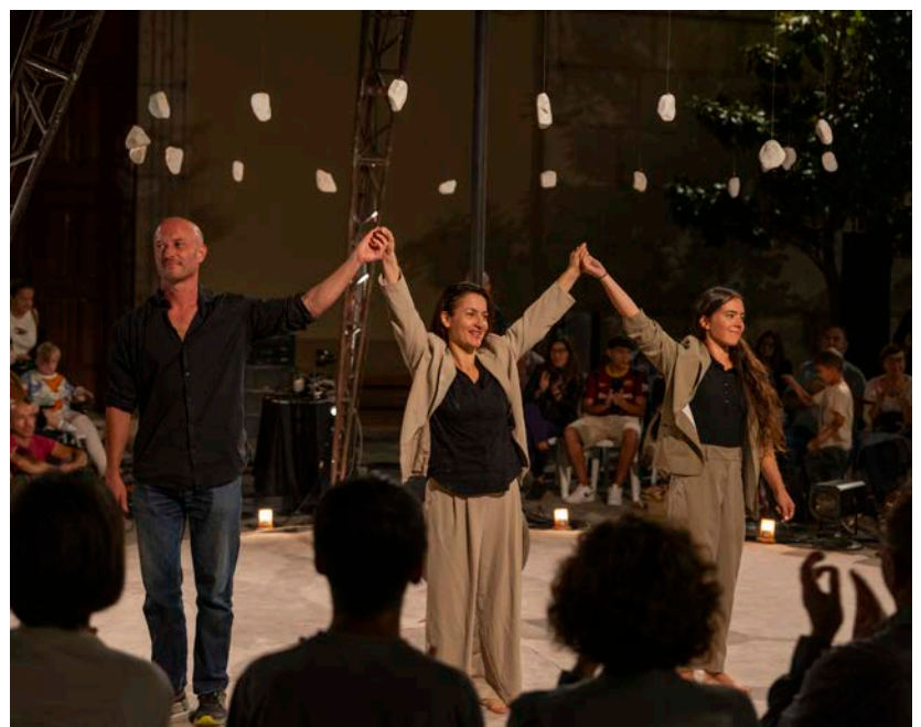
'Lady Panda' va ser l'acte de cloenda de l'11è FesticAm.