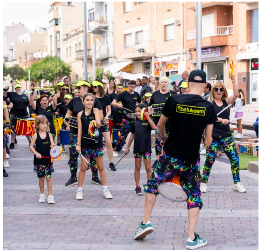
Batukeem va posar música als carrers a ritme de la batucada.