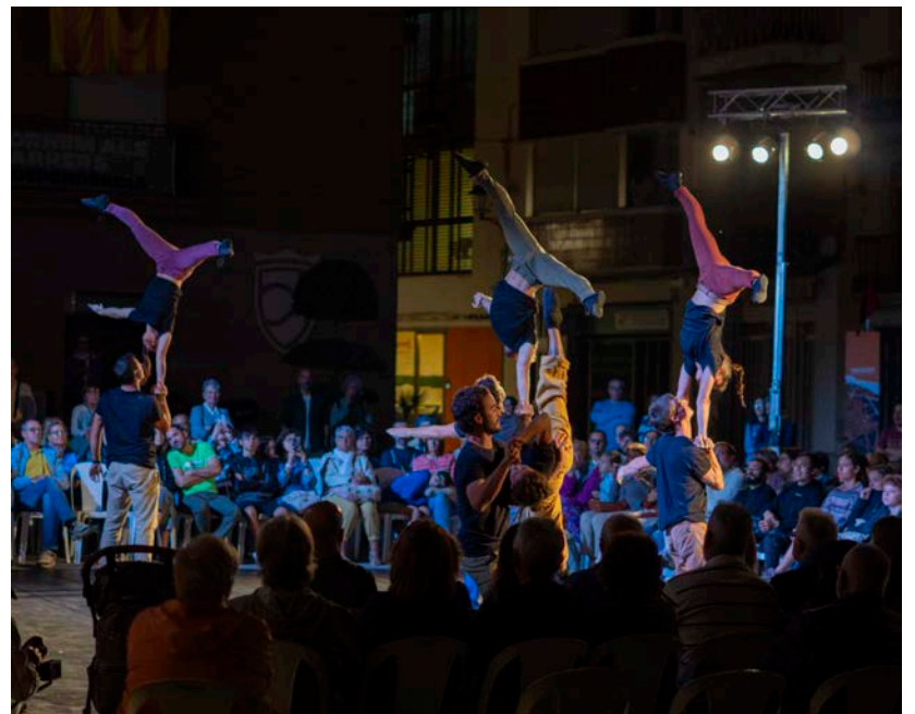
El circ contemporani va omplir la plaça de l'Ajuntament amb 'Tenet'.