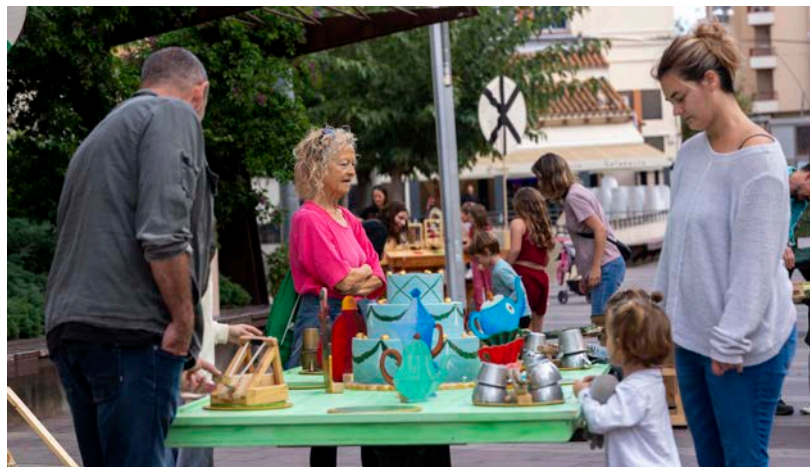
La instal·lació de Tombs Creatius sobre contes, a la plaça Ramon Berenguer IV.

La 12a edició del FesticAM està prevista entre el 29 de setembre i el 5 d'octubre de 2025 ■