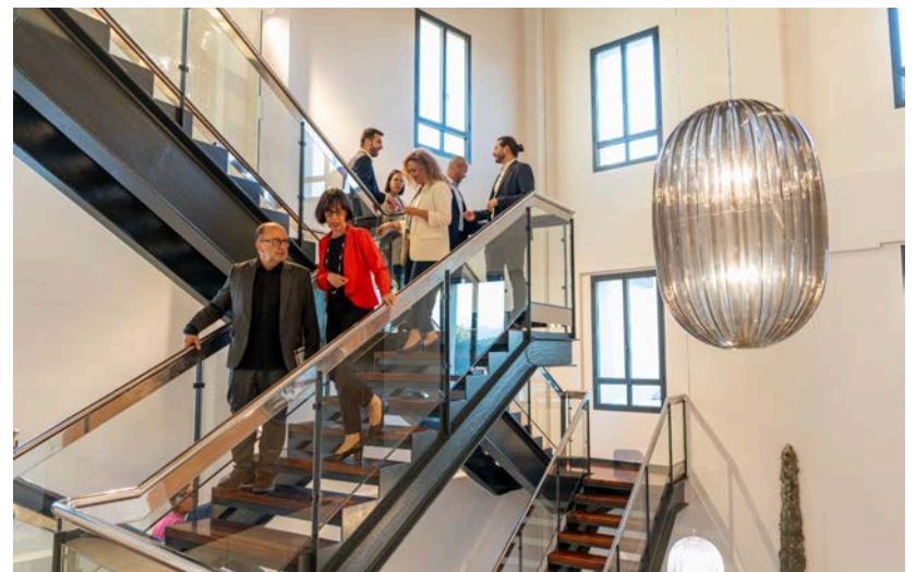
Les làmpades de l'escala són un dels nous atractius de l'edifici.