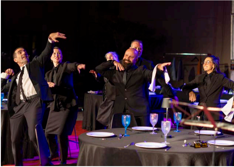
L'espectacle 'Color' de Cia. Animasur va inaugurar el FesticAM.