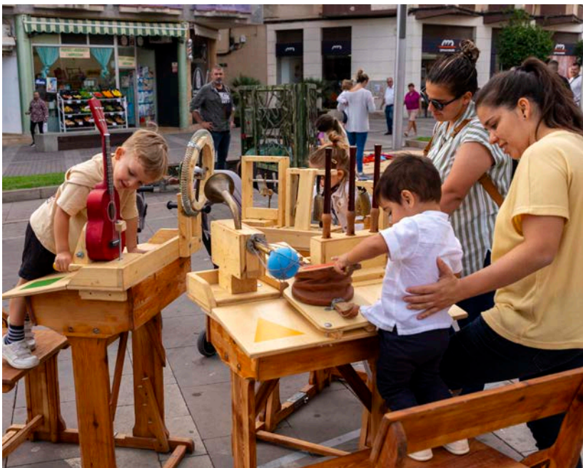
'Lilliput: Juguem a contes' va mostrar la cara més jugable de les històries.