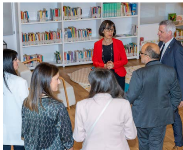
El director general de Promoció Cultural i Biblioteques va participar en l'acte.

Les obres de rehabilitació integral de la Biblioteca Comarcal Sebastià Juan Arbó, que van començar fa dos anys, han servit per millorar el sistema tèrmic, eliminar les barreres arquitectòniques i reorganitzar els espais per adaptar-los als usos actuals de la biblioteca, habilitant la planta baixa com a utilitària després que l'àrea de Polítiques Actives d'Ocupació es tras-