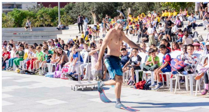
Durant tota la setmana va haver-hi espectacles per als centres educatius.