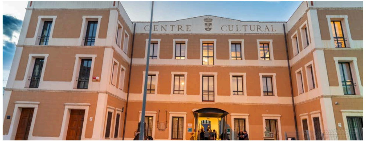
La Biblioteca Comarcal Sebastià J. Arbó s'ubica a l'antic molí de Cercós.

Aquest logo, que representa l'edifici de la biblioteca fet amb llibres, i on destaca la xemeneia del molí, serà el que a partir d'ara serà el que representarà la biblioteca i estarà present en totes les activitats que s'organitzaran des d'aquesta ■