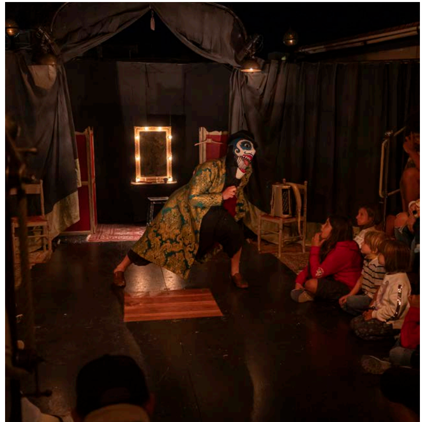
Una companyia francesa va portar una obra de titelles i objectes a la plaça del Castell.