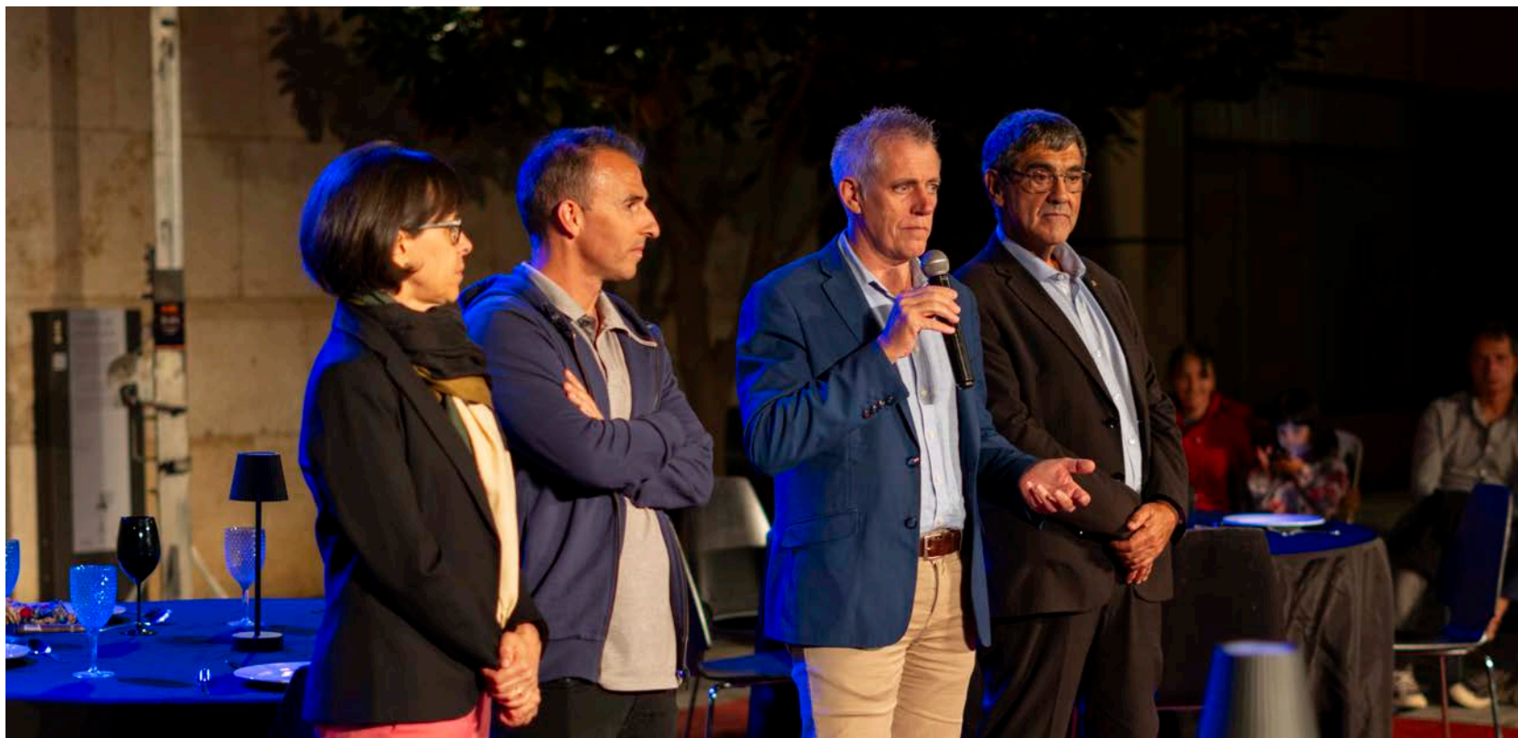
L'11è FesticAM va arrancar el divendres 4 d'octubre.

CULTURA > La 12a edició del Festival Internacional de Teatre i Circ d'Ampostà està prevista entre el 29 de setembre i el 5 d'octubre de 2025