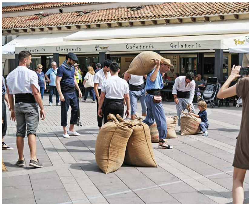
El mercat del braç, dissabte a la plaça Ramon Berenguer IV.