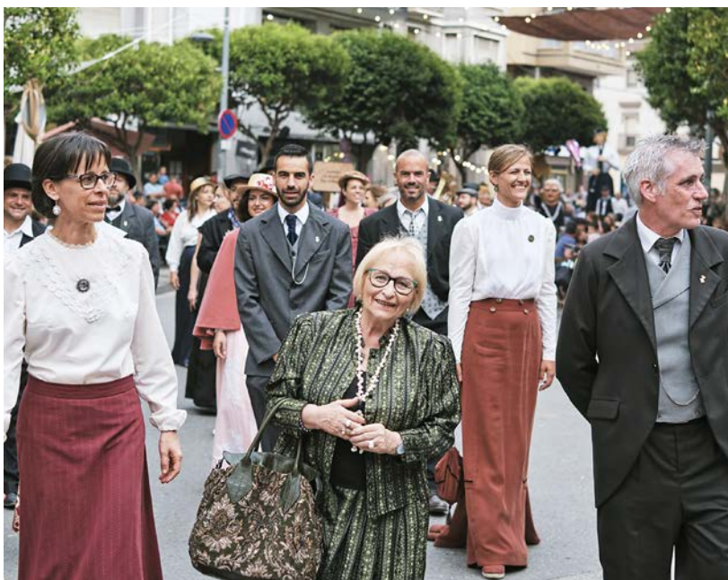
"Lo passeig" va tornar a tancar la Festa del Mercat.