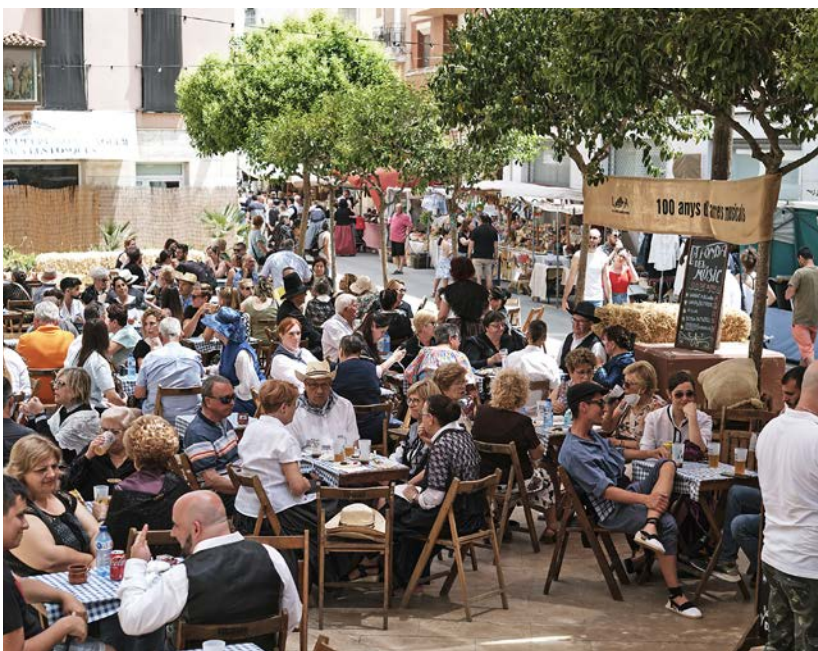
Les tavernes del nucli antic van haver de reposar menjar i beguda.