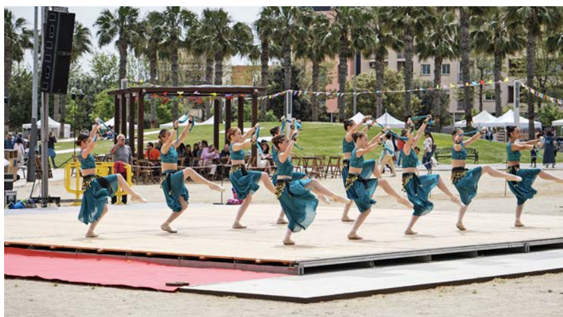
Un dels espectacles que van oferir des de l'Escola Maria Lozano.