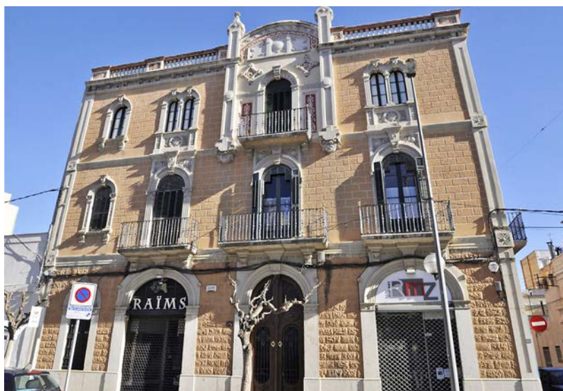
Casa Fàbregas, a l'av. de la Ràpita.

Una altra d'aquestes cases modernistes és Casa Masià, construïda entre 1910 i 1924. Aquest edifici es va anar construint amb els ingressos que generaven les collites d'arròs i oli. Avui, aquesta casa