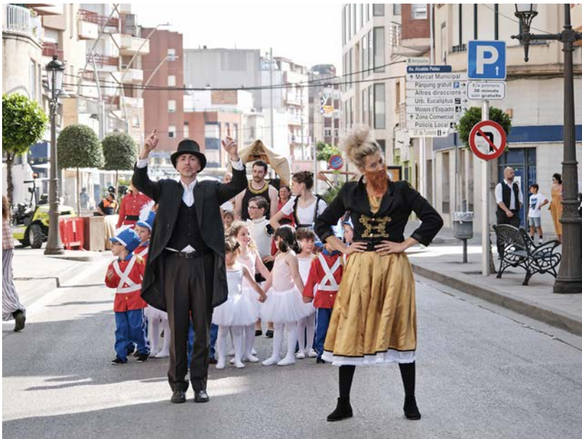
L'arribada del circ Mozzarella a Amposta.