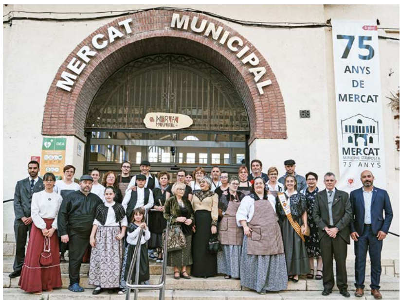
Després del pregó es va donar el tret de sortida al Tast al Mercat.