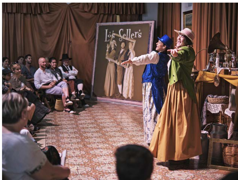
"Los Sellers" es va estrenar aquesta catorzena edició, al Casino.