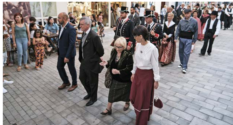
Aquest 2022 se celebrava la catorzena edició de la Festa.