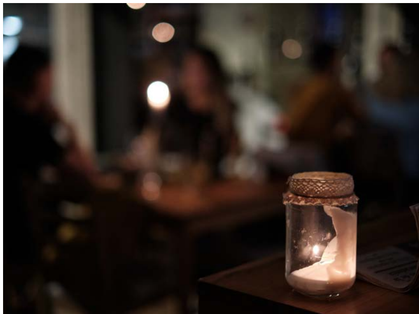
Aquest any es va recuperar el "Sopar a les fosques".