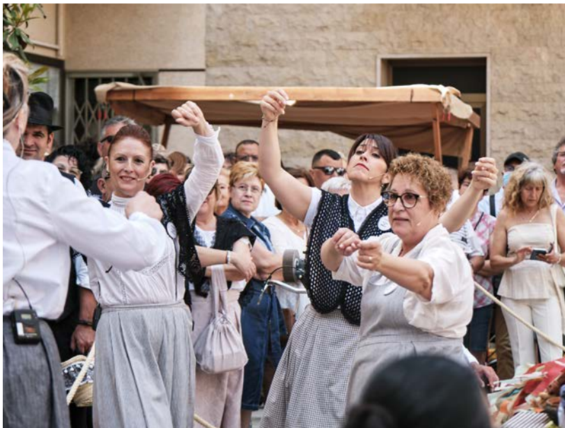
Escenificació del Mercat a la Plaça, diumenge 22.