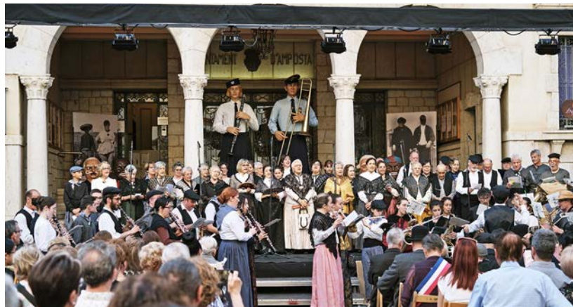
La plaça de l'Ajuntament es va omplir pel pregó inaugural.

"Lo Passeig", on es reuneixen tots els participants en la Festa, seguit de la traca final, van posar punt final a la XIV Festa del Mercat a la Plaça ■