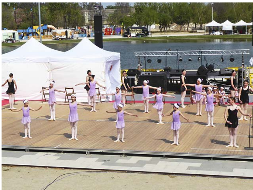
L'alumnat de ballet de l'Escola Jacqueline Biosca.