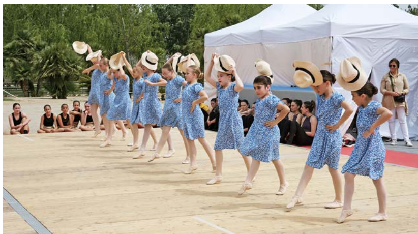
Es van poder veure espectacles molt diferents.