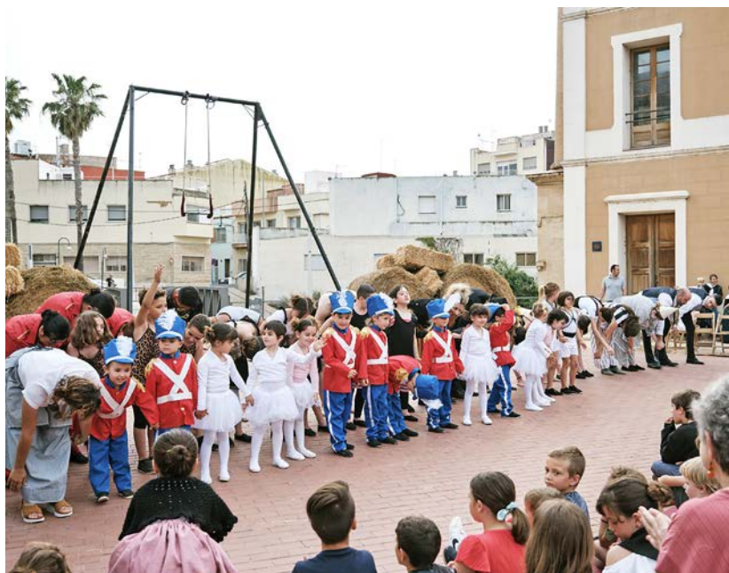
L'alumnat d'EtcA al circ Mozzarella, a la zona del Castell.