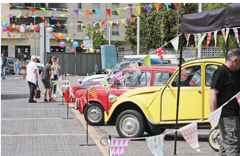
La mostra de vehicles clàssics.