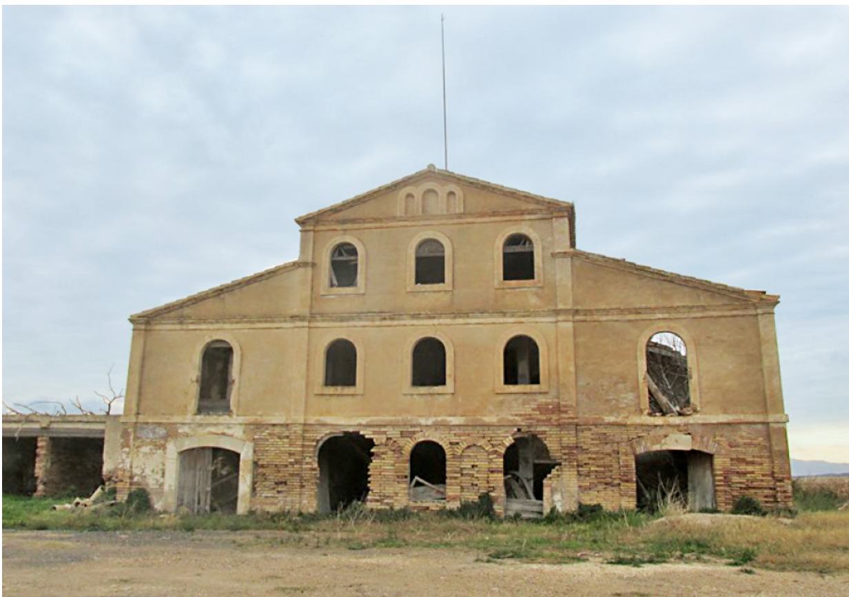
El Mas de Font, a la partida Panissos.