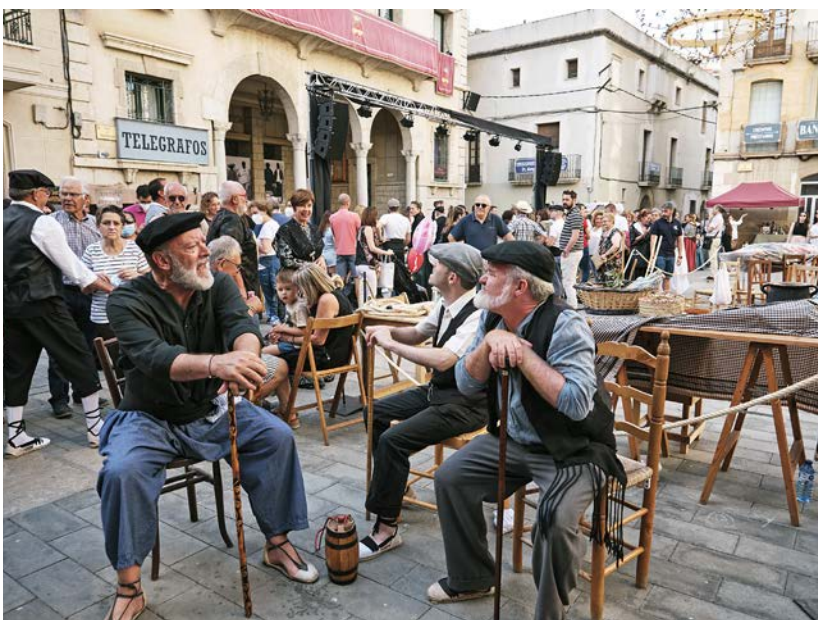
Un dels espectacles de la Festa del Mercat a la Plaça.