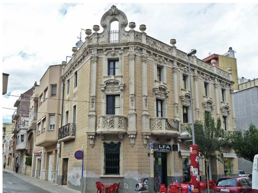
La Casa Morales-Talarn, en ple centre d'Amposta.