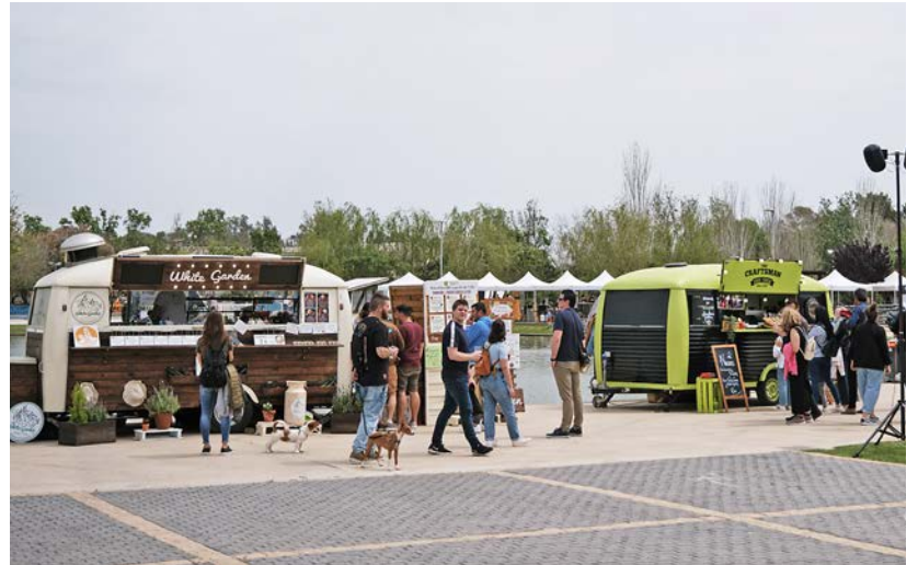
Una vintena de caravanes van parar al parc.

D'altra banda, diumenge 1 de maig es van organitzar tallers amb diferents disciplines de circ i exhibicions a càrrec d'alumnes de l'Escola de Teatre i Circ d'Amposta (EtcA), mentre que també es van poder veure els espectacles de l'alumnat del CBE Quick Dance i els ballarins de The Country Sheriffs ■