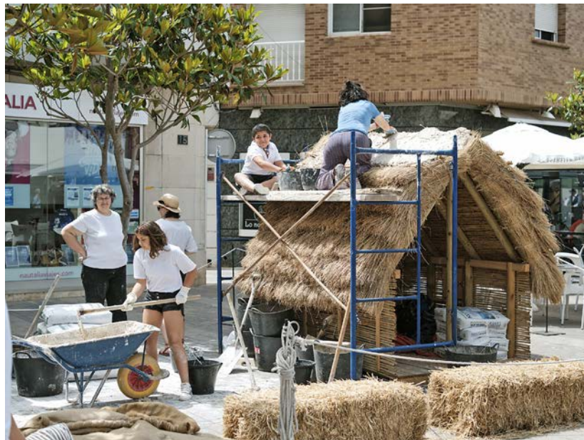
El taller de barraques es va realitzar dissabte, prop del Mercat.