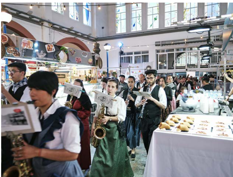
El Tast al Mercat de Nit va omplir el mercat de tapes.