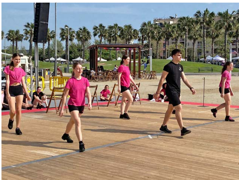
El Dia de la Dansa serveix per visibilitzar aquest esport.