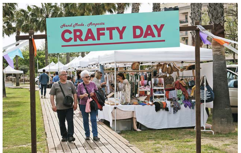
El Crafty Day, amb les parades d'artesanía.