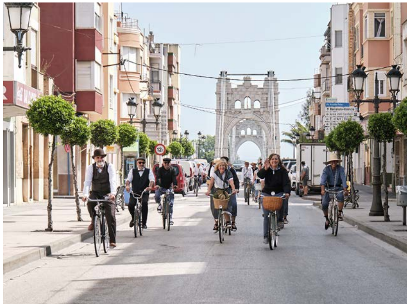
La volta ciclista per Amposta amb la trobada de bicis antigues.