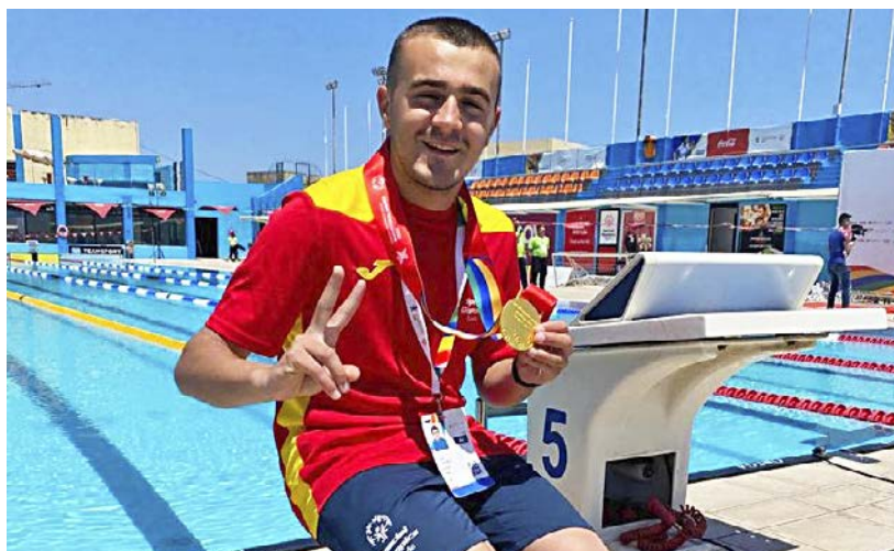
Picot amb les medalles aconseguides al Special Olympics.

En aquest prestigiós esdeveniment esportiu van participar gairebé un miler d'atletes i esportistes de 23 països ■