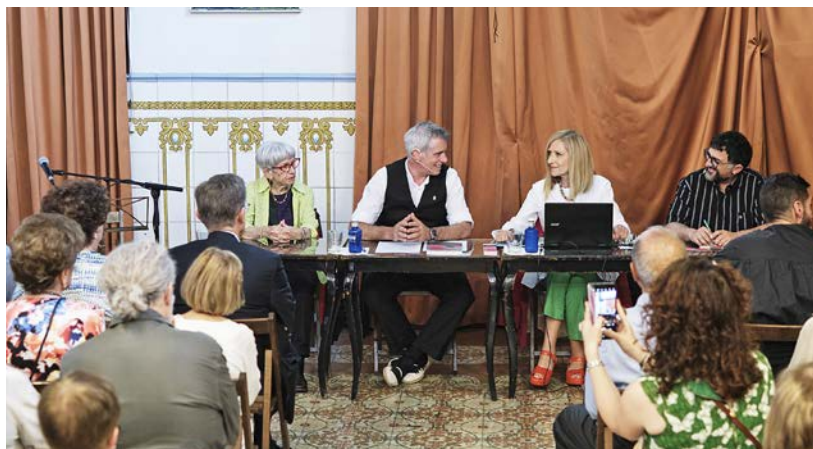
La presentació va coincidir amb la Festa del Mercat a la Plaça.