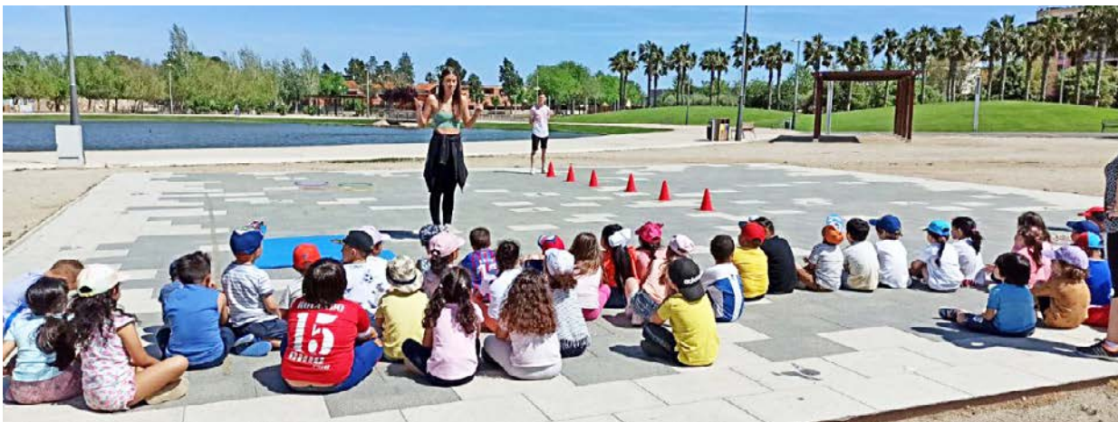
A Amposta, les activitats es van fer al parc dels Xiribecs.

EDUCACIÓ > El projecte ha estat impulsat per la regidoria d'Educació i coordinat per les tutores del CFGS d'Educació Infantil de l'INS Montsià