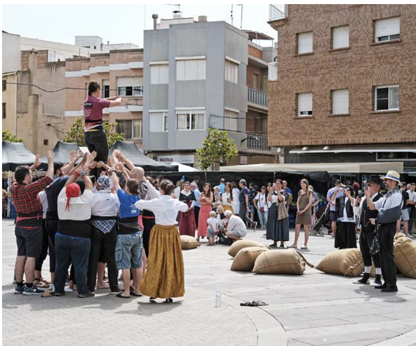
Dissabte també va tenir lloc una exhibició castellera.