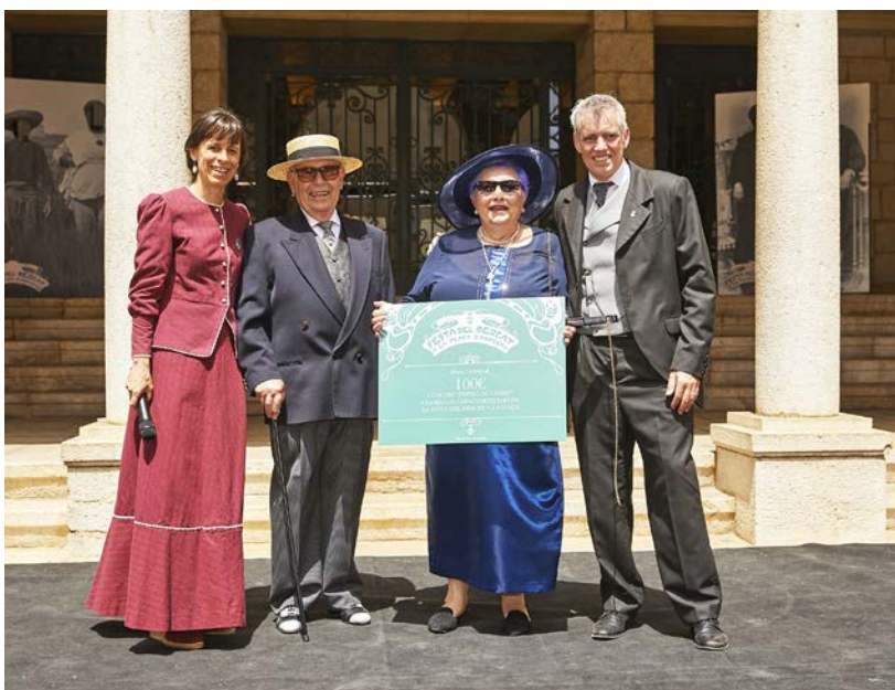
Premi individual al concurs "Pepito de Canes".