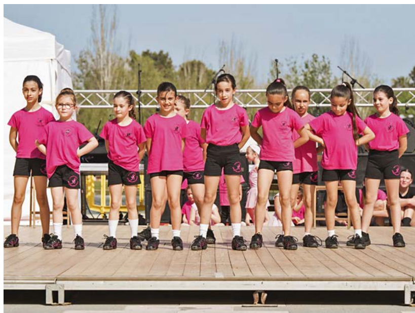
Les menudes de l'Escola Jacqueline Biosca.