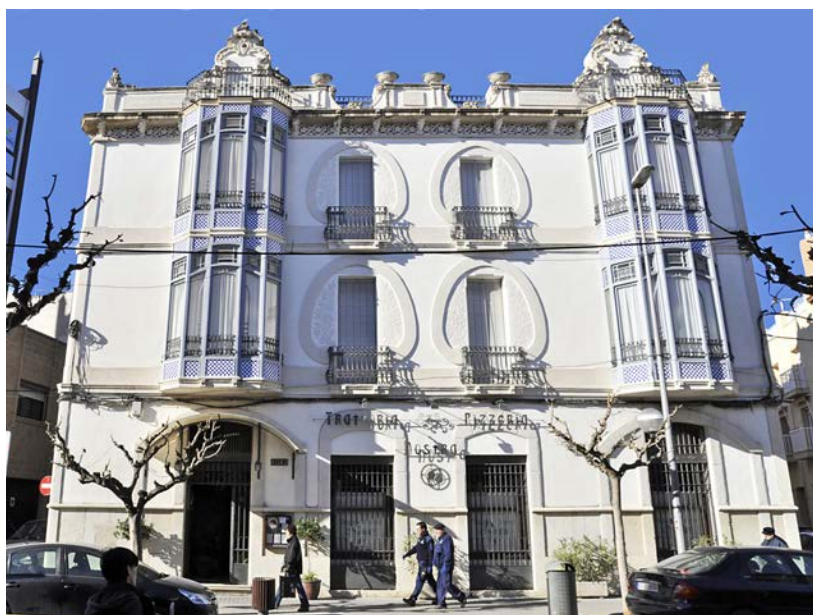
La Casa Masià en el seu estat actual.