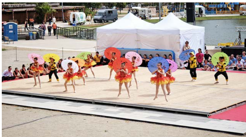
Alumnes de l'Escola Maria Lozano, durant el Dia de la Dansa.

esdeveniment que es converteix en una oportunitat per donar a conèixer i promocionar la dansa del territori. A la ciutat, les escoles de dansa han permès que sigui un esport força arrelat. ■