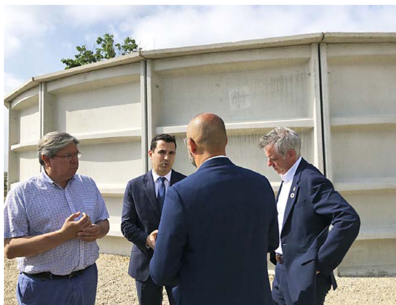
El dipòsit està ubicat al costat de la piscina municipal.

L'ACA, entre 2016 i 2021, ha convocat i adjudicat cinc línies d'ajuts, amb una inversió total de 80 milions d'euros, amb l'objectiu de millorar l'abastament d'aigua municipal. Les actuacions subvencionades s'han centrat, principalment, en incrementar la garantia en el subministrament a través de noves captacions, construccions de nous dipòsits i millora de les xarxes existents, entre d'altres ■