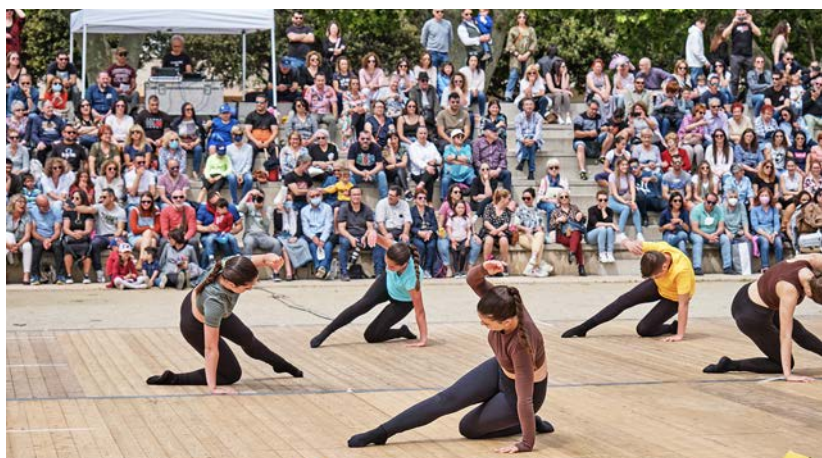
L'alumnat prepara les coreografies durant tot el curs.