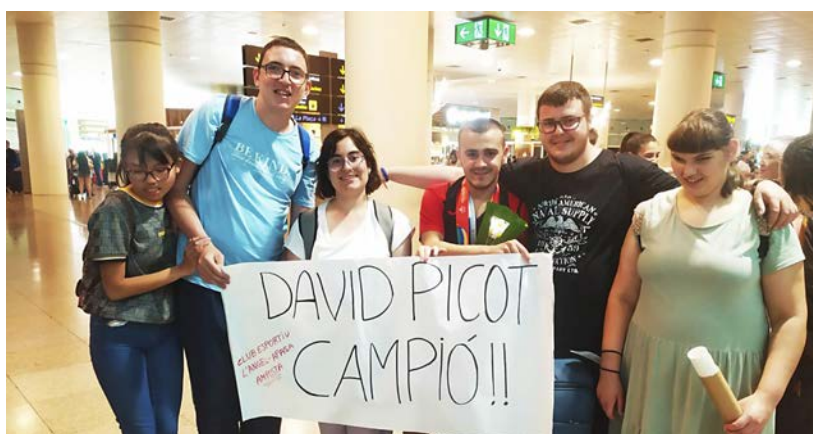
Un grup d'esportistes i familiars del nedador el van anar a rebre a l'aeroport de Barcelona, el 18 de maig.