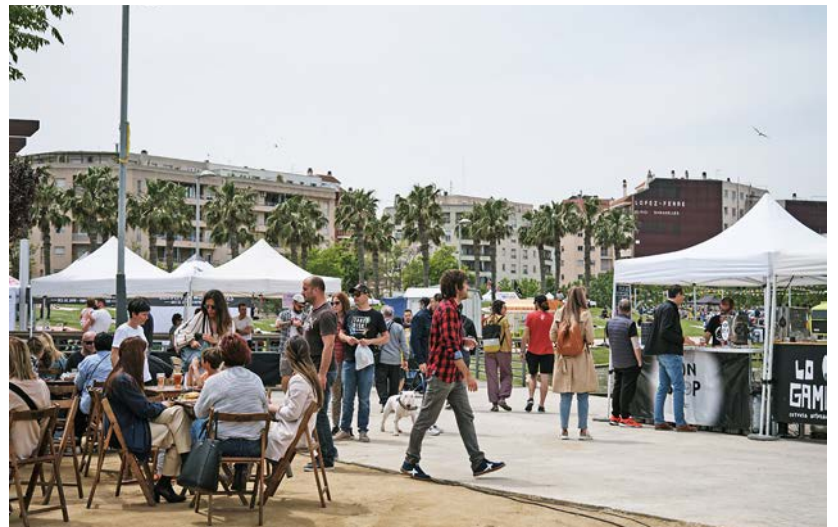
La Fira de Cervesa Artesana, al parc dels Xiribecs.