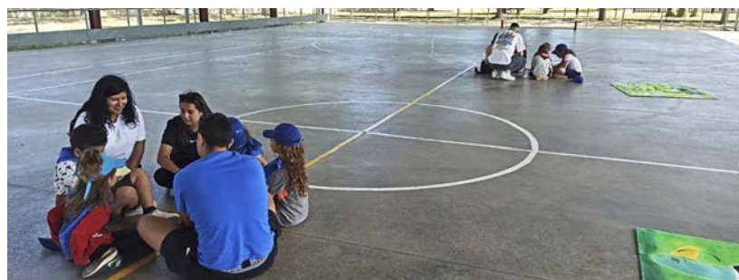
Els i les alumnes del cicle al Poble Nou del Delta.