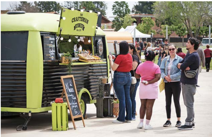
També s'oferien opcions veganes.