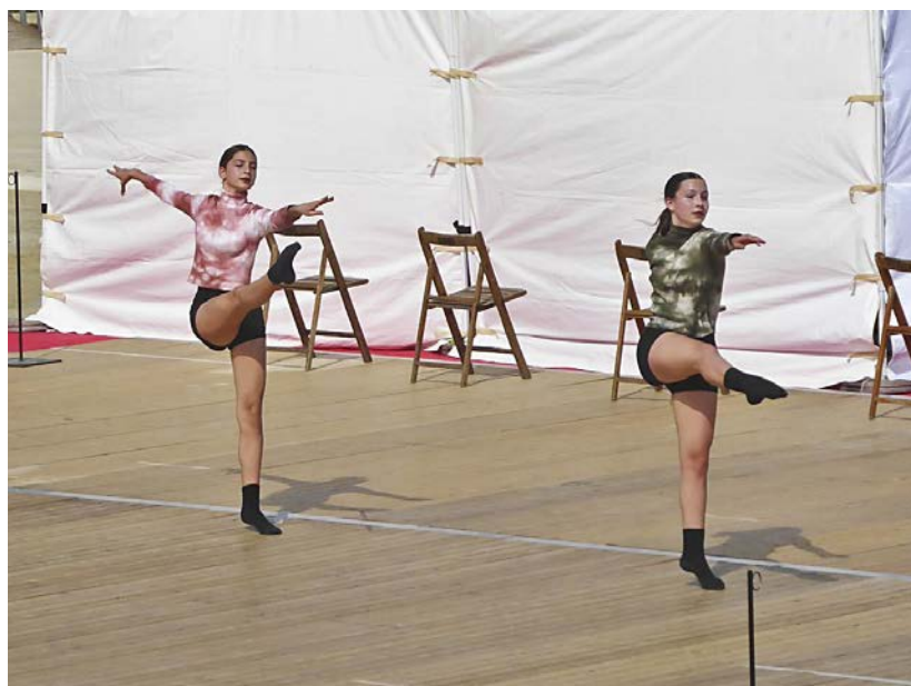
Dos ballarines de l'Escola Jacqueline Biosca.