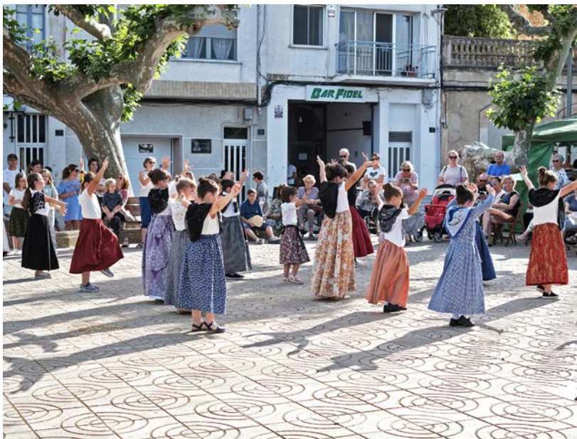
Una actuació de balls tradicionals, a la plaça de l'Aube.