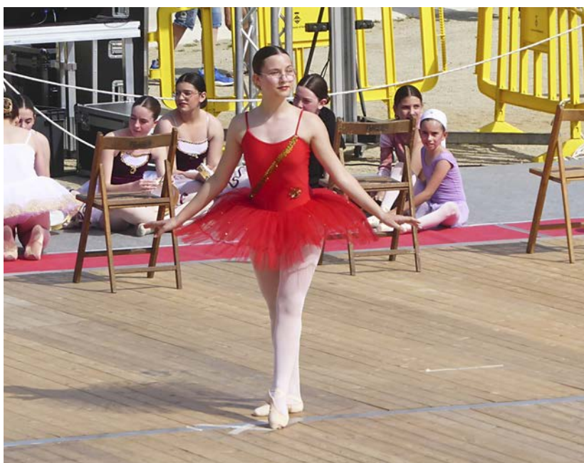
Un dels espectacles de dansa que es va poder veure als Xiribecs.