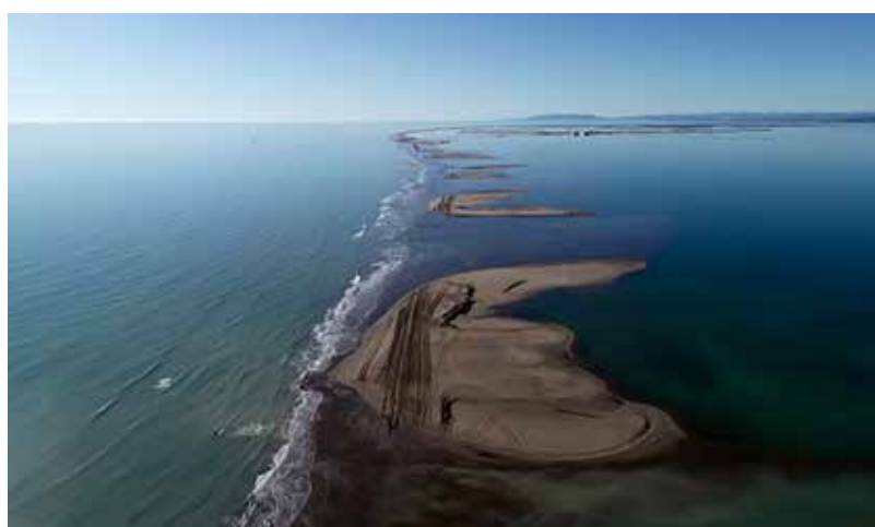
Pla general dels trams que es mantenen submergits de la barra del Trabucador després del pas del temporal Filomena. Imatge del 13 de gener de 2021.