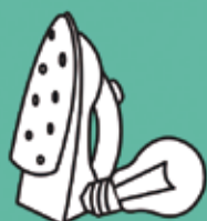
Petits electrodomèstics i bombetes