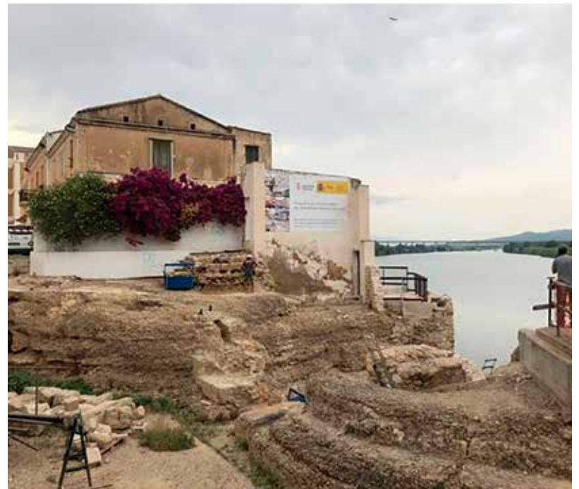
Imatge de l'estat de les obres el juliol del 2020, mentre s'estaven realitzant els treballs arqueològics

L'informe clou que "el Castell d'Amposta representa un cas únic dins l'arquitectura de les ordes militars a l'àmbit de l'Ebre. Al contrari que els castells de Miravet i Ulldecona, no ocupa un punt elevat i, per tant, no presenta la clàssica estructura de recinte jussà i recinte sobirà. El castell d'Amposta està bastit damunt d'una plataforma i confia la seva inexpugnabilitat als fossats, d'aquí la seva potència i complexitat. Tanmateix, el castell ampostí sí que comparteix d'altres aspectes amb la resta de castells ebrencs, com ara la mínima conservació de restes andalusines. És innegable l'ocupació