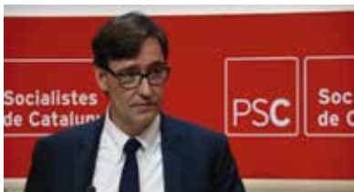
Salvador Illa, candidat del PSC a la Presidència de la Generalitat,