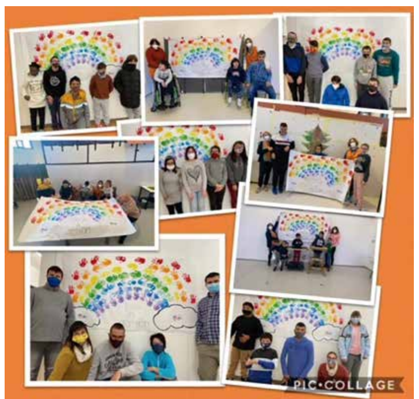
Amb la rifa de regalls i la confecció i venda de mascaretes, Apasa va donar 1.000 euros.