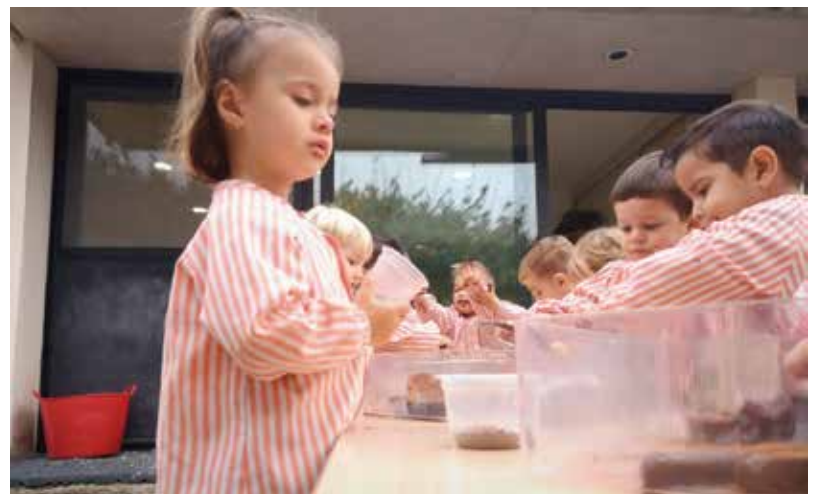
Xoco-vid19, posem tots els sentits va ser l'activitat sensorial que va organitzar la Sequieta per recaptar fons per a la Marató.