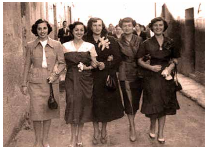
Passejant amb les amigues