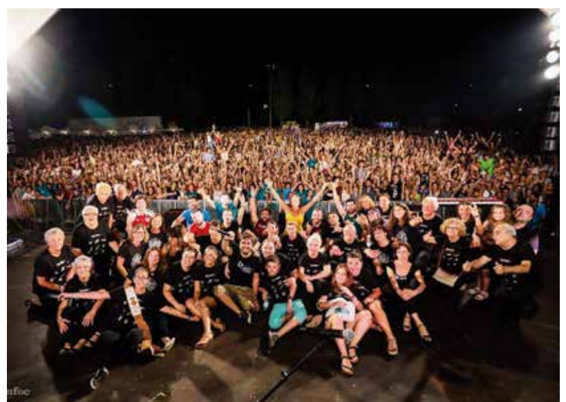
Imatge del concert que Txarango va fer a Ampostà l'agost del 2017

El grup va obrir també un sistema de devolució de les entrades que consisteix en la possibilitat de rebre el reemborsament o bé bescanviar-les per un disc "inèdit, d'edició limitada i numerada" que només es podrà adquirir a través d'una reserva fins al 21 de febrer, i que portarà per títol 'El gran ball'. Es tracta d'un disc doble amb portada il·lustrada per Ricardo Cavolo que recopila alguns dels temes emblemàtics del grup. Es pot trobar més informació a www.txarango.com ■