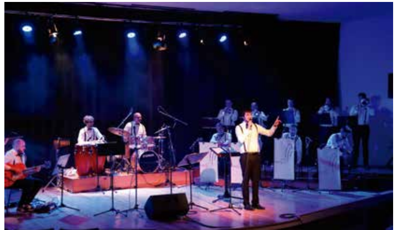
Unió filharmònica: La Unió Filharmònica va recaptar 365 euros amb el seu concert de Nadal basat amb els èxits de Sinatra

Per la seva banda, el Club Twirling Big Dream, va organitzar una recollida entre els seus associats gràcies a la qual van poder aportar a la Marató prop de 245 euros. I finalment, la Unió Filharmònica va aportar 365 euros del seu concert de Nadal amb un repertori basat en molts èxits del cantant Nord-americà Frank Sinatra i també apostant per un seguit de cançons arranjades amb swing ■