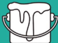
Pintures i pastosos