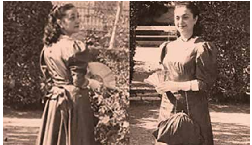
Al Parc d'Amposta, lluint un model fet per ella