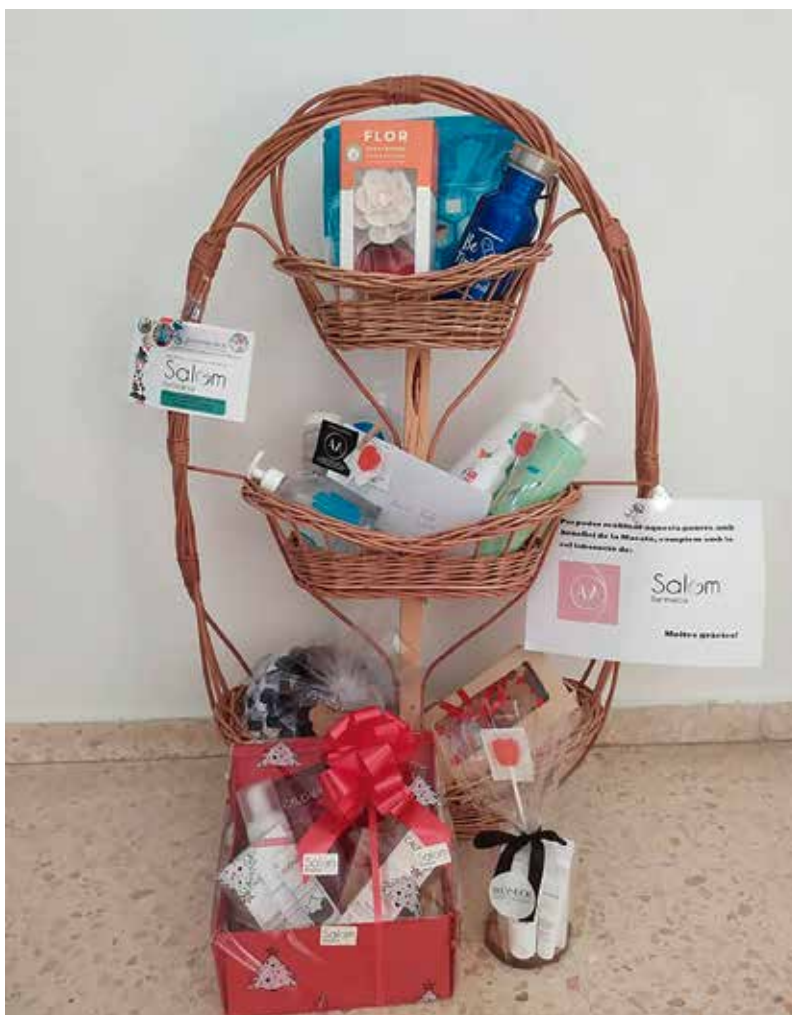
La Gruneta va sortejar la panera del Benestar.