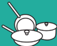
Estris de cuina