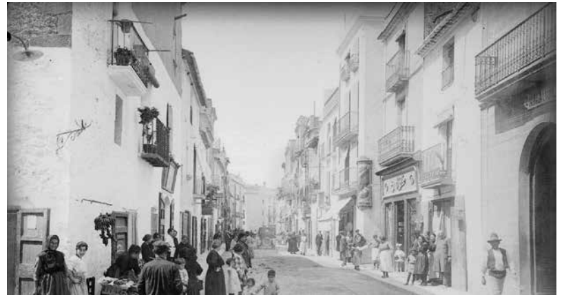
El carrer Major d'Ampostà a principis de segle XIX, una de les artèries comercials de la ciutat.

Des del 2001, el Consorci del Museu de les Terres de l'Ebre ha atorgat aquests ajuts econòmics que han permès la