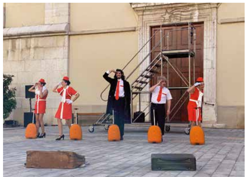
La companyia Iluya va posar el toc d'humor al matí de diumenge amb el seu espectacle Jet Lag.