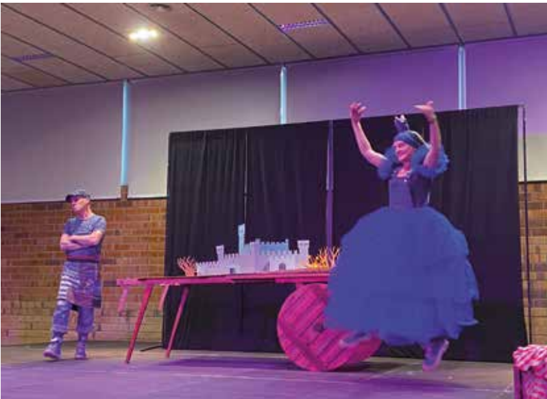
La proposta familiar va anar a càrrec de la companyia Sgratta, amb La Princesa dels Texans, que es va traslladar a l'auditori municipal pel fort vent.