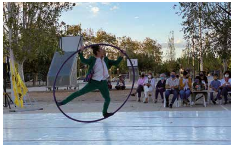
La proposta Save de The Temazo , del Col·lectiu F.R.E.N.È.T.I.C, va portar circ contemporani, teatre, videoclips i molta música al pati del Soriano Montagut, convertit en un teatre de carrer per a l'ocasió.