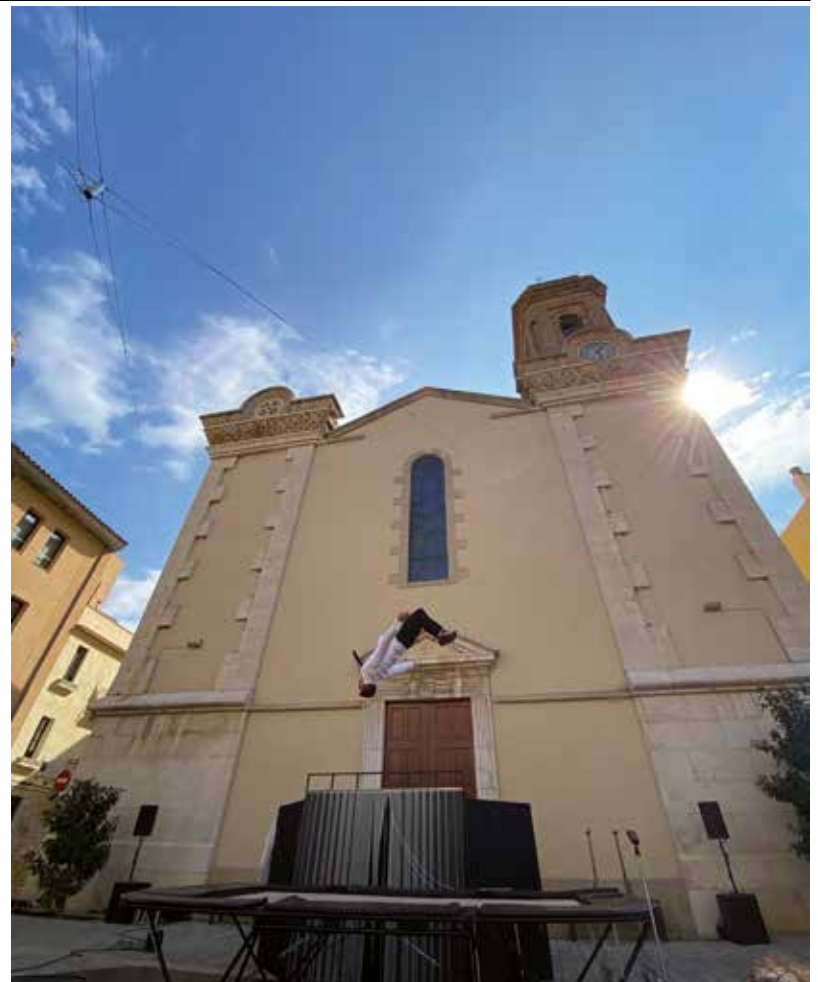
Les acrobàcies de Planeta Trampolí amb el seu espectacle Back 2 Classics van fer riure a grans i menudes.

Malgrat ser una edició diferent i adaptada a la situació de pandèmia,