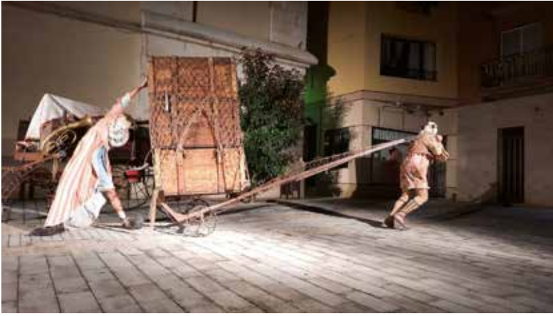
La companyia Burcaá circus va ser l'encarregada d'inaugurar el FesticAM amb el seu espectacle 'El Gran Final'.