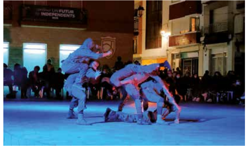
Iron Skulls va portar la seva proposta de dansa amb Sinestèsia.