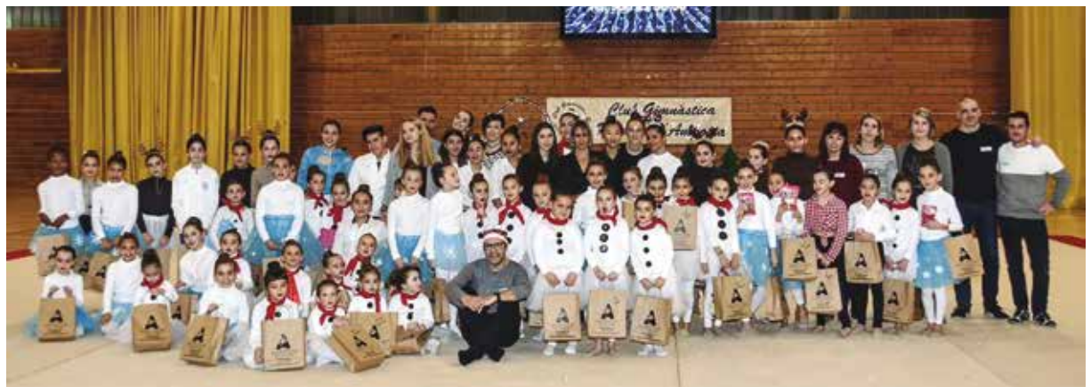
Festival del Club Gimnàstica Rítmica Amposta.