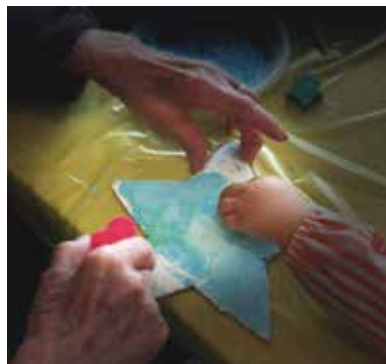
Estel realitzat pels alumnes de la llar d'infants La Sequieta.