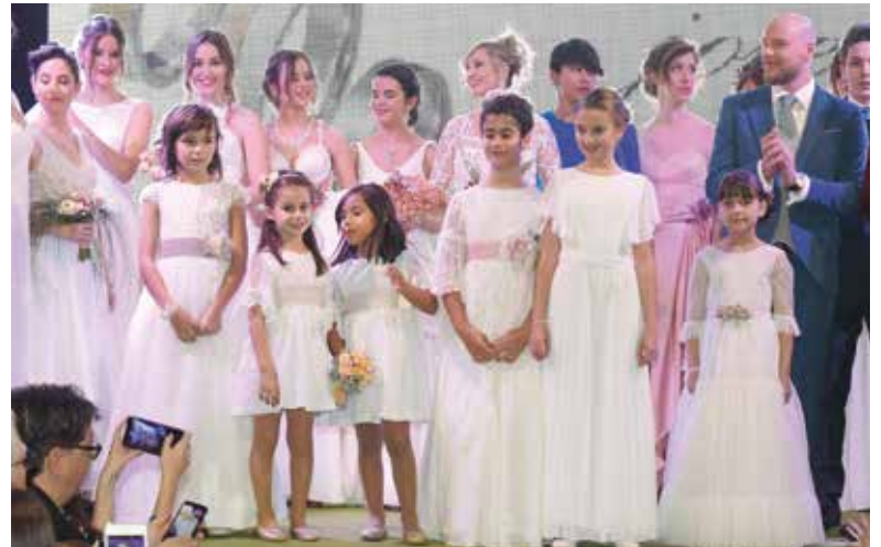
Desfilada de roba nupcial, festa i comunió.