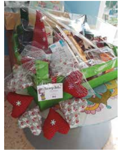
Cistella sortejada a la llar d'infants La Gruneta.