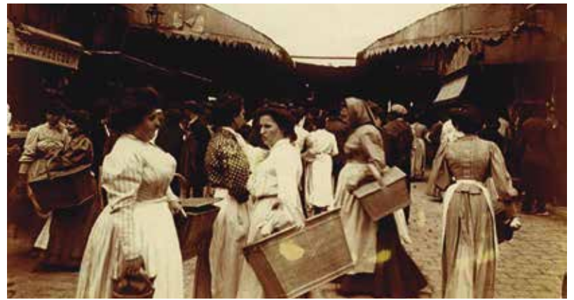
Foto de finals del segle XIX, compradores davant la façana principal.