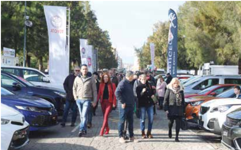
Exposició de vehicles.