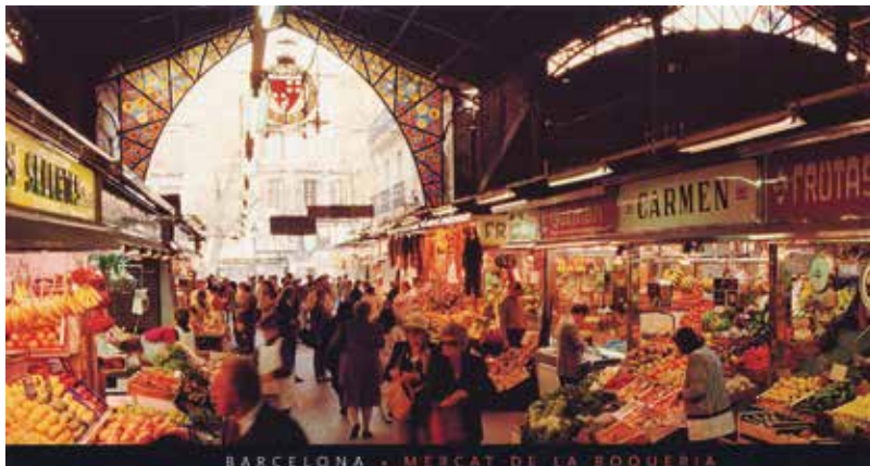
L'interior del Mercat de la Boqueria actualment.