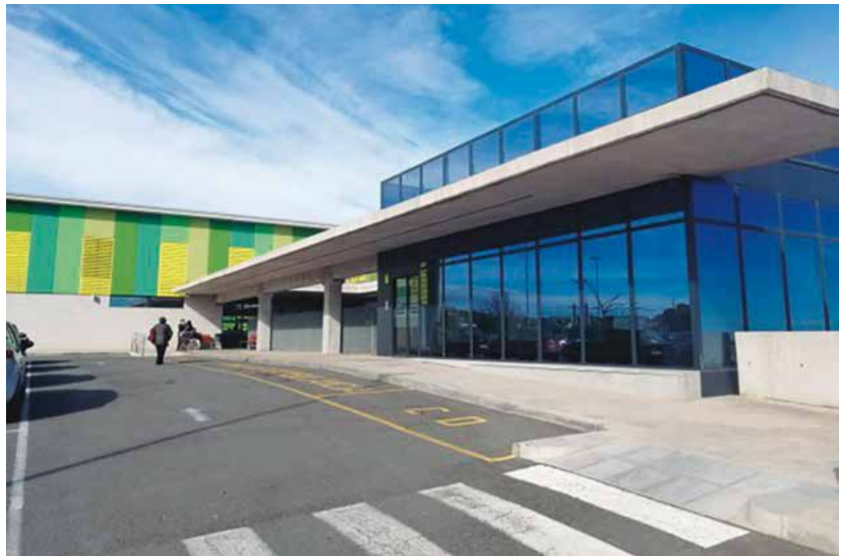
El pressupost preveu un préstec a Fussmont per refinançar la residència d'avis.

PRESSUPOSTOS > Els comptes inclouen 30.000 euros per a l'arranjament de la carretera al Poble Nou, 80.000 euros per a l'habitatge públic o 200.000 euros per a clavegueram