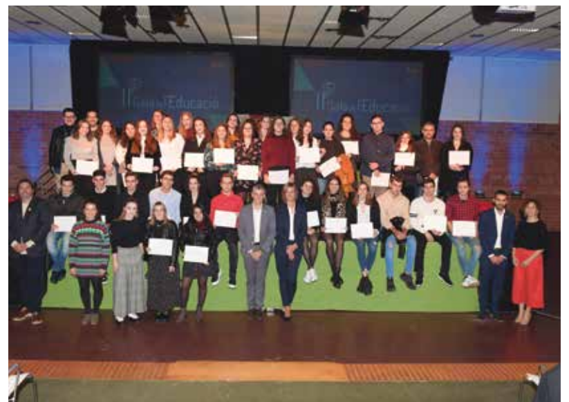
II Gala de l'Educació.