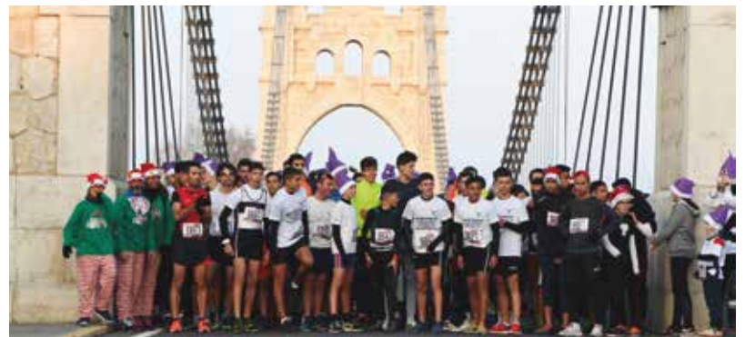
Com cada any, la Cursa de Sant Silvestre va ser de les activitats més multitudinàries.

El darrer dia de l'any, tant petits com grans van poder-ho celebrar amb una gran diversitat d'actes al llarg de tot el dia. Al matí, els infants van celebrar l'acomiadament de l'any amb les campanades infantils de les 12h del migdia a la Caseta del Nadal. A les 5 de la tarda, els més grans, van poder participar en la V cursa de Sant Silvestre, amb sortida des del pont penjant i arribada a meta a la plaça de l'Ajuntament. Els participants més atrevits es van animar a córrer pels