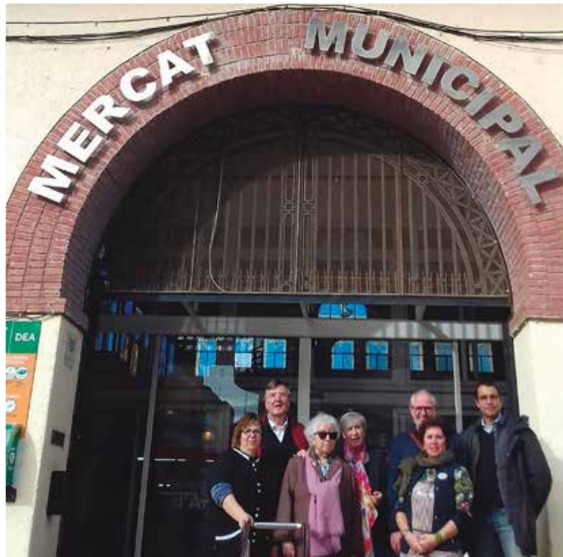
Visita dels representants del Mercat de la Boqueria a Amposta.

El diàleg entre representants dels diferents mercats sempre és positiu, a la vegada que una excel·lent manera exposar opinions i apropar criteris. En els darrers temps s'han produït grans canvis en els hàbits de comprar, molta gent al moment d'adquirir els productes frescos de consum diari no va als mercats tradicionals, això fa que aquests tinguin que analitzar el perquè d'aquesta situació. Cal revisar els mètodes que utilitzen, adaptar-se a les noves tecnologies i fer front als nous reptes que la globalització ens marca.