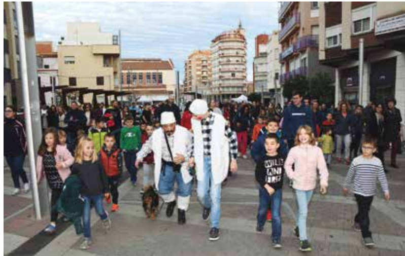
Activitat 'Anem a buscar el tió'.

Les llars d'infants municipals d'Amposta també van participar-hi. A La Gruneta, les educadores van comprar productes de proximitat de la terra i van fer una cistella, que es va sortejar el dia 13 de desembre entre els familiars