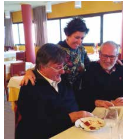
Lliurament del dossier del Mercat d'Amposta, als representants del Mercat de la Boqueria.

La Boqueria és un Mercat emblemàtic i un referent històric, social, cultural i turístic. Els seus orígens venen de lluny, els primers documents trobats són del segle XIII, en ells ja es descriu un mercat ambulant en l'actual zona de la Boqueria. En aquella època eren comerciants dels afores de Barcelona, els que venien a la ciutat a vendre els seus productes, cosa que va tenir una bona acceptació entre