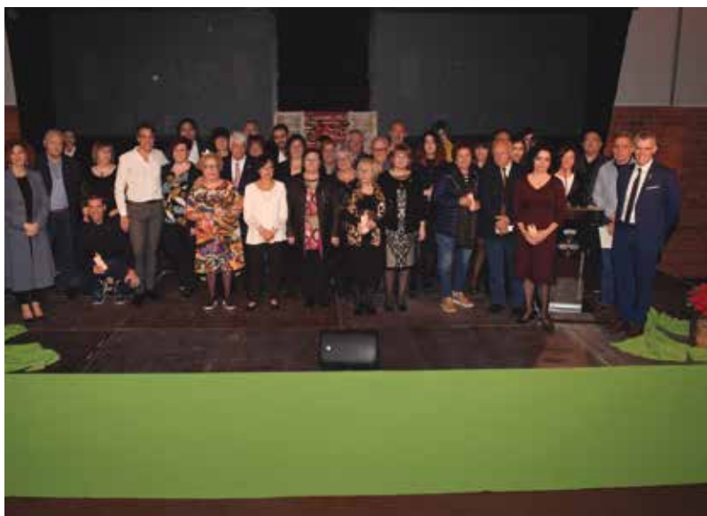
Gala del Comerç.

En el marc de la Fira de Mostres es va celebrar la Gala de Comerç, que va reconèixer a 33 establiments del municipi, amb una llarga trajectòria. També es va celebrar la Gala de l'Educació on es van entregar els premis a l'Excel·lència a l'Estudi a més de 150 estudiants del municipi ■