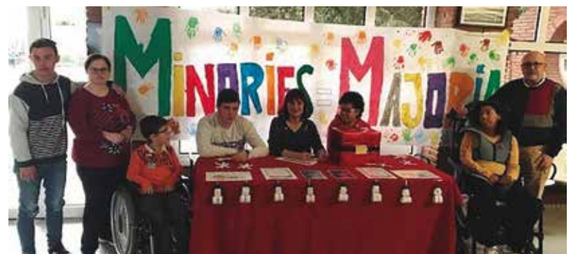
Apasa va organitzar una venda solidària.

que van comprar un número. A la llar d'infants La Sequieta, els més petits van preparar uns estels amb les paraules: live, laugh, love (viu, somriu, estima), i ho van entregar a totes les persones que van col·laborar amb la Marató.