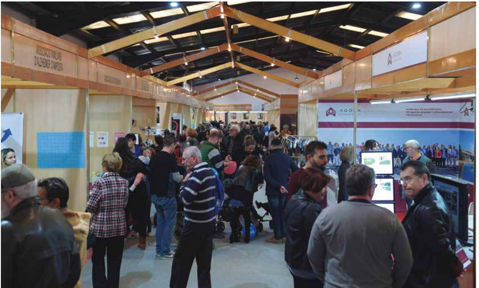
Interior de la Fira al Pavelló 1 d'Octubre.