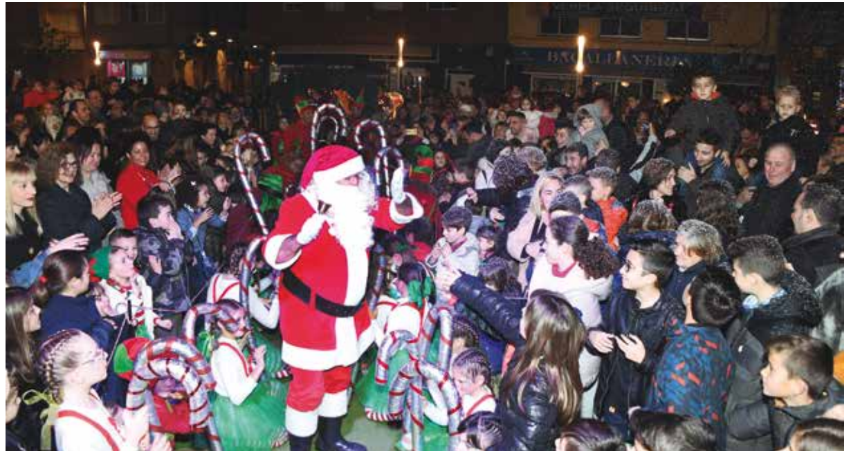
El Pare Noel va visitar la Caseta del Nadal on va ser rebut per una gran multitud de gent.

El diumenge 29 de desembre es va dur a terme la cursa nedant 'Neda el Nadal', on un total de setze valents es van llençar al riu Ebre. Una cursa solidària en benefici de Creu Roja Amposta. I per acomiadar l'any, els