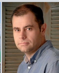
German Ciscar SOM Amposta