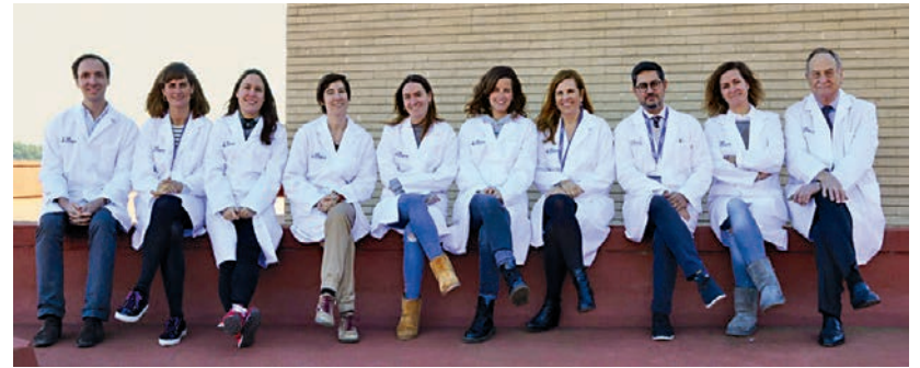
L'equip de Psiquiatria, Salut Mental i Addiccions del Vall d'Hebron Institut de Recerca, del qual forma part Richarte.

Depèn de la intensitat i de la gravetat dels símptomes. El que diuen les guies de pràctica clínica és que si és un TDAH lleu, ens en podem sortir mitjançant