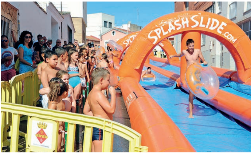
Enguany la 22 super festa aquàtica amb inflables va comptar amb un gran tobogan d'aigua.