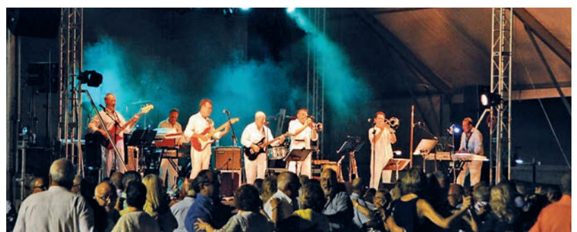
Els Pirómbodas-Sherpas van acompanyar el mític grup Fórmula V.