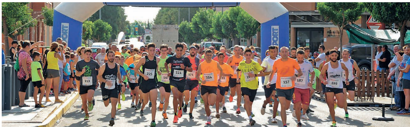
La marató popular de dilluns al matí enguany va sortir del pavelló firal.