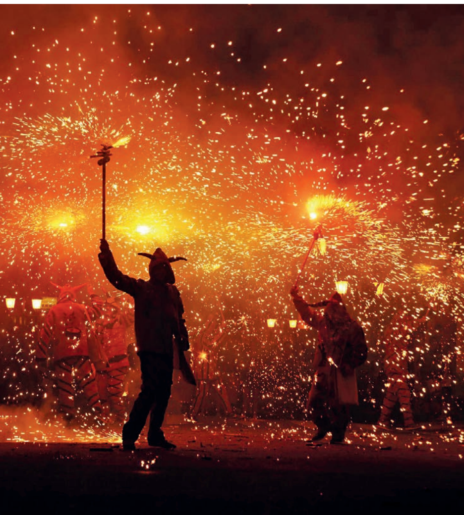
ies van omplir de foc els carrers d'Amposta diumenge a la nit.