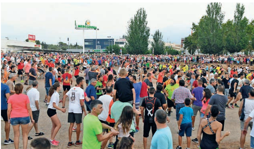
La sortida del primer bou capllaçat és una de les més multitudinàries.