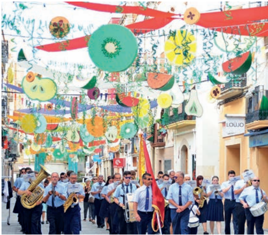
La Fila va acompanyar a la gent gran en l'Homenatge a la vellesa.