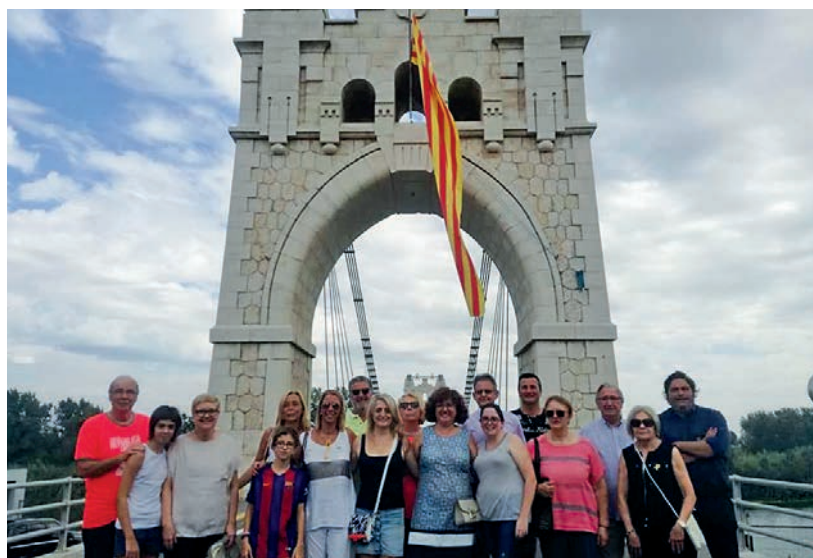
Gent del Partit Demòcrata celebrant la Diada a Amposta.

Tapar i destapar haurien de ser dos verbs que haurien de desaparèixer del nostre vocabulari polític. I com