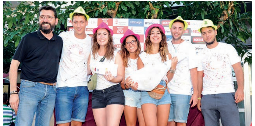
El premi a la samarreta més original va recaure en la colla Els Patets.