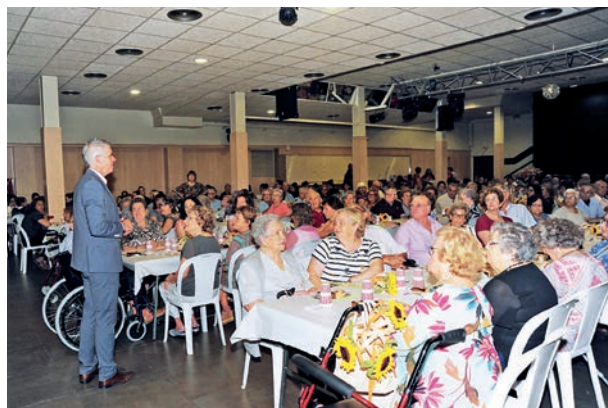
Els avis van ser protagonistes, un any més, de l'homenatge a la vellesa.