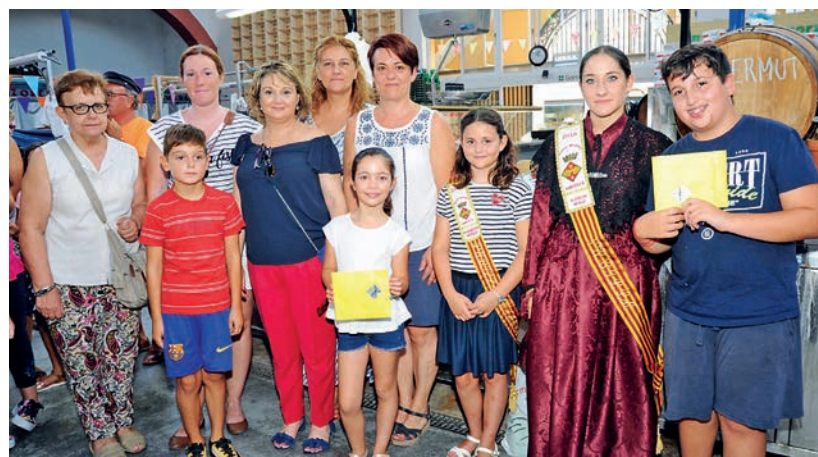
Guanyadors del concurs de truites i dolços organitzat per l'Associació de Venedors del Mercat.