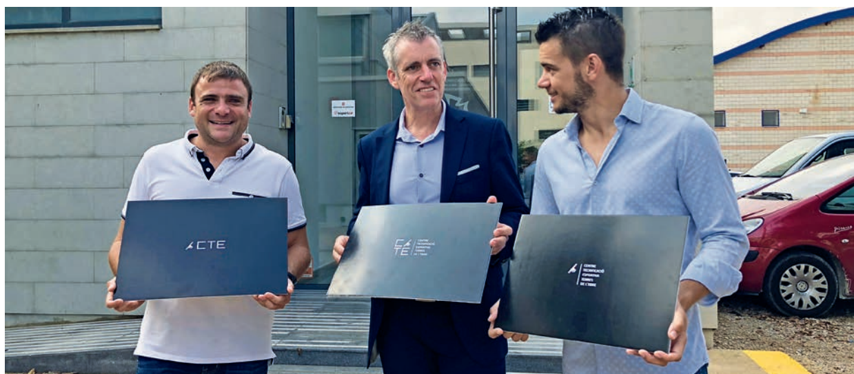
L'alcalde, el regidor i el director del CTE Terres de l'Ebre amb la nova imatge.

"El Centre de Tecnificació està agafant un volum d'activitat molt important, cada cop hi ha més concentracions d'esportistes", ha assenyalat l'alcalde, que ha aprofitat la presentació de la nova imatge per a fer balanç de l'activitat del centre. "La tendència que estem vivint és a l'alça", ha afegit el regidor d'Esports, "tant pel que fa al nombre dels esportistes com a la diversitat de modalitats esportives que fan estades". Ha aportat algunes dades. El curs 2016-2017 van concentrar-se més de 510 esportistes en les diferents estades externes al centre; el curs 2017-2018 aquesta xifra superarà els 630. "La tendència és anar augmentant aquest nombre i augmentar el número total de concentracions, facilitant a grups, clubs i entitats es-