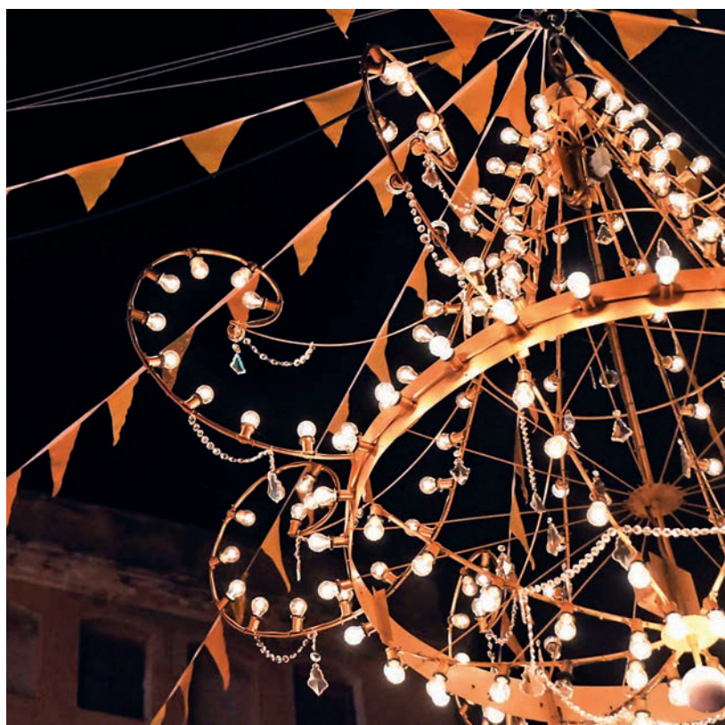
Detall de la làmpada La Perla, que va presidir la decoració de la plaça de l'Ajuntament.