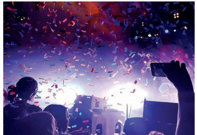
Els Amics de les arts van fer una part del concert amb una camiseta del nus, com a mostra del seu suport a la lluita antitransvasista.