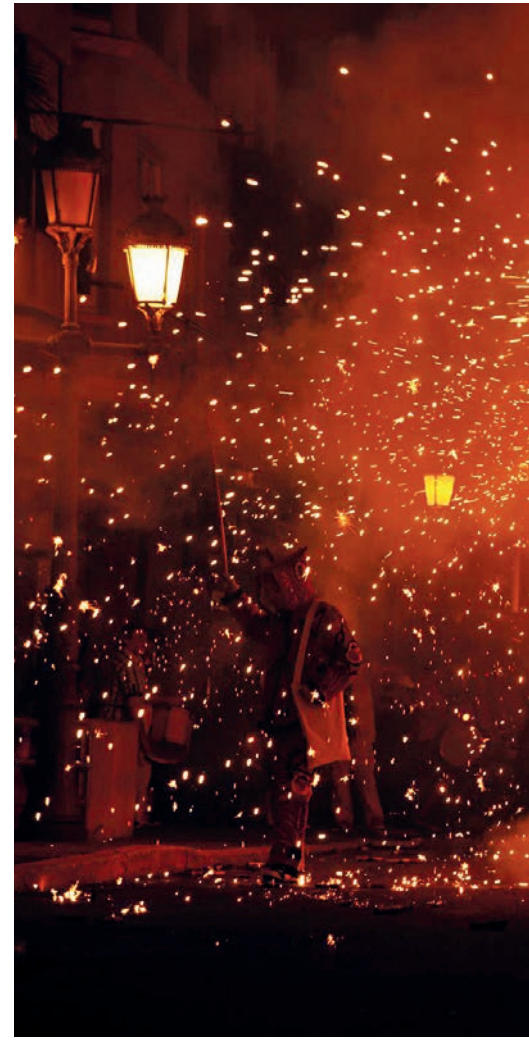
La primera trobada de Colles de Diables i Bèsties.