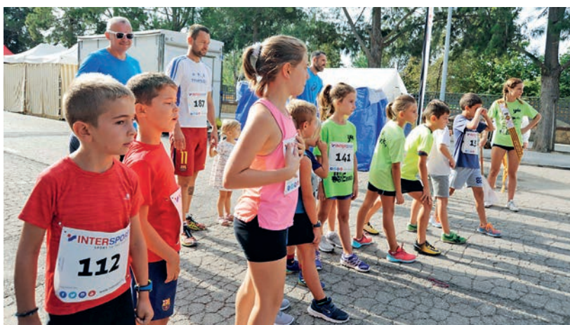
Els més petits també van poder participar en la marató popular.