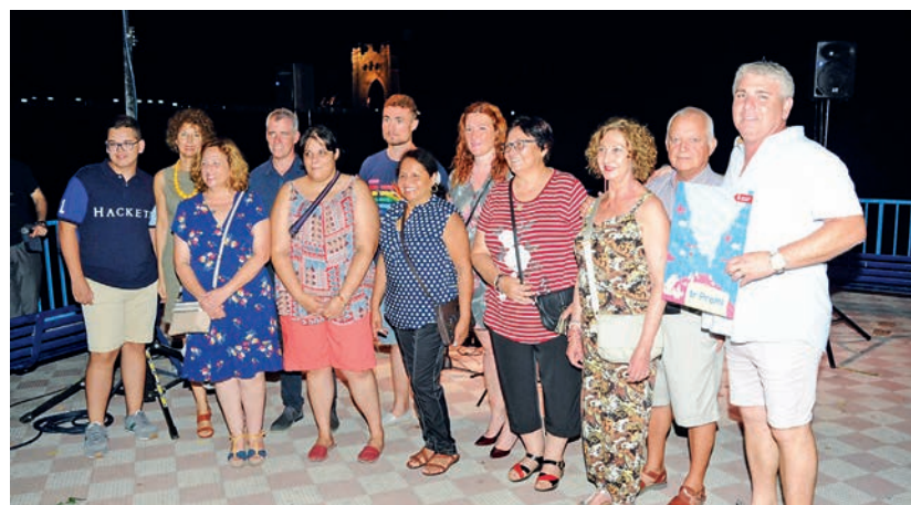
Acte d'entrega del premi del Concurs de Carrers Engalanats, que enguany es va endur la decoració del carrer Major.