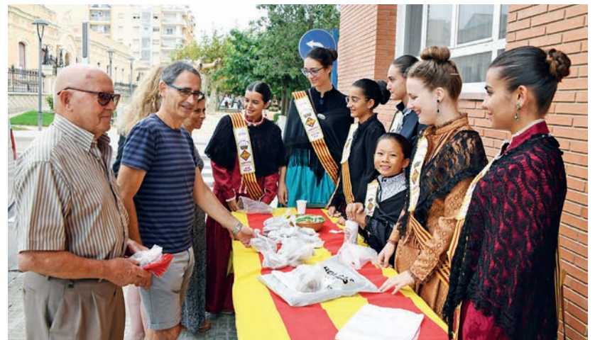
Les pubilles repartint el panoli el divendres al matí.