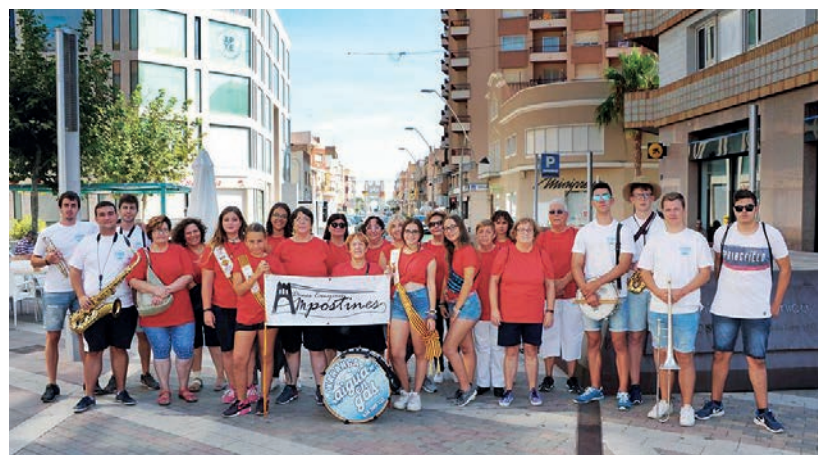
Imatge de família de les participants a la Trobada de Dones Canyeres.