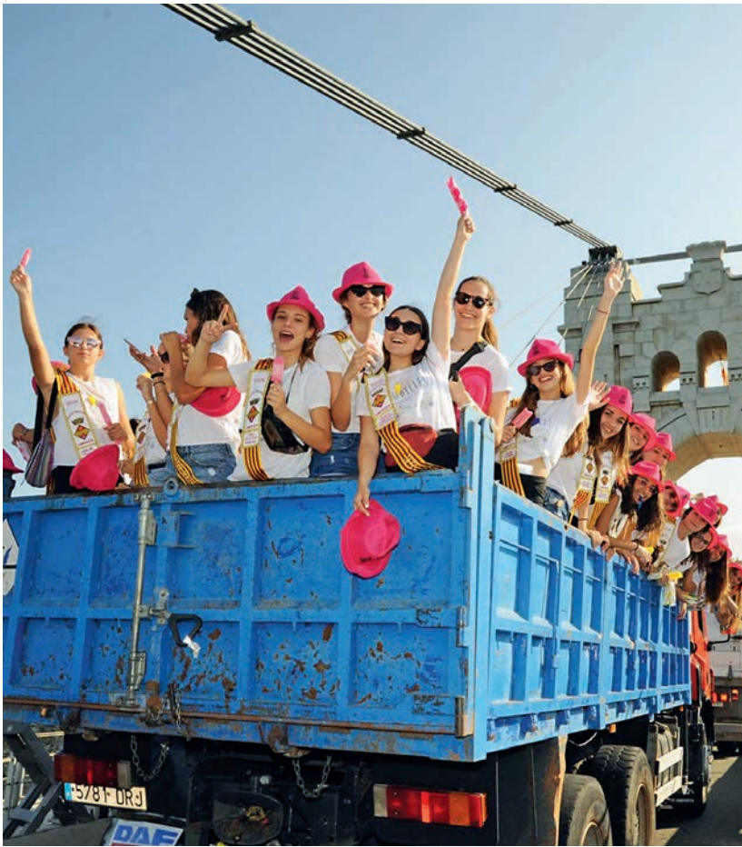
Les pubilles a l'arribada del bou, divendres a la tarda.