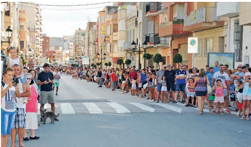
L'avinguda alcalde Palau es va omplir de gent per a l'arribada del bou.