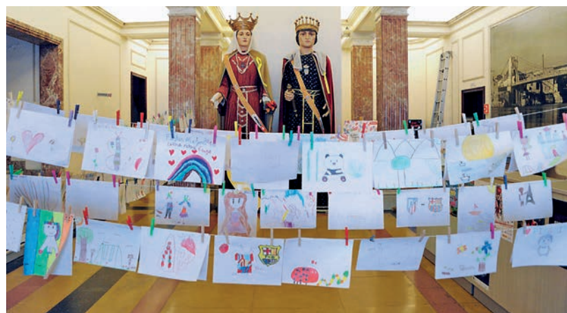
Exposició dels dibuixos participants al concurs de pintura ràpida. La pluja va obligar a suspendre l'espectacle de la tarda.