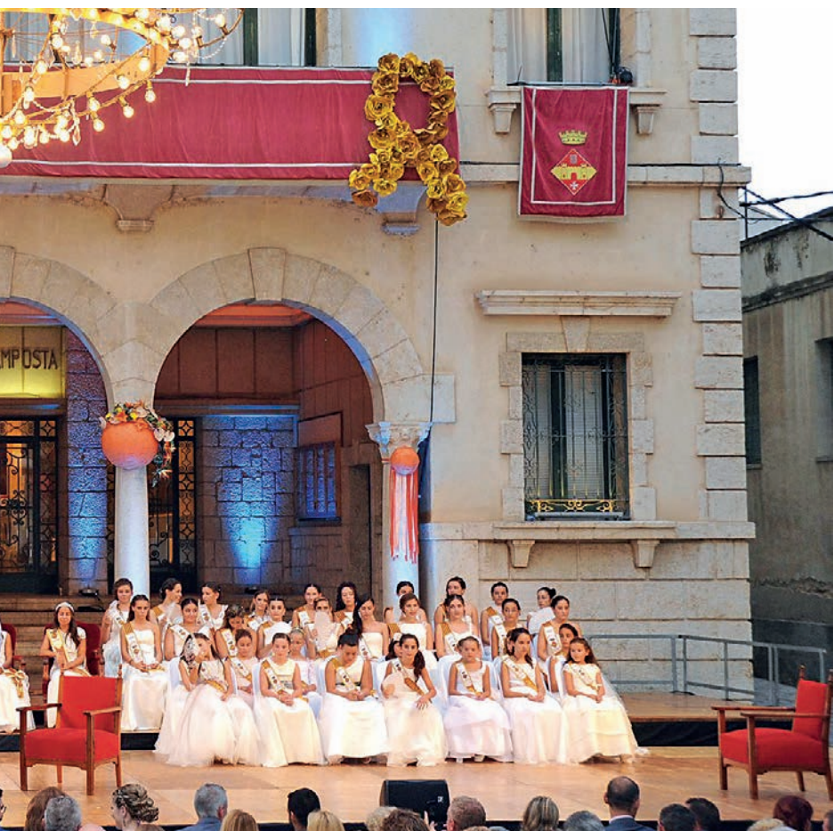
que es fes la seva proclamació.