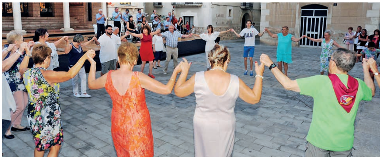
Tradicional ballada de jotes, enguany a la plaça de l'Ajuntament.