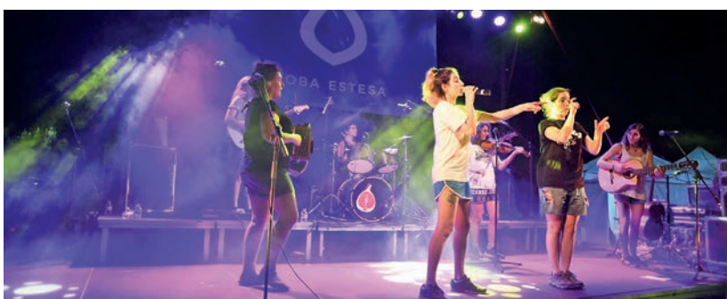
El grup femení i feminista Roba Estesa va posar punt i final musical a les Festes.