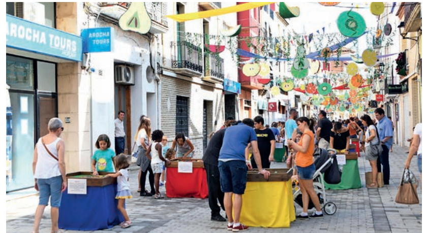
El carrer Major ple de jocs de fusta.