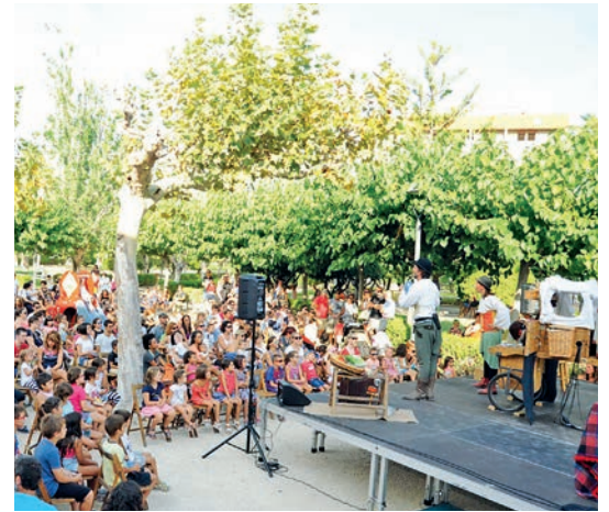
Enguany, l'Animació Una carretada de Contes va animar la xocolatada infantil.