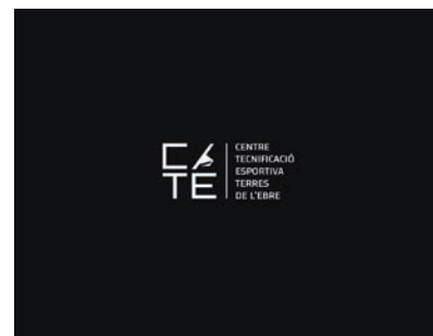
Aplicació principal del nou logotip del CTE Terres de l'Ebre.

44x23; un camp de futbol de tercera generació amb gespa artificial; un centre de tecnificació multidisciplinar; una residència d'estudiants amb capacitat