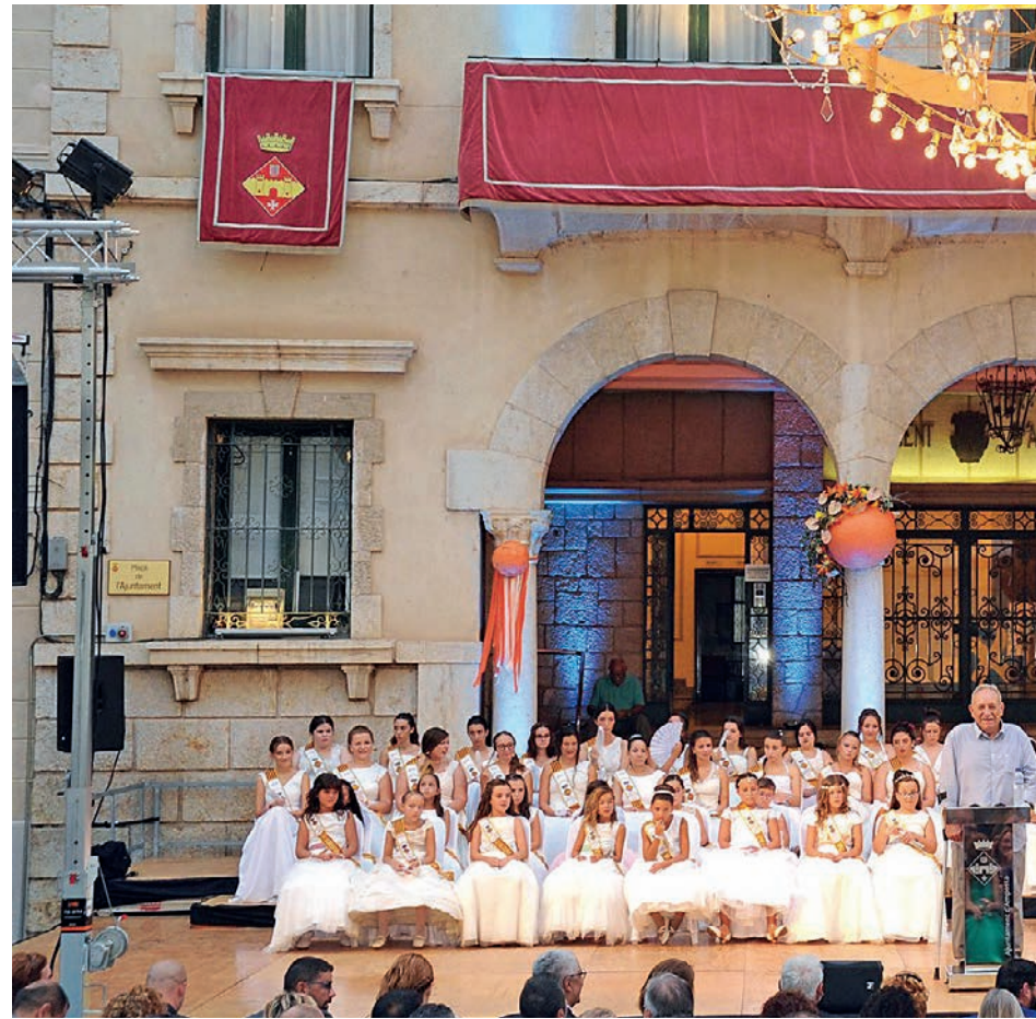
Com és habitual, les pubilles van acompanyar al pregoner dalt de l'escenari, després