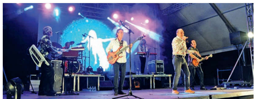
Els més nostàlgics van ballar les cançons de Fórmula V.