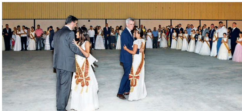
Malgrat que estava previst per a dilluns 13 a la nit, la pluja va obligar a ajornar-ho i el ball de pubilles i pubilletes va ser dimarts 14.