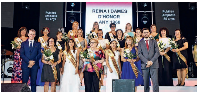
Foto de família amb les pubilles de fa 25 i 50 anys que van tindre el seu especial homenatge dimarts 14.