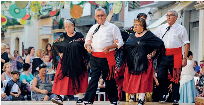
Enguany, Amposta Jota Viva va arribar a la desena edició.