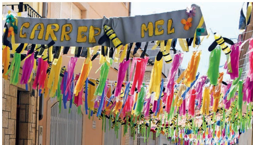
El Carrer Nou es va convertir en el carrer de la Mel durant els dies de Festes.