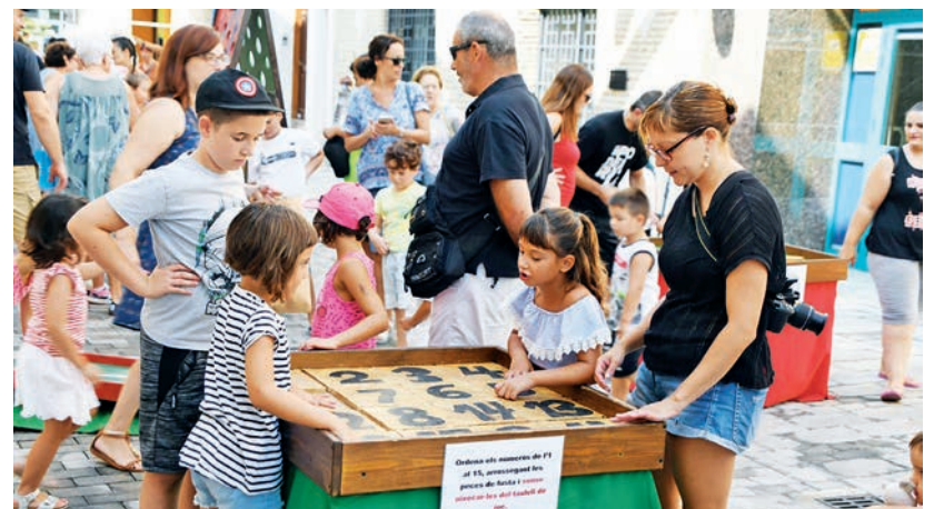
25 jocs de fusta, Fustes i Fustetes i la Cúpula de Leonardo va omplir de jocs per als menuts i menudes de casa el carrer Major dilluns 13 al matí.