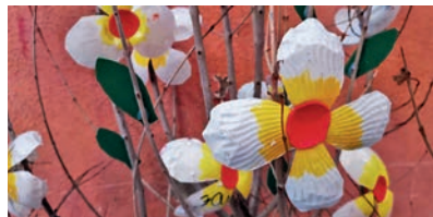
Detall de la decoració del Poador.