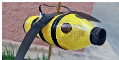
Detall de les simpàtiques abelles.