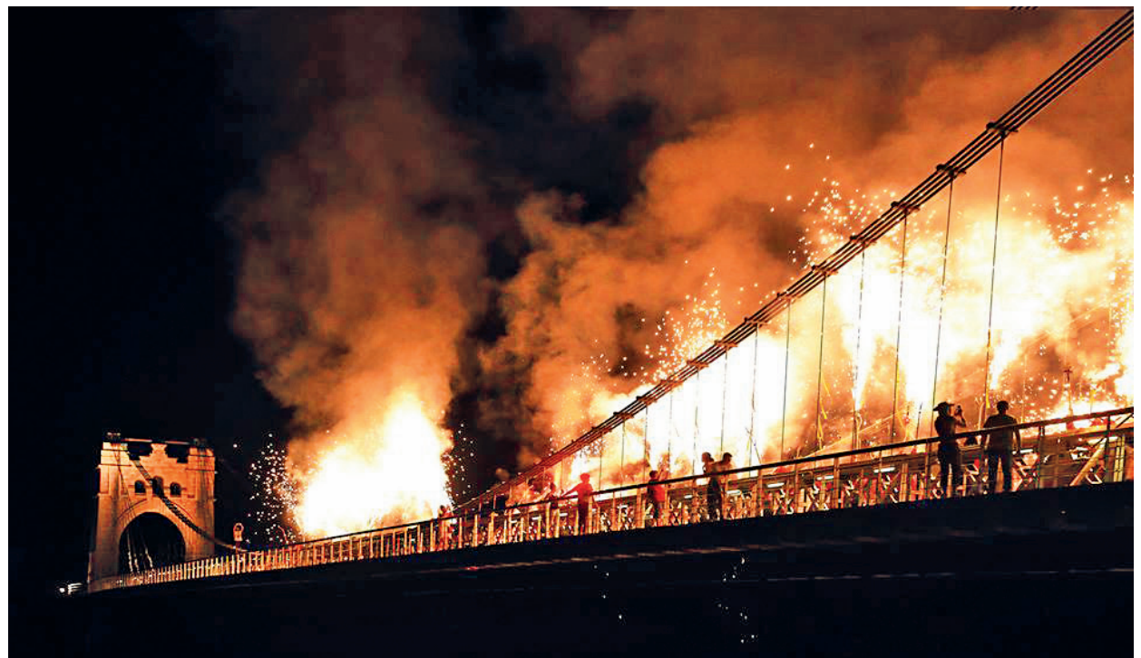
El Pont Penjant es va encendre en el marc de la Trobada de Diables i Bèsties de Foc.