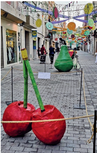
Unes grans fruites ocupaven la part central del carrer Major.