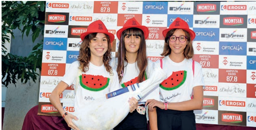
Para Malas nosotras va endur-se el premi a la camiseta més currada.