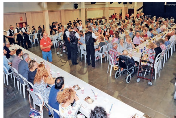
Guardet va animar l'Homenatge a la vellesa amb unes jotes cantades.