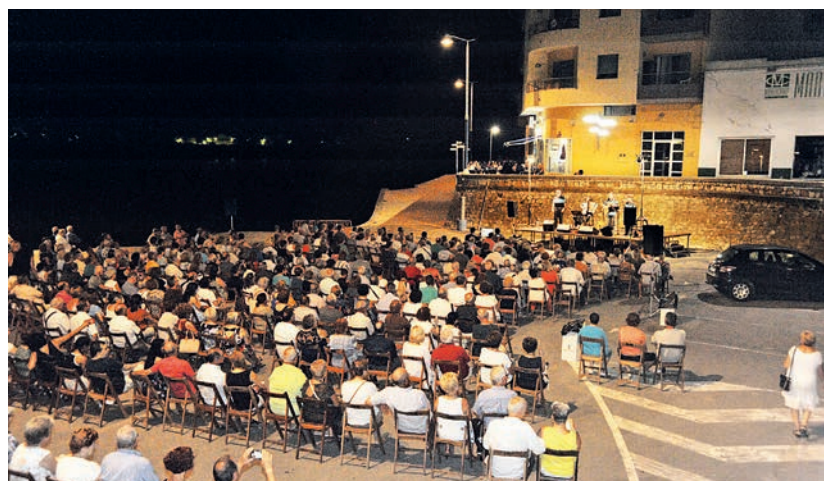
Dissabte 11 a la nit, a l'embarcador, va tindre la tradicional cantada d'havaneres.