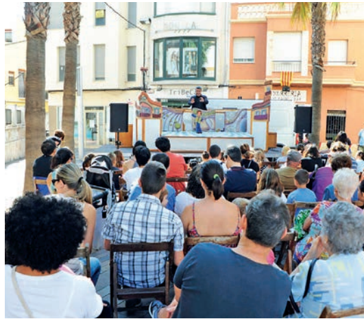
Les activitats infantils, com les Titelles Oiaraki, el castell dels ocells van atraure molta gent.