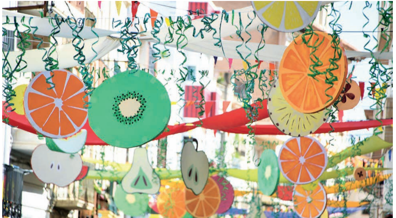
El carrer Major es va endur el premi del Concurs d'Engalanats d'enguany.

La decoració amb fruites gegant que van elaborar els veïns del carrer Major va servir enguany a aquesta via per endur-se el premi del concurs de carrers Engalanats, que convoca des de fa tres anys la regidoria de Joventut i Participació Ciutadana en el marc de les Festes Majors i que enguany tenia les novetats d'incloure un únic premi i de les aportacions econòmiques a tots els participants. El jurat, però, també va destacar el treball fet pels altres dos carrers participants: el carrer Nou, que estava decorat amb la mel i les abelles com a protagonistes, i el carrer del Poador, decorat també amb temàtica primaveral. ■