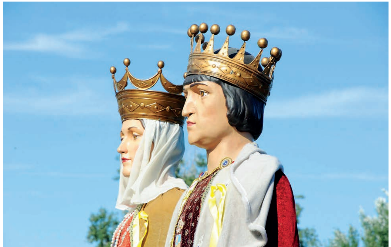
Els Gegants d'Amposta van celebrar enguany 70 anys i també van recordar, durant totes les festes, els presos i exiliats polítics lluint un llaç groc.

Entre les novetats del programa d'enguany hi destacava la Primera Trobada de Diables i Bèsties de Foc, organitzada per la Colla de Diables Lo Minotaure, que malgrat la pluja de la tarda va atraure molta gent al recorregut i va acabar amb un gran espectacle de foc. També hi destacava la Trobada de Gegants, que enguany va arribar a la trentena edició i va coincidir amb el 70è aniversari dels Gegants d'Amposta, que es van estrenar coincidint amb les Festes Majors de l'any 1948. ■