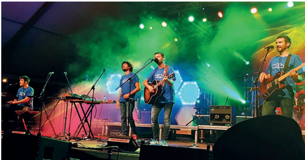
Els Amics de les Arts van visitar per primer cop Ampostà dins la gira Un estrany poder.

Finalment, per acabar les festes, un concert més reivindicatiu. El del grup femení i feminista Roba Estesa. En aquest cas va ser al pàrquing de les antigues piscines i després dels focs artificials que posaven punt i final a les festes majors. ■