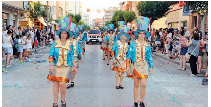
Les carrosses van omplir de confeti l'avinguda de la Ràpita.