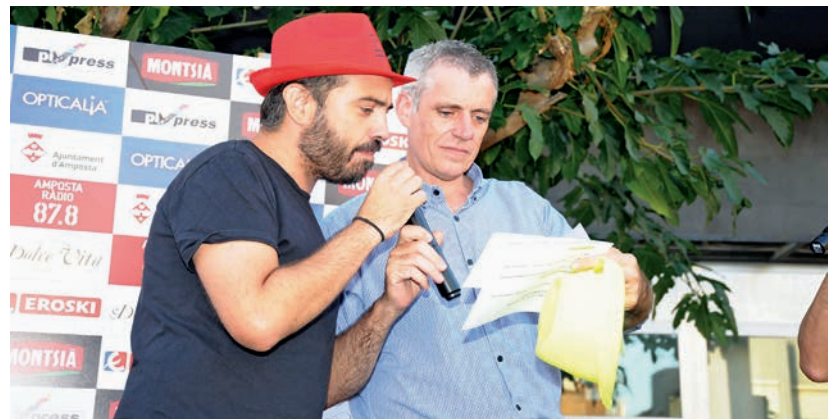
Els premis del concurs de samarretes es van entregar, com és habitual, el primer divendres de festes a la plaça del mercat.