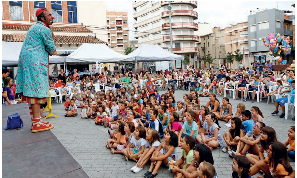
S'han programat prop d'una desena d'activitats infantils a diferents espais.

Quant als actes taurins, el regidor responsable de bous, Marc Fornós, assenyala que s'ha mantingut una estructura similar a la de l'any passat. Una de les principals novetats és que l'encierro dels migdies es farà al carrer Barcelona i el bou del embolat del primer dia, també al carrer Barcelona i al carrer Alacant, des de l'alçada del carrer Toledo fins al carrer Sant Domènec. ■