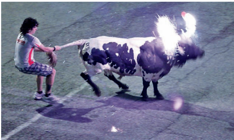
El bou embolat enguany serà als carrers Barcelona, Alacant, Terol, Castelló, Josep Dámaso, Ulldecona, València, Sant Domènec.