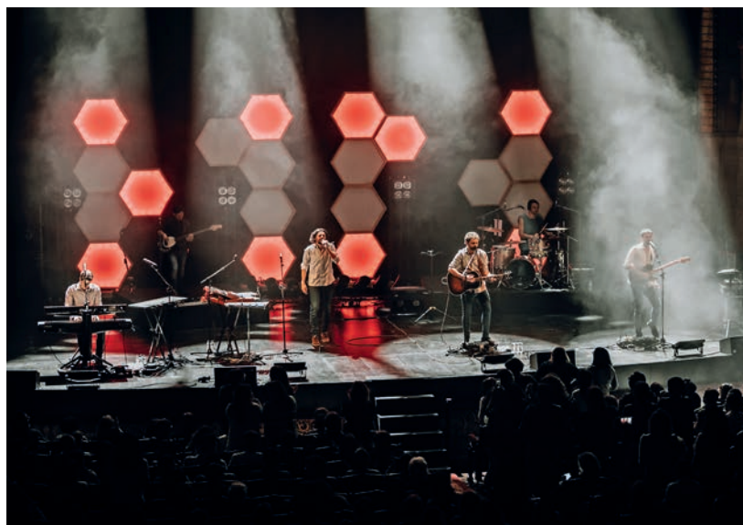
Els Amics de les Arts són un del plat fort de les nits musicals.