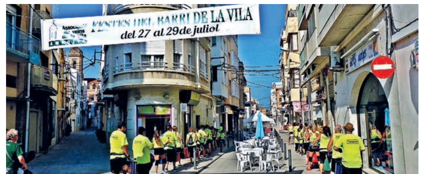
Batukeem va animar les festes del barri de la Vila.