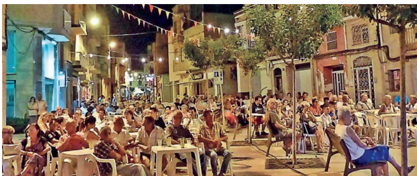
El barri de la Vila va celebrar diferents activitats a la plaça del carrer Corsini.