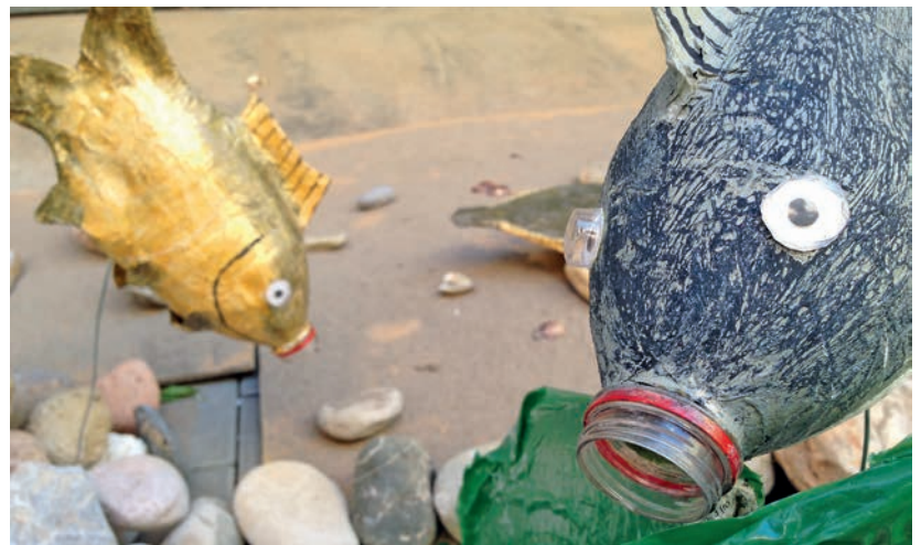
Els concursos de carrers Engalanats torna per tercer any.