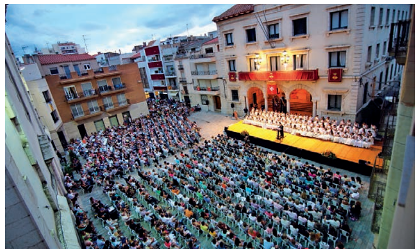
La plaça de l'Ajuntament tornarà a ser un punt central de les Festes, amb el pregó, l'actuació d'Andrea Motis o el concert de bandes, entre d'altres.

la primera trobada de cantadors ciutat d'Amposta: la dona cantadora (dilluns 13), la X Trobada de grups de jota; Amposta Jota Viva 2018 (dijous 16) o el concert Dixie Debbie Palfreyman & Friends (dissabte 18), una activitat inclosa dins el Festival Internacional Ebre Terra de Vent.