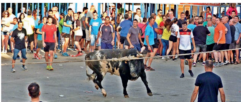
El bou capllaçat del Grau atrau molta gent d'arreu de la ciutat.