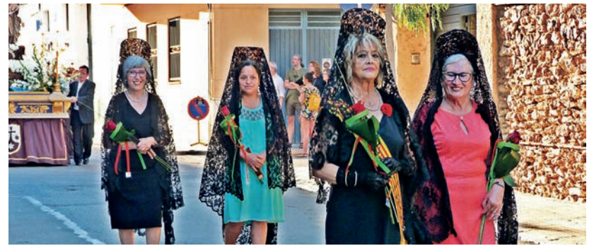
Com cada any, al barri del Grau van celebrar la tradicional processó en honor a la Verge del Carme