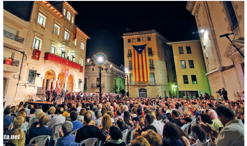
El concert de bandes tornarà a ser retransmès per la Xarxa de Televisions Locals de Catalunya.

La plaça de l'Ajuntament tornarà a ser un dels espais de referència de les propostes musicals per a les