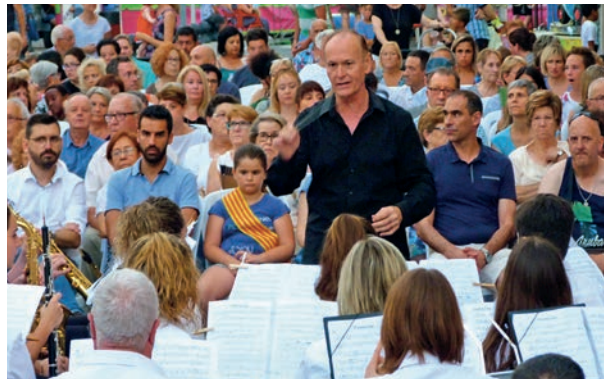
La Lira va fer un concert al barri de l'Acollidora.

E l Centre, l'Acollidora, el Grau, la Vila,... els diferents barris d'Amposta han aprofitat els dies d'estiu per organitzar activitats festives i compartir activitats amb els seus veïns. Des del barri del Centre, que van ser els més matiners en l'organització de les seves festes, ja que es van celebrar a principis de juny, fins el barri de la Vila, que les van celebrar l'últim cap de setmana de juliol, totes les associacions de veïns fan un esforç per traure al carrer els seus veïns i compartir activitats gastronòmiques, musicals i festives. ■