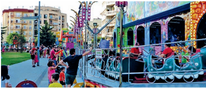
Com cada any, les atraccions infantils atrauen visitants a tots els barris. En aquesta foto, les atraccions al barri de l'Acollidora.