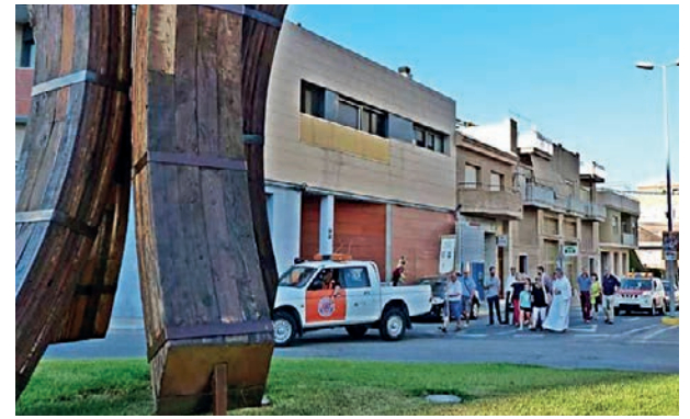
Processó de Sant Cristòfol i benedicció de cotxes en el marc de les festes del barri de l'Acollidora.