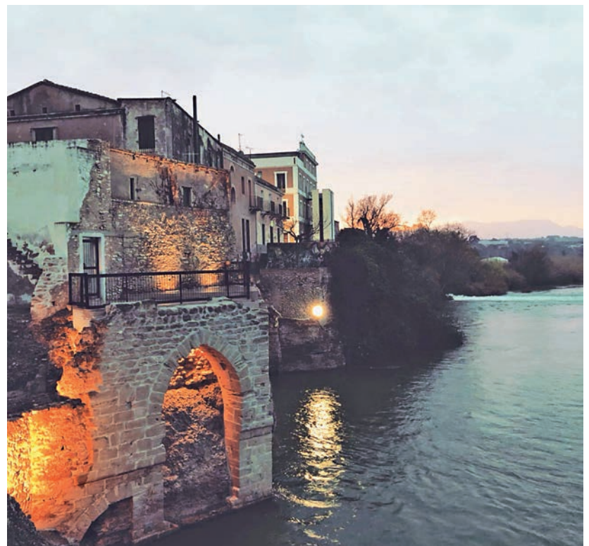
Imatge de l'arc gòtic restaurat ja il·luminat, primera fase de la recuperació de la façana fluvial.

El regidor d'Obres, Urbanisme i Activitats, Tomàs Bertomeu, va mostrar-se també molt satisfet per la presentació del projecte i va asse-