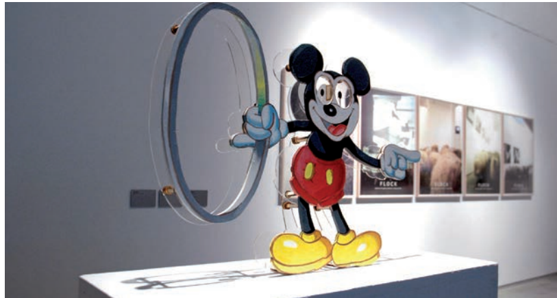
Detall de l'exposició 'El desig de creure', que es pot veure fins el 29 d'abril.