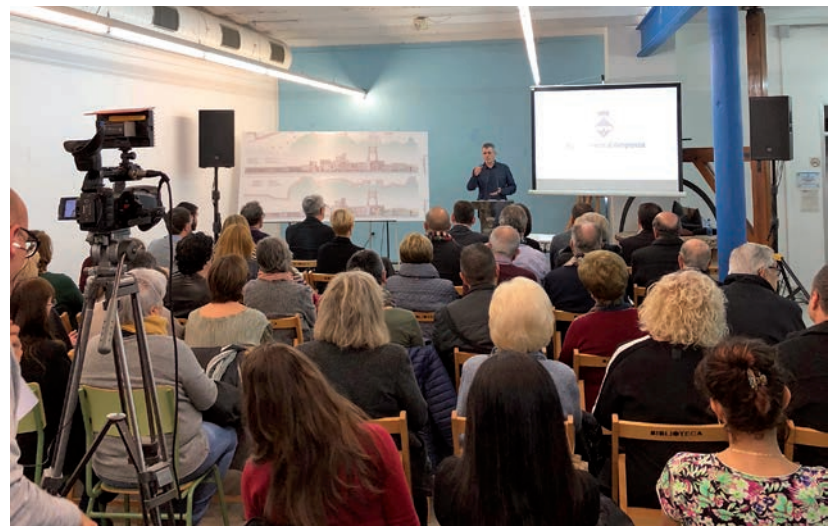
La presentació del projecte es va fer en un acte públic als baixos de la Biblioteca Comarcal Sebastià J. Arbó.