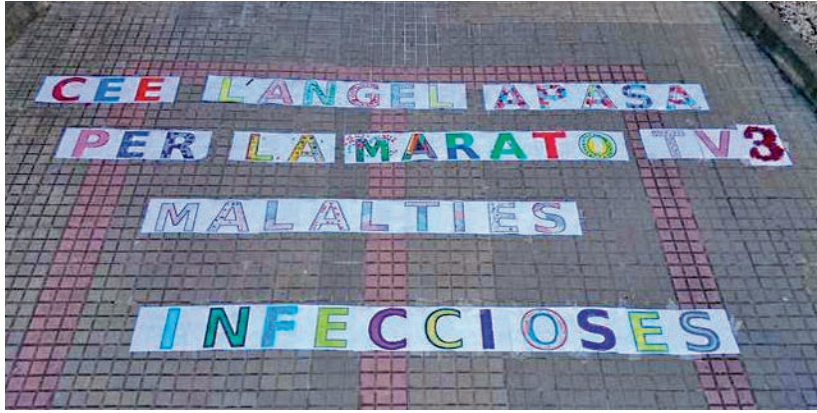
Apasa va recaptar 940.65 euros amb diferents tallers i una rifa solidària.