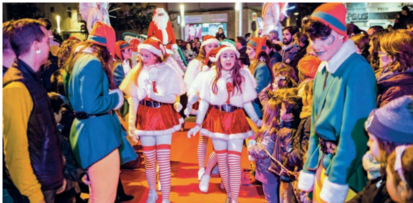
Les Superheroïnes del Nadal van animar amb la seva música en directe l'arribada del Pare Noel.

compra de joguines. Quant al Neda el Nadal, activitat organitzada per l'Ajuntament d'Amposta i Montbike i amb la col·laboració de Creu Roja, Prixpress, Eroski, i Llorenç grues i transports, va comptar amb la participació de 33 nedadors. Pel que fa a la Sant Silvestre, fins a 467 persones van córrer els prop de 5 quilòmetres d'aquesta última cursa. L'activitat va ser organitzada per l'Ajuntament d'Amposta, UltraRunners i SportSalut i la col·laboració de Creu Roja, Eroski, Publicenter, CardioProtect, Imposita, Music's&Classics, Homatic vendinc, Comercial Peris, Apasa i Pixpress.