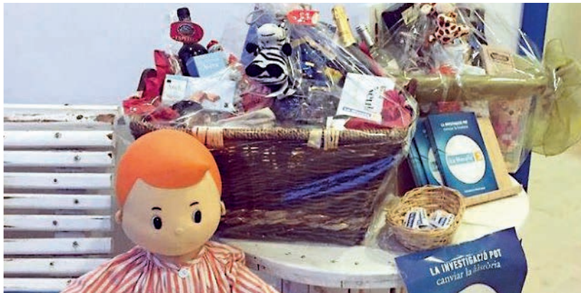
La llar d'infants La Sequieta va recaptar 163,80 euros amb el sorteig d'una cistella.