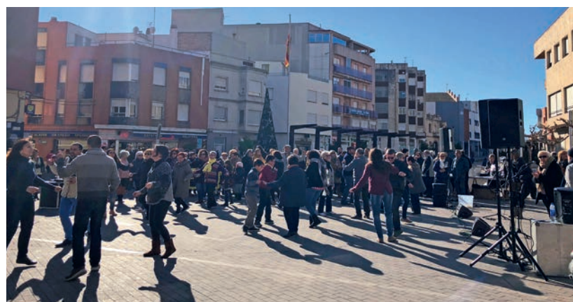
Com és tradicional, coincidint amb el Mercat de Santa Llúcia, es van ballar Jotes per la Marató per recollir més de 1.400 euros.