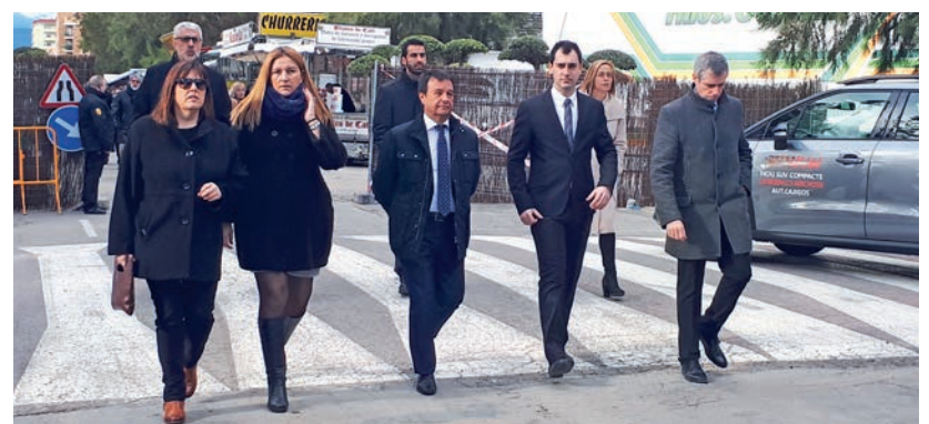
El Consell Comarcal va celebrar el Dia de la Comarca en el marc de la Fira, una jornada que enguany va estar dedicada a Ulldecona.

altres coses, com la Fira de Mostres ha col·laborat al llarg dels anys en la evolució tecnològica de la pagesia.