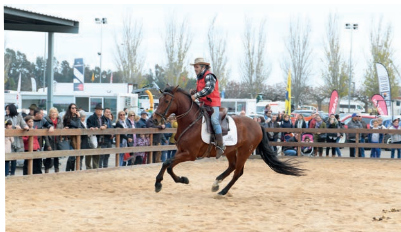
Les activitats hípiques i eqüestres són una part destacada del programa de la Fira de Mostres.