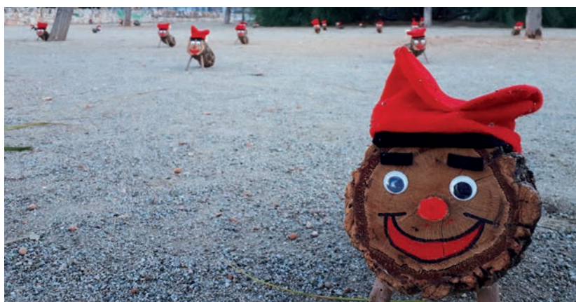
159 famílies van inscriure's en l'activitat 'Anem a buscar el Tió' i van recaptar més de 800 euros.

L'Associació d'Animació Juvenil Happy Smile van posar un estand al Mercat de Santa Llúcia on van vendre un berenar i van fer una rifa d'una cistella. En total van recaptar 240 euros. Finalment, Los dimarts al llar i el grup de dansa Paracota i Grup Instrumental Suc d'Ànguila i Guardet lo Cantador, amb les Jotes de l'Ebre per la Marató, van recollir 1.419 euros. ■