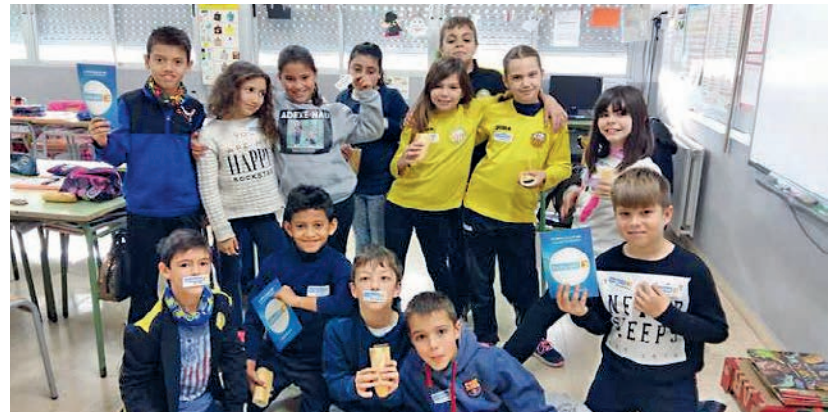
La comunitat educativa del Miquel Granell va recaptar 1.769,02 euros amb un esmorzar solidari.