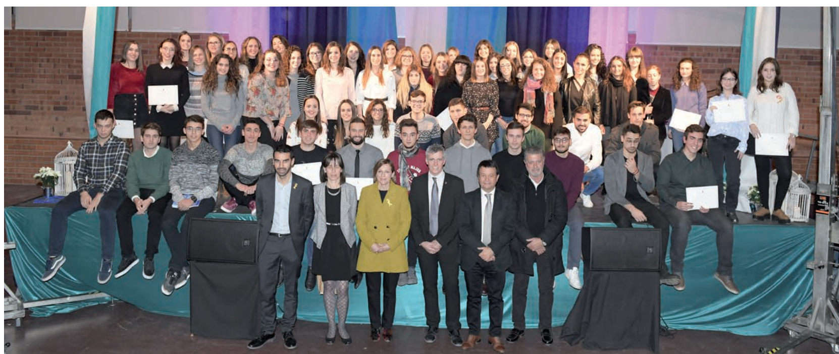
La presidenta del Parlament, Carme Forcadell, va presidir l'acte d'entrega de les beques a l'excel·lència a l'estudi.