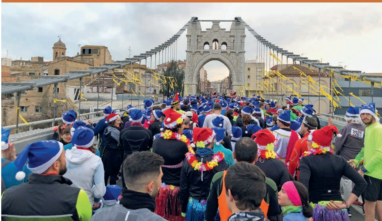
La Sant Silvestre va ser un dels actes més participatius de les festes nadalenques a Amposta, juntament amb activitats com l'arribada del Pare Noel o el Festival Solidari del Nadal.