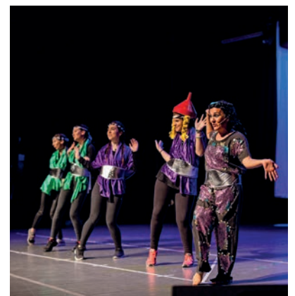
Les Mil i una Nits van inspirar el Festival Solidari de Sant Esteve.

A banda de la recaptació econòmica, la regidoria de Joventut i Participació Ciutadana va organitzar, durant el desembre, una recollida de taps solidària en benefici de la Fundació Noelia. A més d'instal·lar punts de recollida a entitats, associacions, centres educatius i comerços -que també es van adherir a la campanya, l'entrada a les activitats del Saló de Nadal van consistir en dos taps de plàstic. ■