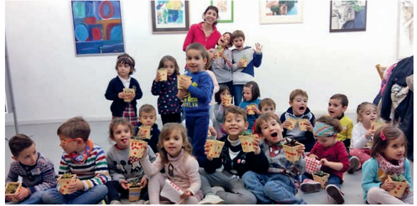
La Biblioteca Sebastià J. Arbó va realitzar una activitat dirigida a infants acompanyats de les seves famílies i van aportar 100,30 euros.