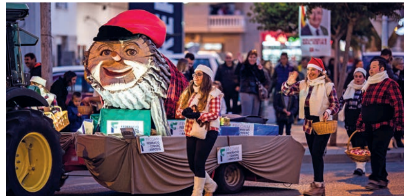
El Tió Gegant organitzat per Fecoam, que pel matí va cagar regals, per la tarda també va acompanyar la rua del Pare Noel.