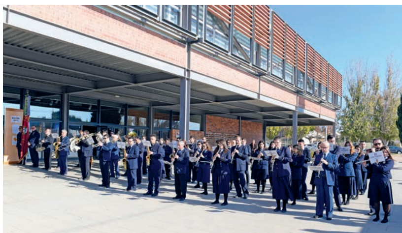
La Unió Filharmònica va acompanyar la inauguració de la Fira.