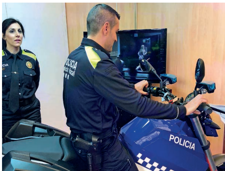
Els agents amb la nova uniformitat i la nova moto elèctrica. La presentació d'ambdues coses es va fer en el marc de la Fira de Mostres.