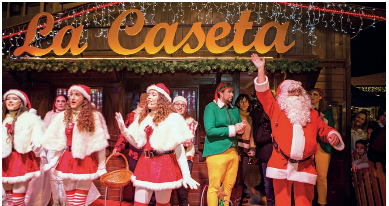
Un any més es va instal·lar la Caseta del Nadal a la plaça del Mercat. La tarda del 24 va rebre la visita del Pare Noel, que va fer entrega dels regals als xiquets i xiquetes.

Per la seua banda, les dos activitats esportives solidàries, la Sant Silvestre i el Neda el Nadal, van recaptar 1.583 euros que ja van ser entregats a Creu Roja, també per a la