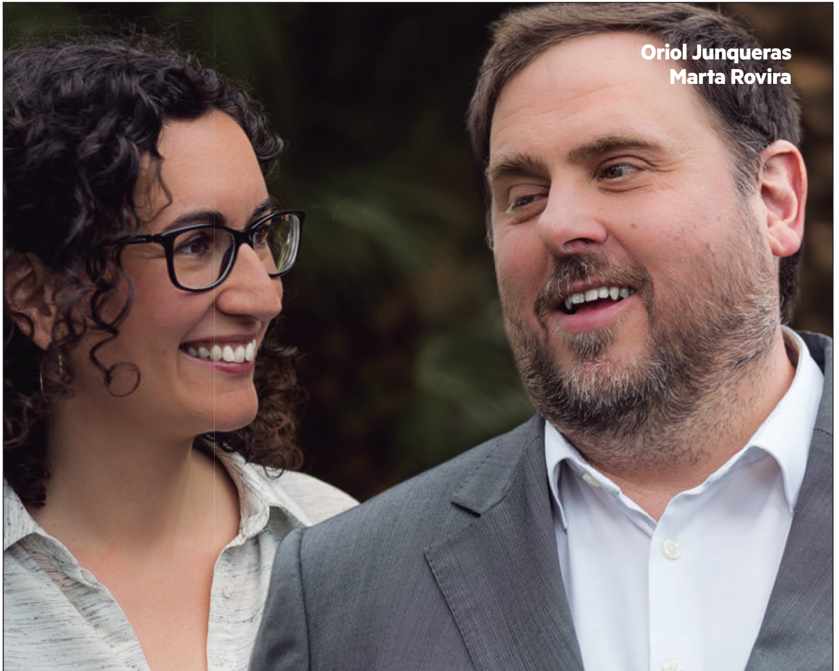
Oriol Junqueras Marta Rovira