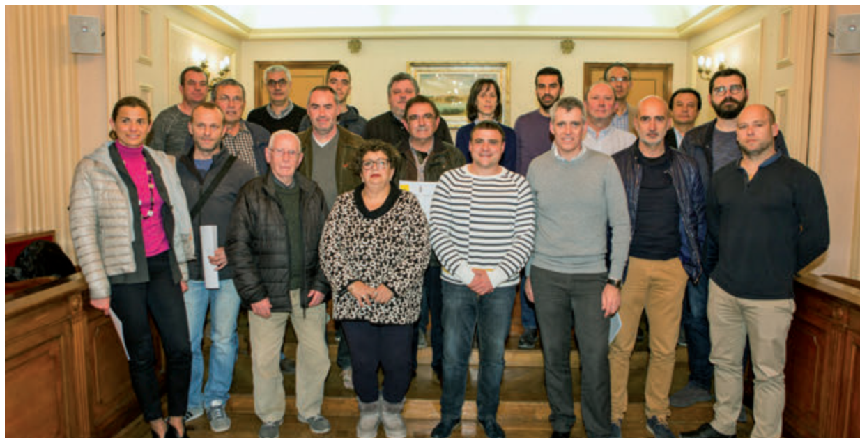
El Club d'Escacs d'Amposta anunciava així la data a través de les xarxes socials.