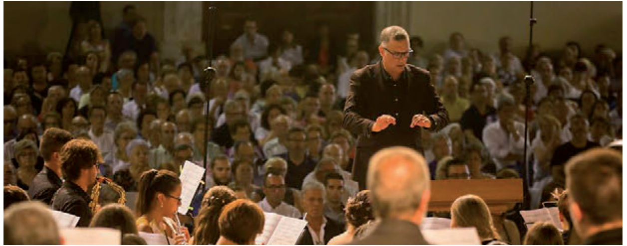
La Unió Filharmònica rebrà la Medalla d'Honor en el concert inaugural del 29 d'abril