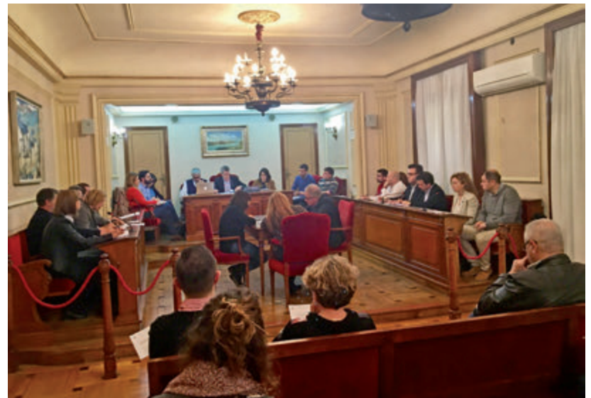
El ple de febrer va celebrar-se l'últim dilluns de mes.

Una altra dada significativa del tancament pressupostari de l'any és la ràtio d'endeutament, que se situa en el 43%, quan l'any passat aquesta xifra del 54%. "L'endeutament, però, no ens preocupa, perquè tenim molt marge fins el 120% que permet la llei". Sobre el superàvit, l'alcalde ha assenyalat que "tenir-lo és una anormalitat, el tenim perquè ens obliga l'Estat". "Nosaltres no volem superàvit, volem posar diners al carrer", ha afegit. "Hem aconseguit