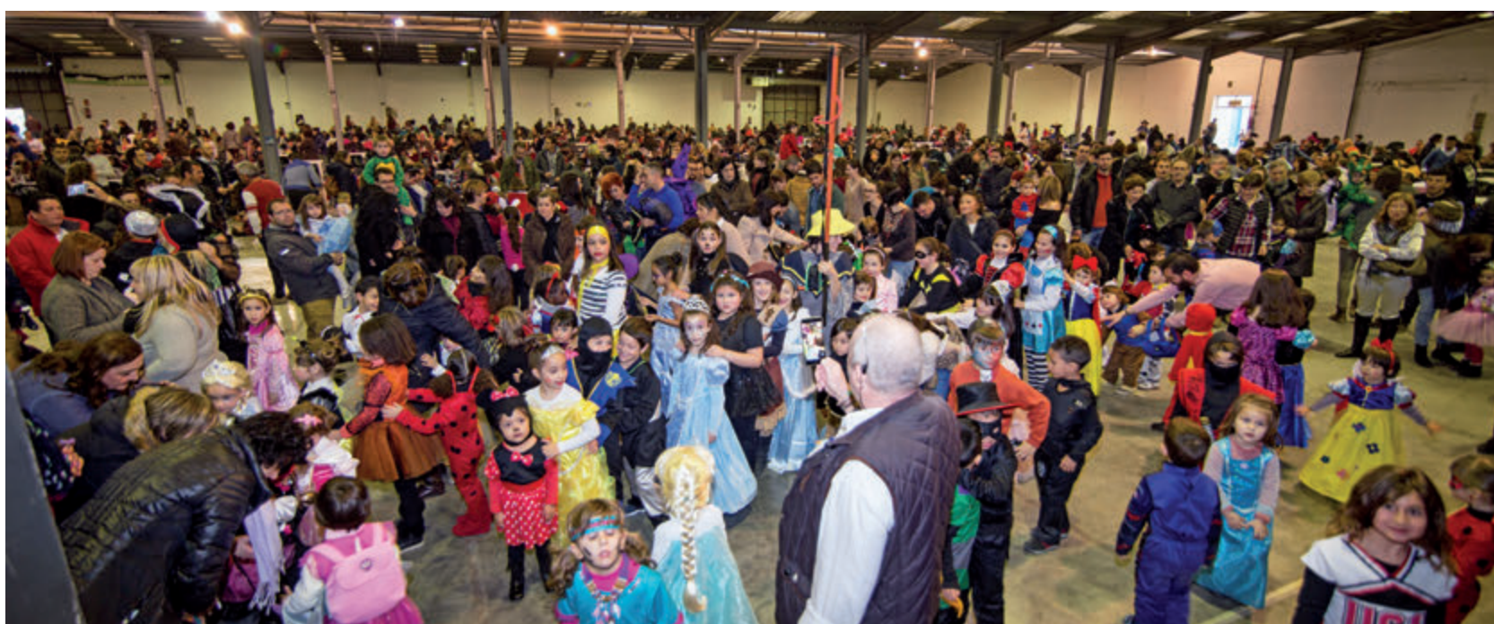
El carnaval infantil va omplir el pavelló firal dels mes menuts de casa.