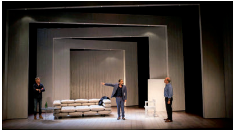
L'obra Art és una de les principals obres del programa.

Quant al teatre professional, el cicle arrancarà el proper 11 de març amb E.V.A, un espectacle programat per la Cia. Jove Marau, d'Amposta. Tindrà dos passis, un a les 19h. I un altre a les 20h. Serà a la Unió Filharmònica. En aquest àmbit s'han programat tres espectacles més: La distància entre el llamp i el tro, (1 d'abril, 22h, la Lira), Mag Lari (17 d'agost, plaça de l'Ajuntament) i Art (1 de desembre). En l'àmbit del teatre familiar s'inclouen els espectacles programats per la Xarxa