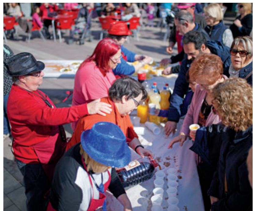
Dissabte al matí, el Rei Carnestoltes va servir un vermut a la plaça del Mercat.