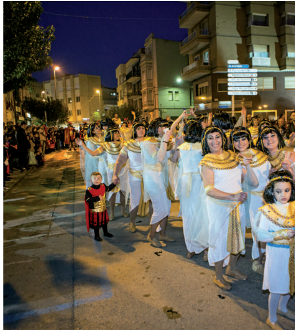
La comparsa 'Missió Cleopatra' (a l'esquerra) es va endur els premis de millor coreografia.

Els actes al voltant del Carnaval van acabar dimecres a la nit amb l'enterrament de la sardina, organitzat per l'entitat Els Tres Gats Blaus. Com ja és habitual, es va instal·lar el velatori del rei Carnestoltes al Casal, on es van servir pastissos i mistela als assistents. ■