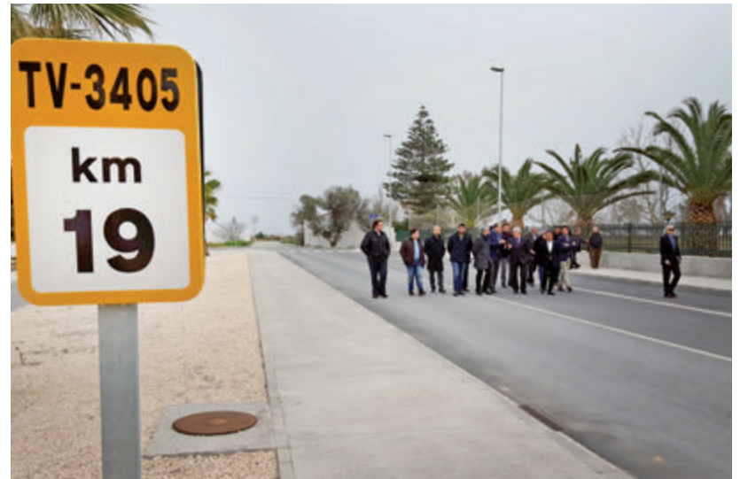
Dijous 23 de febrer es va fer una visita d'obres a la carretera.

visita per comprovar com l'entrada en funcionament ha donat plena resposta als objectius d'aquestes obres. L'actuació ha permès dotar de més seguretat a la via, facilitar un millor accés per als usuaris dels equipaments turístics i de la platja, i també millorar la mobilitat del trànsit en general, i el de camions de mercaderies que operen a la zona, en particular. Les obres de la segona fase, que van entrar en servei abans d'aquest estiu passat, van suposar una inversió de 1.456.159 euros. La millora de la seguretat s'ha fet possible eixamplant la carretera de 5,5 metres a 8 metres, amb una barrera de seguretat com a element de contenció per evitar caigudes al canal i la millora dels accessos. A més, s'ha realitzat la urbanització de l'últim tram que confronta amb la urbanització dels Eucaliptus i el