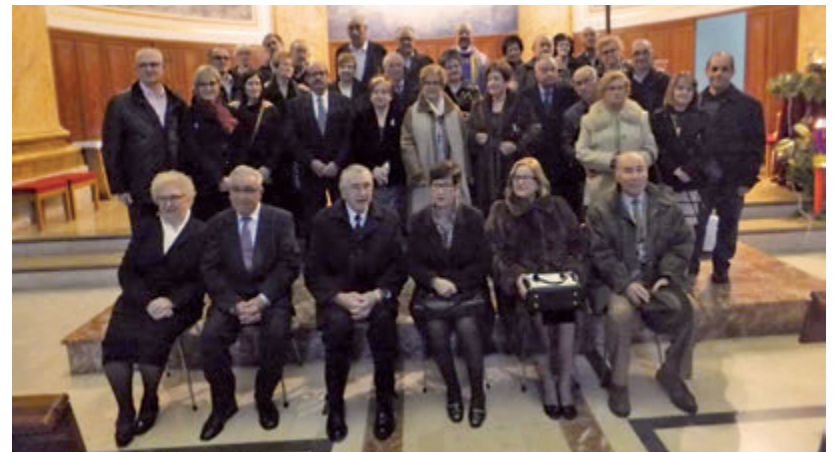
Foto de família de les 17 parelles que van celebrar les noces d'or i de plata a la Parròquia de l'Assumpció a finals de 2016.