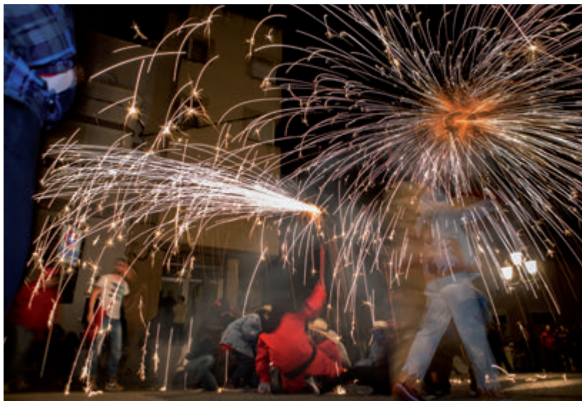
Divendres 17 es va realitzar la presentació de la Colla de Diables Minotaure i la festa jove al Castell, amb Mano's Rock.

El Carnaval es va avançar enguany una setmana a Amposta i del divendres 17 al diumenge 19 van tindre lloc diferents activitats com la rua de Carnaval (dissabte vespre) o el Carnaval infantil (diumenge tarda). Les activitats van començar ja divendres la tarda amb la presentació de la nova Colla de Diables d'Amposta, Lo Minotaure, a la plaça del Mercat i un posterior correfoc fins al Pont Penjant. Per la nit, la música de Mano's Rock va omplir la zona del Castell amb una nova Festa Jove.