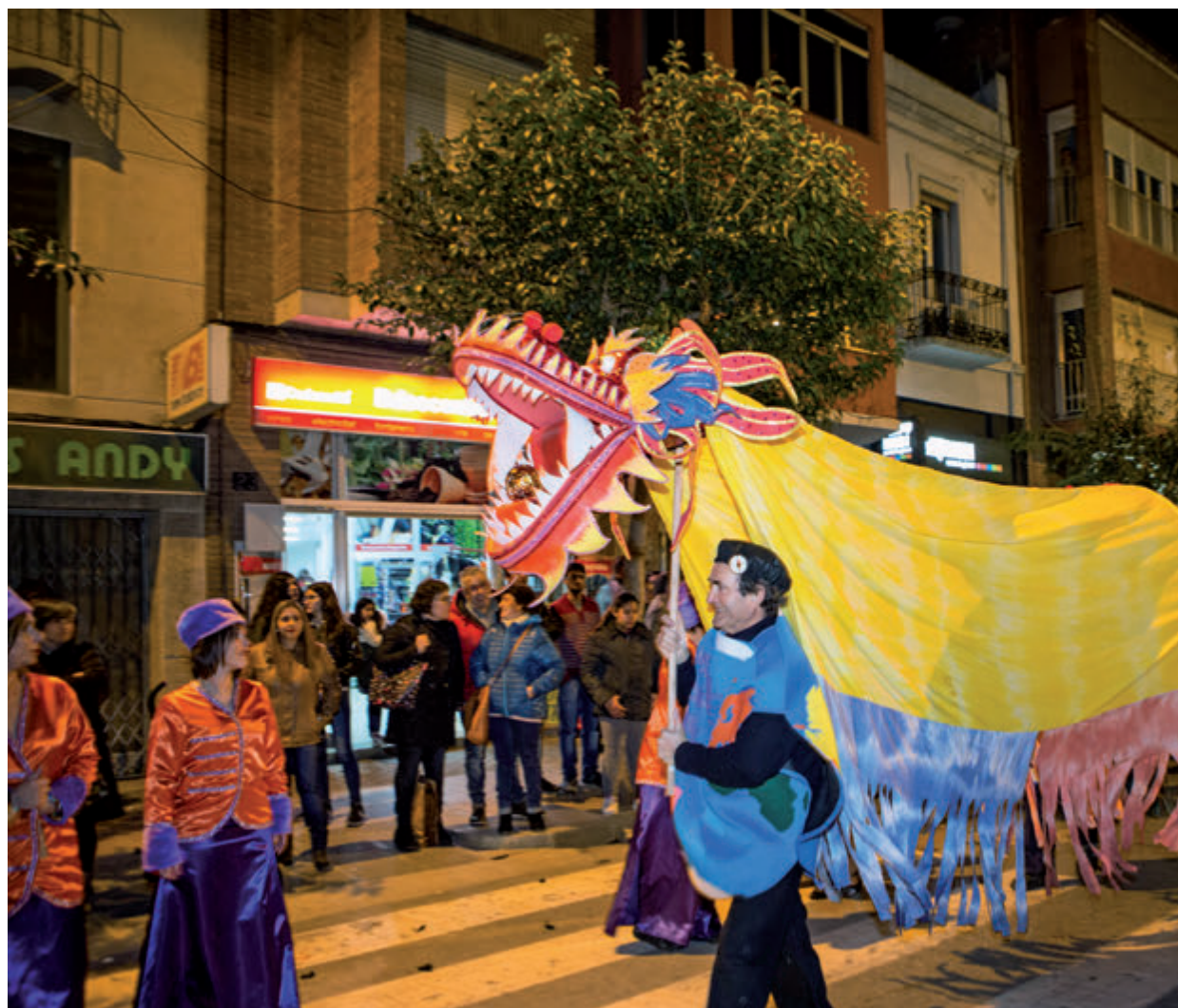
rafia i animació, mentre que la de 'La volta al món en 80 dies' (a la dreta) la de millor carrossa i vestuari.