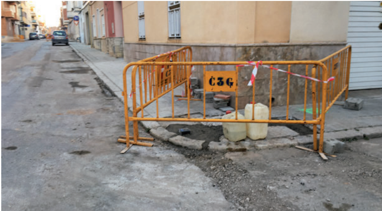
El romanent s'utilitzarà, entre altres coses, per renovar el clavegueram.