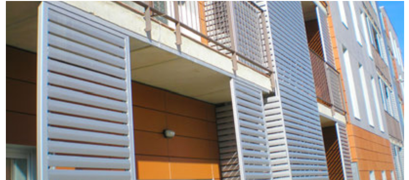
Les multes van dirigides a aquells propietaris que tenen diversos habitatges buits.