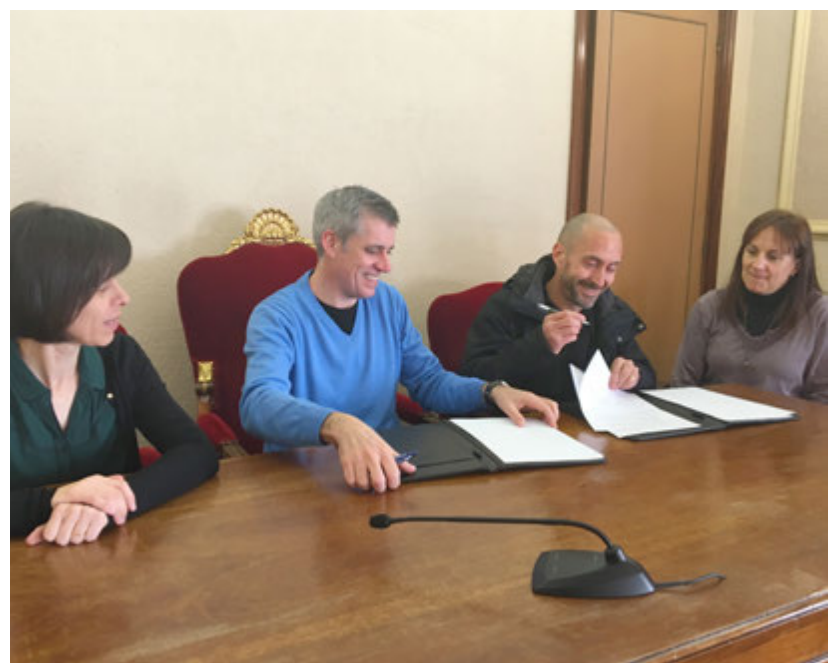
Acte de signatura del conveni de formació dual.

La Formació Dual combina l'aprenentatge en una empresa o institució amb la formació acadèmica, augmentant la col·laboració entre els centres de formació professional i les empreses, en el procés formatiu dels alumnes. ■