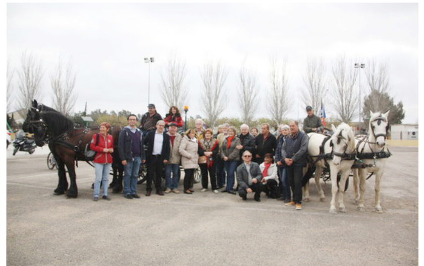
Tres carruatges de cavalls van sortir des d'Amposta fins a Doñana per reivindicar la importància de les zones humides. Va ser diumenge tres d'abril.

Dierssen, un referent internacional en neurociència i una de les màximes expertes en Síndrome de Down, va ser guardonada l'agost de 2008 amb el Premi Nacional de Pensament i Cultura Científica atorgat per la Generalitat de Catalunya pel seu "compromís social i la capacitat d'engedgar i liderar iniciatives culturals a favor de les persones afectades per la síndrome de Down". Per la seua banda, Prats és investigadora del Centre d'Investigació Biomèdica en Red-Bioenginyeria, Biomaterials i Nanomedicina (CIBER-BBN) i participant en el projecte europeu Graphen Flagship. Les seves investigacions més recents es basen en la funcionalització de plataformes de sensors químics i bioquímics, així com la caracterització de materials no convencionals com a sensors, entre ells el grafè, tant per a registre neuronal com per a detecció