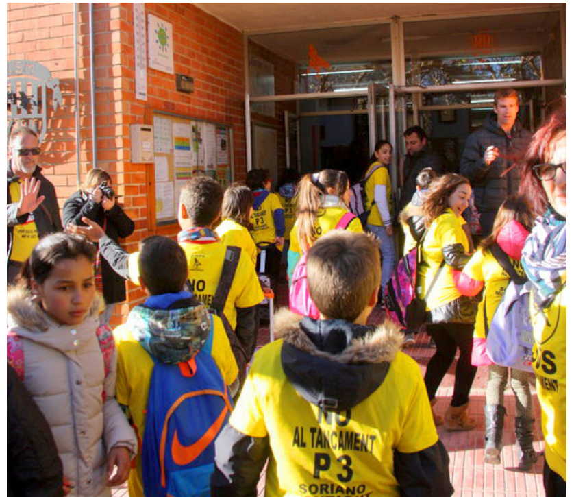
Dos alumnes de l'Escola Soriano Montagut d'Ampostà, amb camisetes grogues reivindicatives.