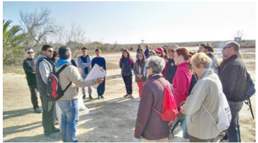
La campanya 'Per un Delta Net' recull 7 tones de residus

Ampostà, l'Ampolla, Camarles, l'Aldea, Deltebre, la Ràpita i Sant Jaume d'Enveja són els set municipis que van participar diumenge 13 de març a la campanya 'Per un Delta Net', una iniciativa de sensibilització ambiental organitzada pel Parc Natural del Delta de l'Ebre, el Consorci de Polítiques Ambientals de les Terres de l'Ebre i l'Associació de Voluntaris del Parc Natural. Les accions s'han dut a terme en set punts diferents del territori i les 300 persones que hi han participat han aconseguit recollir fins a set tones de residus. El 75% dels residus recollits són de plàstic (bosses, tacs, bidons i xarxes); la resta de residus són metall, vidre o tèxtil. Segons Xavier Abril, de l'Associació de Voluntaris, la quantitat de brossa acumulada al Delta respon a diversos factors, entre els quals el fet que el Mediterrani sigui un mar "hiperpoblat" que deixa els residus a les platges quan hi ha temporals, però també degut a actituds incíviques. ■