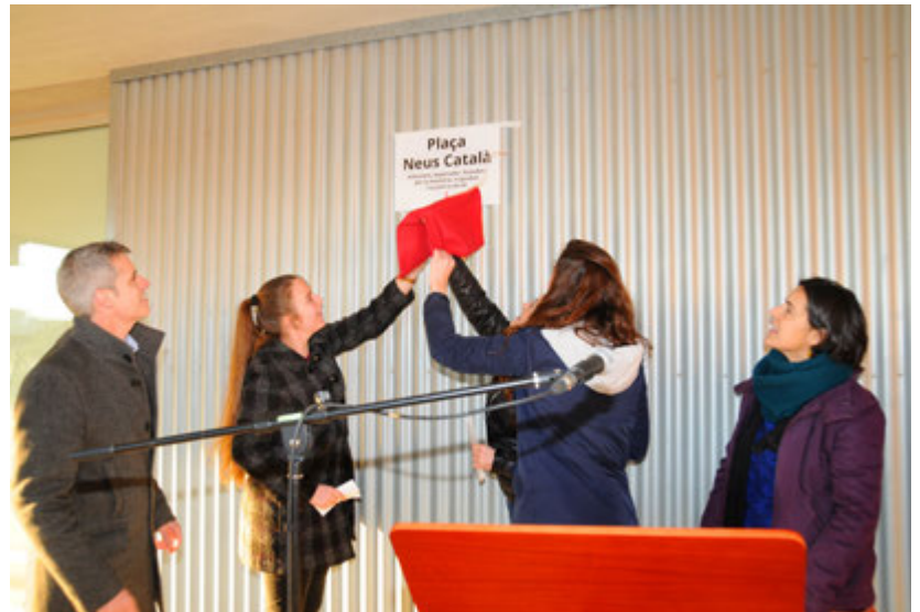
Moment en què dos estudiants de l'institut Ramon Berenguer IV d'Amposta van descobrir la plaça.

La figura de Neus Català i les deportades als camps de concentració nazi també va centrar altres activitats com una conferència de Belenguier al Consell Comarcal del Montsià després de la inauguració de la plaça o l'obra de teatre 'Un cel de plom', el divendres 18 de març al teatre auditori de la Lira Ampostina, obra que va servir per donar tret de sortida a la temporada de teatre. ■