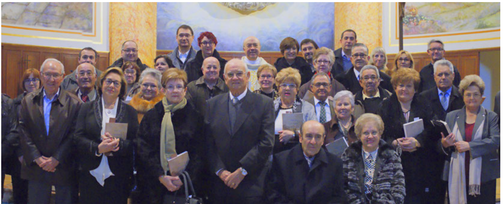
Celebració de les noces d'or

Imatge de les parelles que enguany han celebrat les seues noces d'or a la nostra ciutat. ■