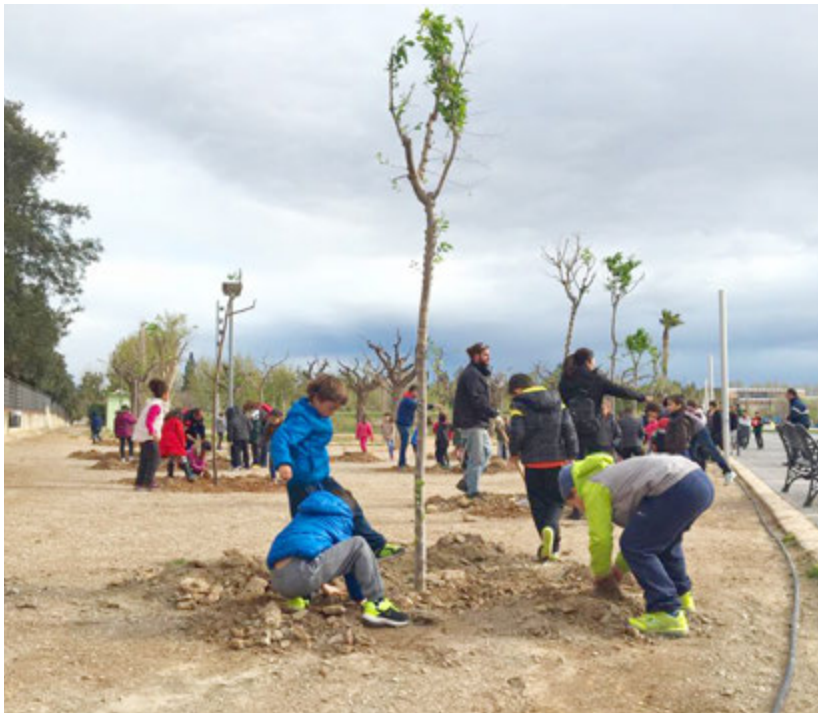
Els escolars planten arbres al parc dels Xiribecs

Com ja és tradicional, els escolars d'Ampostà van participar divendres d'abril en la plantada d'arbres al parc dels Xiribecs. En concret, enguany s'han plantat a la zona on abans estava instal·lat el pipican, que s'ha traslladat a una altra zona del parc. ■