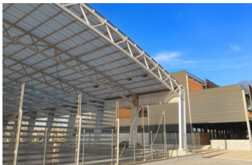
El ple de març també va aprovar una modificació de crèdit per poder fer el tancament de les pistes de futbol sala.

En aquest ple de març, que es va celebrar de forma extraordinària en dimecres perquè el dilluns era festiu, es van aprovar fins a cinc mocions, dos del regidor German Císcar i dos del Partit dels Socialis-