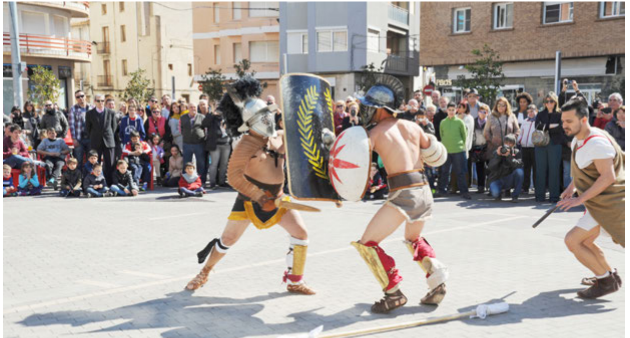
La plaça del Mercat es va transformar en un amfiteatre d'època romana.

El mateix dia, als Instituts Ramon Berenguer i Montsià, l'Escola de