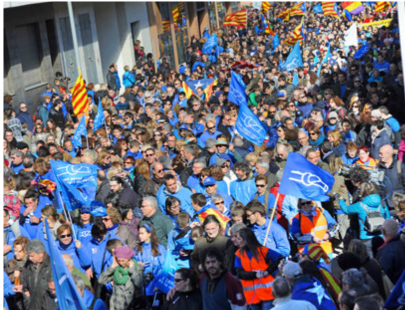
Imatge de la manifestació contra el Pla de Conca del 7 de febrer a la ciutat.

A més a més, en el marc del front institucional impulsat per l'Ajuntament d'Amposta, el consistori ha fet arribar aquest acord als altres 51 municipis del territori, a les 5 EMD i als quatre consells comarcals per tal que se sumin al recurs contenciós. Així es va acordar en una reunió mantinguda entre els alcaldes d'Amposta, Deltebre, Sant Jaume