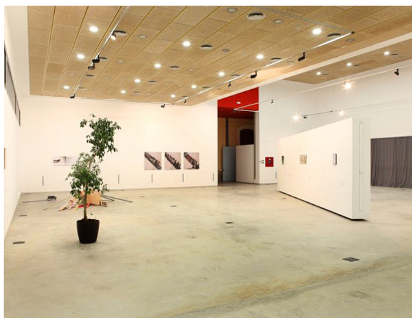
Les obres seleccionades estaran exposades al Centre d'Art de les Terres de l'Ebre.