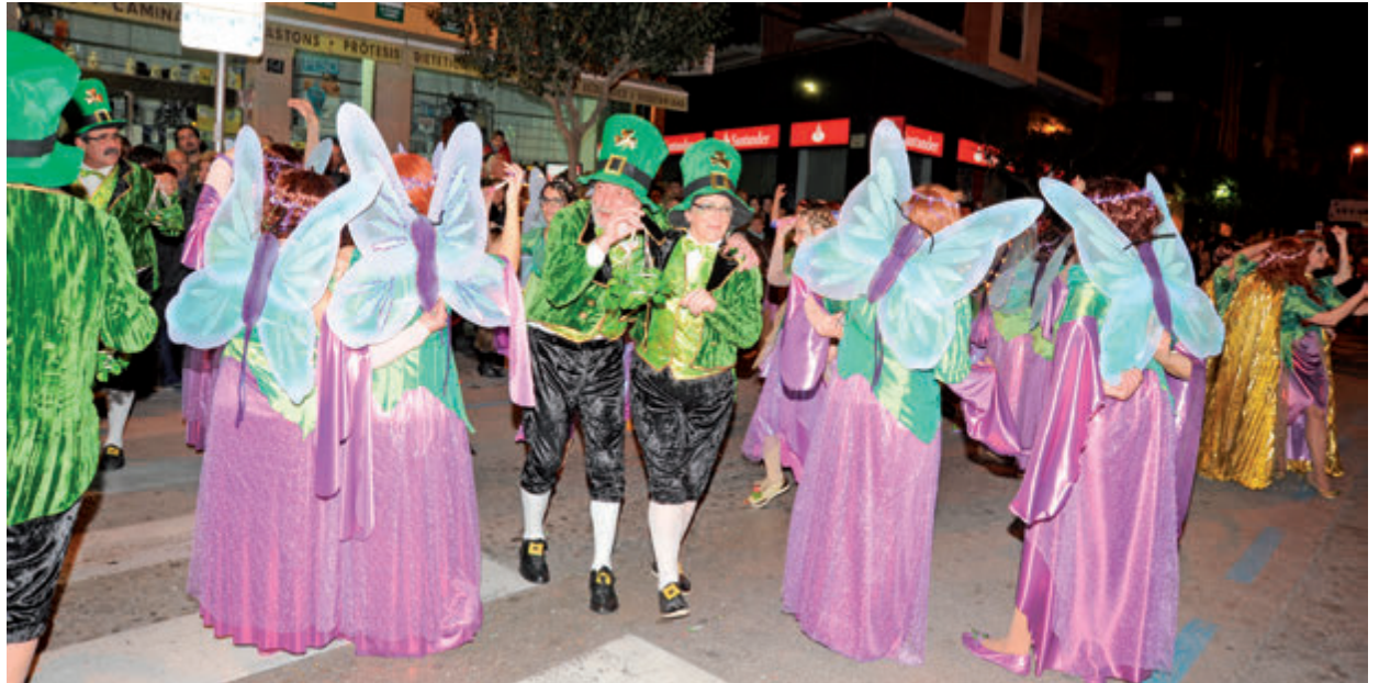
La comparsa El Bosc de les Fades va endur-se el primer premi.

F ins a onze comparses van participar a la rua i concurs de Carnaval d'enguany, que va celebrar-se el dissabte 6 de febrer per la nit. D'entre totes elles, el jurat va escollir la protagonitzada per The Country Sherifes, El Bosc de les Fades, per rebre el primer premi, dotat amb 500 euros. El segon premi, dotat amb 300 euros, va recaure en l'entitat Quick Dance i la seva comparsa Inside Out. La proposta Moulin Rouge va endur-se el tercer premi, de 200 euros; Els Astronautes, del Petit Món, van ser els quarts classificats (100 euros) i les Butterfly, de l'entitat Bombolles (100 euros). Enguany, el rei Carnestoltes va estrenar una vestimenta molt reivindicativa, amb el nus antitransvasament com a protagonista. ■