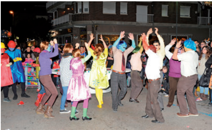
El segon premi va ser per a Inside Out, de Quick Dance, amb un guardó econòmic de 300 euros.