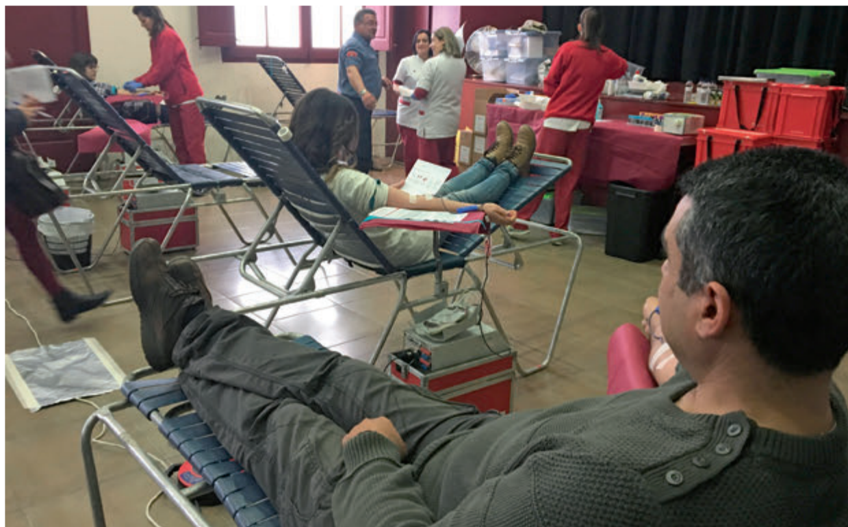
Dimecres 9 de març, el Casal d'Amposta va ser escenari d'una nova jornada de donació de sang. En aquest cas, en el marc de la campanya 'Els bombers t'acompanyen a donar sang'.

sava que jo era el seu fins que vàrem intercanviar-nos els papers arrossegava el marró, el blau i el roig. Més durs i foscos, més forts i greus, com un tú a tú. I no m'agradava el quadre.