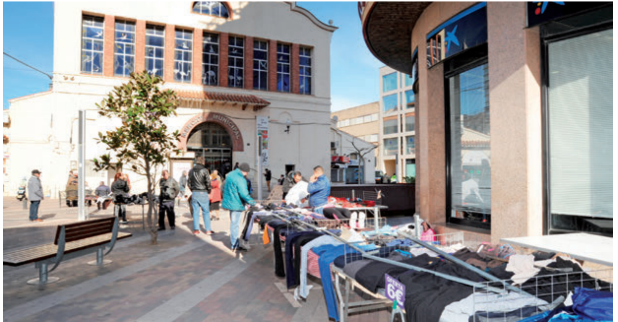
La nova ubicació aposta per posar parades a la plaça del Mercat.