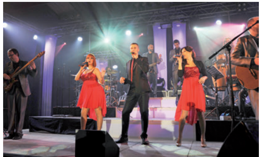
L'orquestra Júniers va posar el toc musical a la nit de Carnaval.