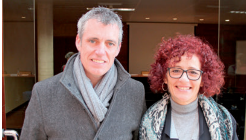
L'alcalde d'Ampostà passa a ser el president del Consorci i la presidenta del Consell Comarcal, la vicepresidenta.

Els ens que formen part del Consorci del Museu de les Terres de l'Ebre són l'Ajuntament d'Ampostà (1984), el Consell Comarcal del Montsià (1992), l'Ajuntament d'Alcanar (2002), l'Ajuntament de Santa Bàrbara (2005), l'Ajuntament