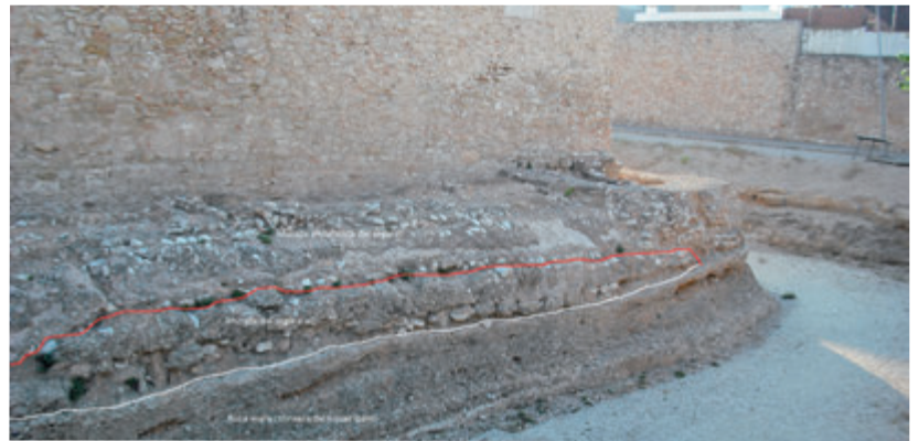
Muralla i fossat ibèric del segle V aC, reutilitzats per cultures posteriors.

Tot fa pensar que quan els habitants d'Hibera presenciaren aquell contingent de més de 20.000 aguerrits soldats acampats a l'altra part del riu experimentaren un tret psicològic tan impactant que ineludiblement haurien conclòs en declinar la balança a favor