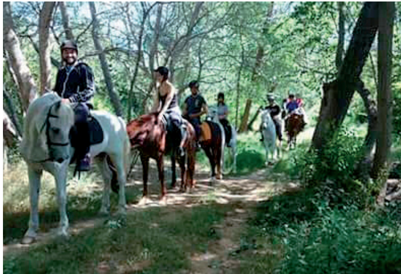
Un dels programes és Joves per l'Ocupació, enguany destinat a 90 joves.

Joves per l'Ocupació: Se'n beneficiaran 90 joves amb Garantia Juvenil. Subvenció de 410.000 euros. Les especialitats d'enguany són: auxiliars d'agricultura, jardineria, vivers; auxiliar de veterinària i ramaderia; dependent/a carn i peix; secretari/a i atenció al públic; operari d'indústria; auxiliar d'aqüicultura i elaboració d'arts de pesca; ajudant de transport per carretera; animació sociocultural i turisme; mecànic i soldadura; ajudant d'electricista (adaptat). L'alcalde ha destacat que aquest programa, a més a més, comporta la contractació de 70 formadors. Al 2015, dels joves que van participar al programa, es van