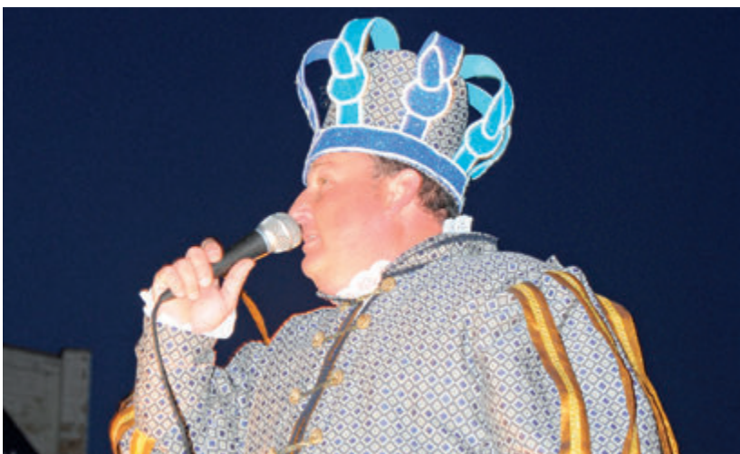
Enguany, el rei Carnestoltes anava ben reivindicatiu.