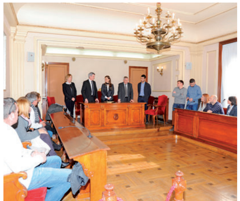
La consellera es va reunir amb el consistori al saló de plens.

La consellera també va fer una visita institucional a l'Ajuntament, on es va reunir amb els regidors del consistori per traslladar-los la voluntat de continuar apostant pel sector primari com a motor econòmic. Després, va participar en la presentació de les jornades gastronòmiques de la Carxofa, al mercat municipal (vegeu més informació a la pàgina 11). ■