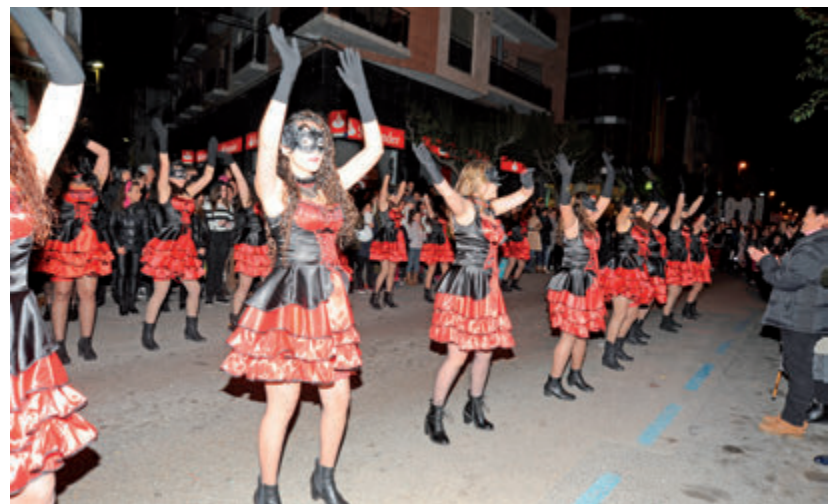
La comparsa Moulin Rouge es va emportar el tercer premi, dotat de 200 euros.