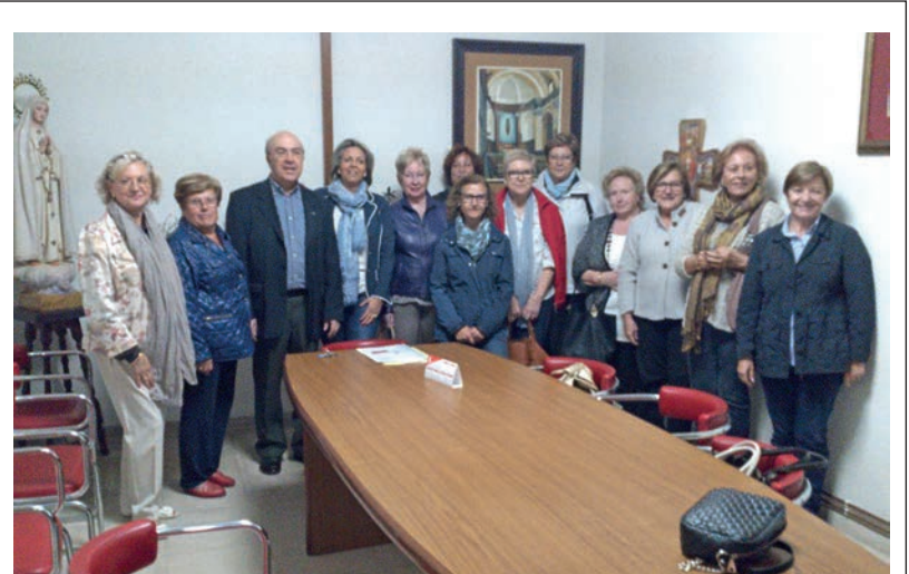
El grup de voluntàries de Mans Unides d'Amposta agraeix la seva col·laboració.

Demanem la Gratuïtat AP7 per a tots els vehicles, independentment del seu pes, longitud o procedència, entre els peatges de l'Hospitalet de l'Infant i Benicarló-Peníscola (sense deixar de banda ampliar el tram a mesura que més poblacions es vagin afegint al moviment). Totes les propostes que hi ha ara per ara a sobre la taula, com la construcció de rotondes (11 rotondes en un tram de 60 km.), la col·locació de cons, els radars, les limitacions de velocitat, són només pegats que no fan sinó incrementar les retencions i la perillositat d'aquesta via, augmentar el temps per a realitzar el trajecte i que semblen encaminades a fer passar el trànsit de vehicles pesats per l'autopista AP7, que amb les bonificacions previstes asseguren que el transport de mercaderies es faci tot per una via de peatge, assegurant els ingressos per a la concessionària. Cal recordar que el món del transport no és responsable de res sinó que són part afectada, doncs el 32% aprox. de les víctimes