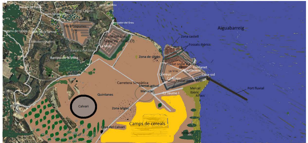
Hipotètics traçats de l'oppidum d'Amposta, poblat del Grau i el del Pla d'Empúries.

Aquesta bona predisposició al cosmopolitisme hauria suscitat a que s'endeguessin algunes remodelacions organitzatives i conjunturals. La construcció d'un nou oppidum també hi formaria part. Les infraestructures exposades en el recinte del Castell ens indiquen que la seva construcció coincideix amb aquesta etapa del colonialisme grec.