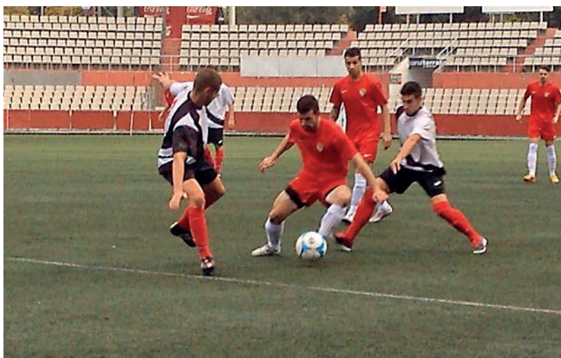
El 25 d'octubre l'Amposta es va imposar contra el Terrassa a casa dels vallesans.

Pel que fa als propers partits, l'Amposta s'enfrontarà a la Suberense a Amposta (15 de novembre), al Jesús i Maria fora (22 de novembre), a l'Igualada (al municipal ampostí el 29 de novembre) i al Balaguer (fora, el 13 de desembre). ■