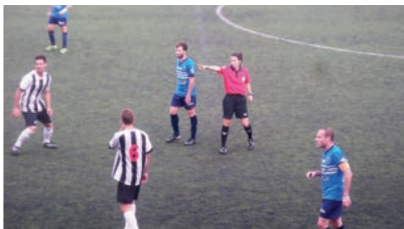
Imatge del partit contra l'Igualada.

Respecte mutu és el que es tenien els dos conjunts als primers minuts de partit.