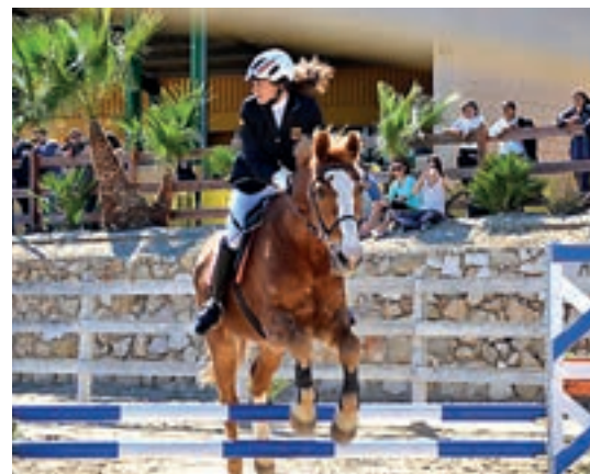
Tres de les proves que formen part del Pentatló Modern, l'esgrima, el tir i la hípica.