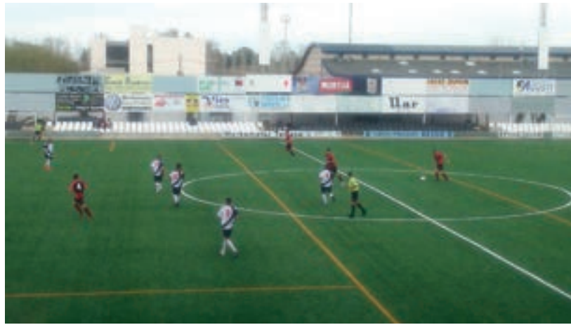
Imatge del partit contra l'Almacelles.

A partir d'aquí l'Amposta s'ha fet amb el partit, abocat a l'àrea del