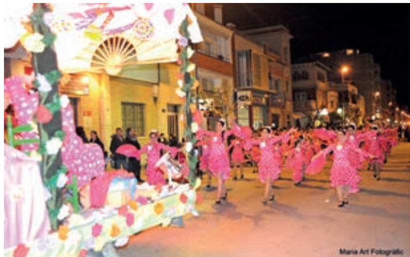
Maria Art Fotogràfic

Tot plegat, un cap de setmana ben divertit que acabava el dimecres amb l'Enterrament de la Sardina, un acte que és dels més esperats amb el velatori, el recorregut fúnebre i la crema de les despulles del rei dels poca-soltes. ■