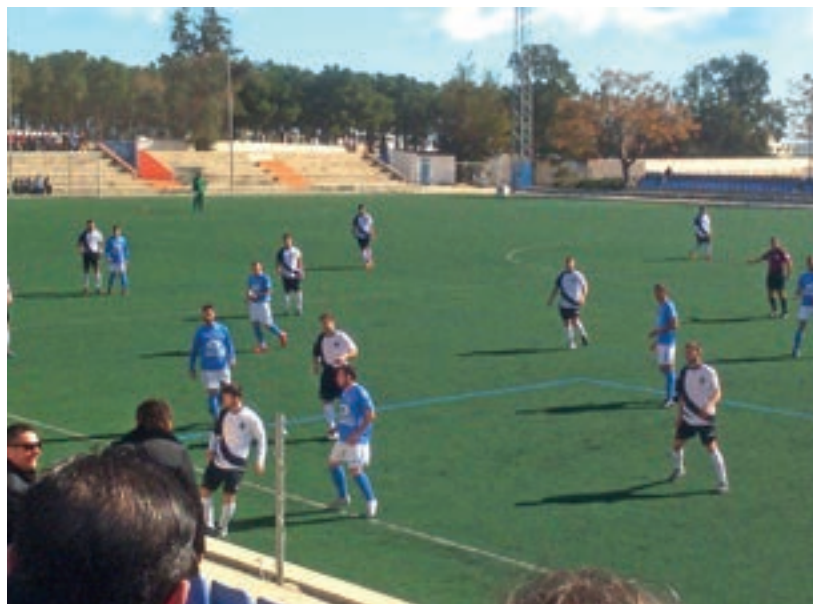
Imatges del partit contra la Rapitenca.

A partir d'aquí el Sant Ildefons s'hi ha bolcat a l'atac fent defensar a la seva àrea als locals. Una errada defensiva i el posterior penal en contra dels ampostins, feia que l'equip visitant col·loques el 3-2 al marcador quan faltaven 6 minuts més l'afegit per la finalització de l'encontre.