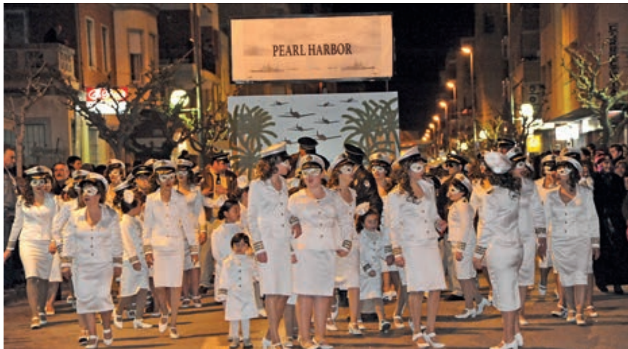
Primer premi del Carnaval 2015. A les imatges inferiors el segon i tercer premis

La plaça Ramon Berenguer IV, ja al matí la Plaça del Mercat bullia amb l'ambient festiu en el tradicional vermut de carnestoltes, gràcies també als venedors del Mercat Municipal que van aparèixer disfressats a les