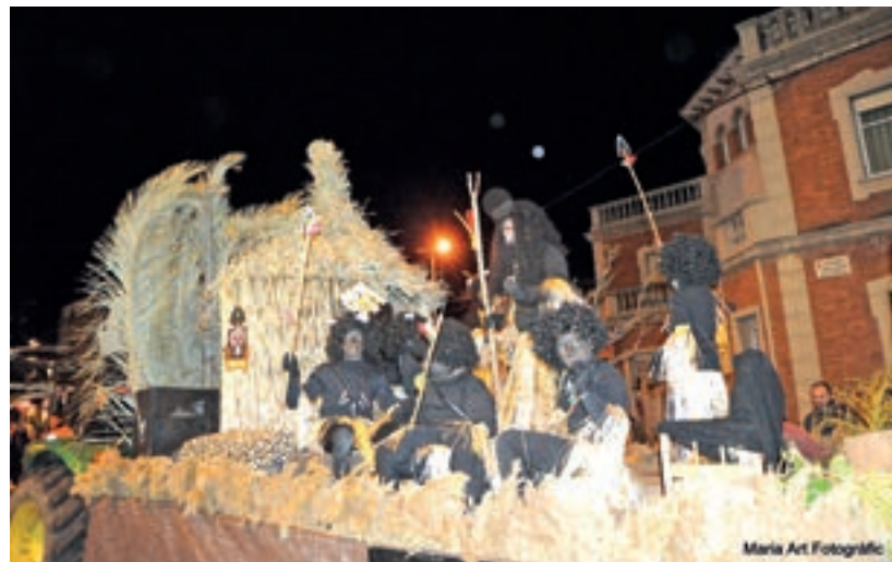
Maria Art Fotogràfic