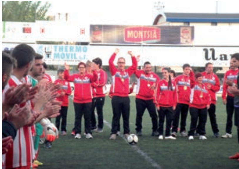
Abans del partit contra el Viladecans es va fer un reconeixement als esportistes d'APASA que van participar als Special Olympics.

Alineació: Àlex Iniesta, Marcel (Versiano min. 77), Moha (Víctor min. 46), Jonathan, Reales, Barrufet (Ferrando min. 83), Sergio (Cristo min.