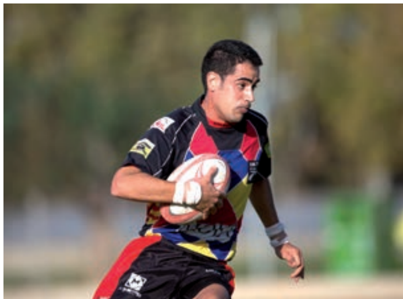
Capilla en plena acció.

Aquest partit, fa poc, els Taus els perdien per escassa diferència. És la