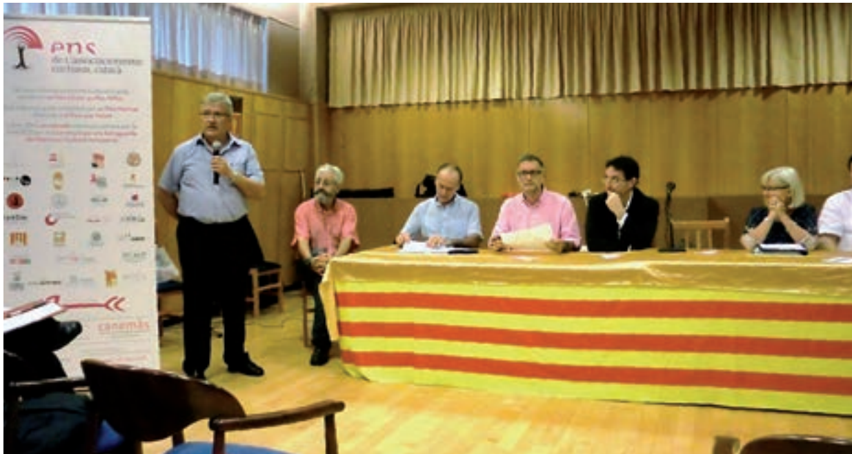
Imatge de la taula de ponents participants a la Jornada de Treball duta a terme a l'escola de música de La Lira Ampostina.

Una trobada de reflexió, debat i participació organitzada per la FCSM