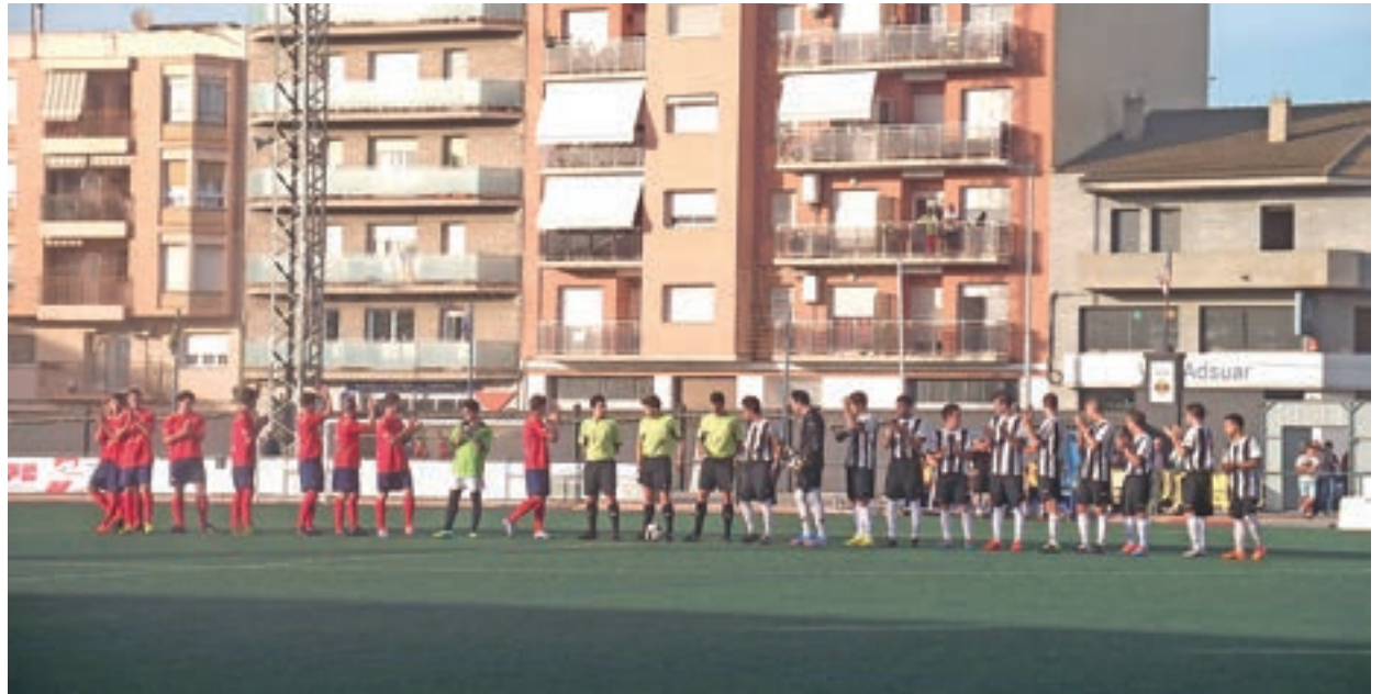
Al camp del Balaguer

A la segona meitat l'Amposta s'ha fet amb el partit, Becerra a falta de