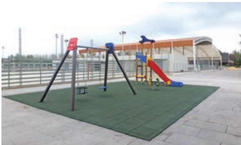
Adequació dels voltants de les zones poliesportives i zona de jocs infantils construïda per Hidrocanal

posta, rehabilitat pels alumnes de les escoles taller, es convertirà en la seu de l'Oficina de Turisme del municipi i en un centre d'interpretació de la natura, la cultura, el sector agroalimentari i la gastronomia del Delta de l'Ebre. La inversió supera els 400.000 euros. ■