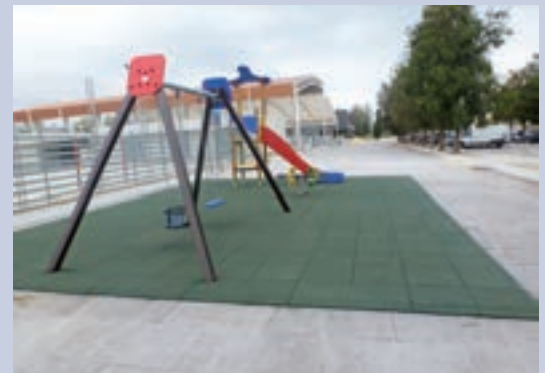
Nova àrea de jocs infantils a la zona esportiva.

Nova edició de les Jornades de les Lletres Ebrenques