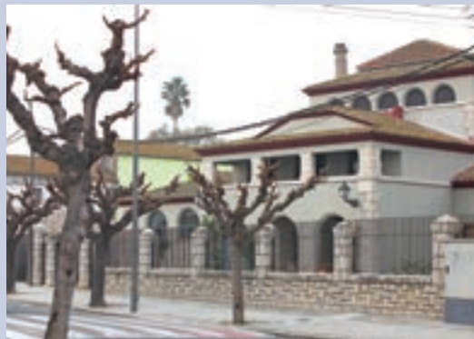
Oficina de Turisme i Centre d'Interpretació del Delta.