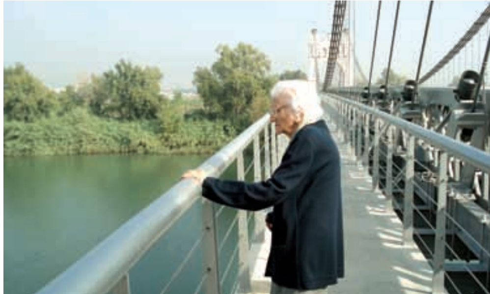
Es possible que estigui recordant ara aquell estrèpit.

Jo vaig néixer l'any 1920, si no m'equivoco ja en tinc 94 de fets, naixia al carrer Nou número 2, i era el mes de febrer, la casa aquella estava després mateix de que s'acabava l'edifici de l'església, aquesta casa tenia la curiositat de que a pesar d'estar l'església primer, l'església