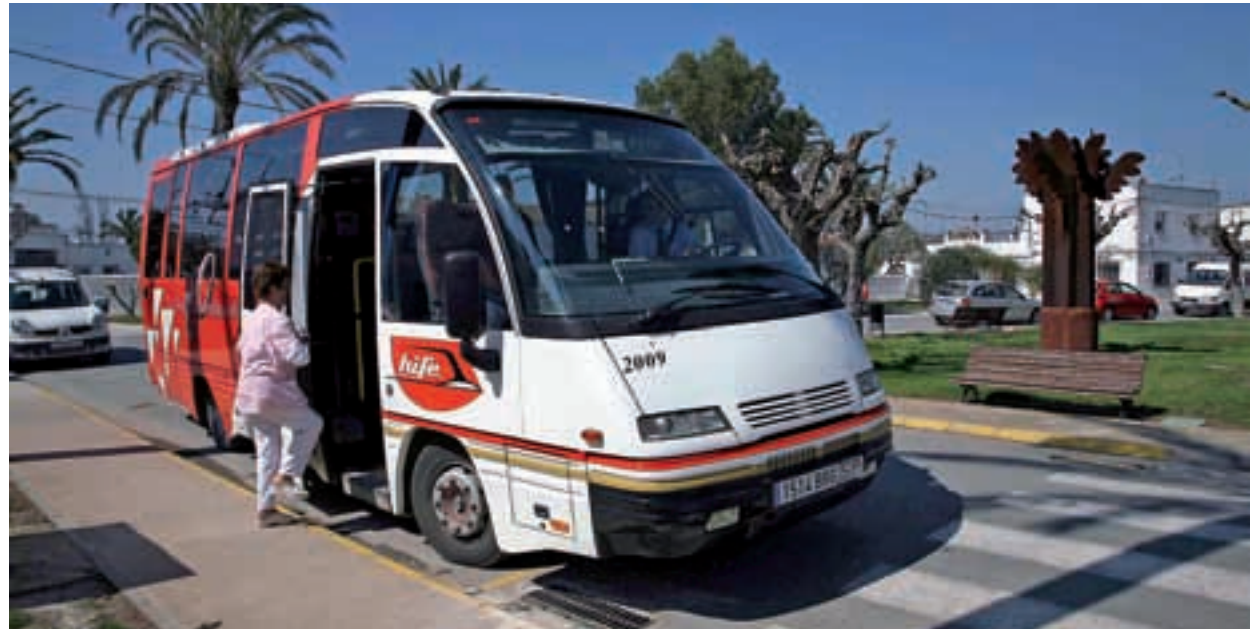
Parada de bus al Poblenou.