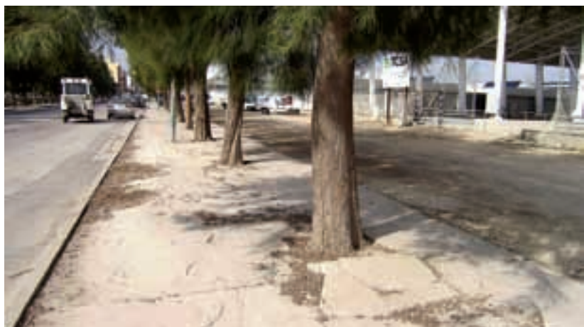
Les voreres abans i després les obres.

A diferència dels altres dos carrers, al carrer Covadonga es mantindrà la pedra natural pròxima a les edificacions, com franja lateral al carril de circulació i tant en aquest carrer com al Pelai es canviarà la configuració de les escales existents per a que tinguin un recorregut adaptat. ■