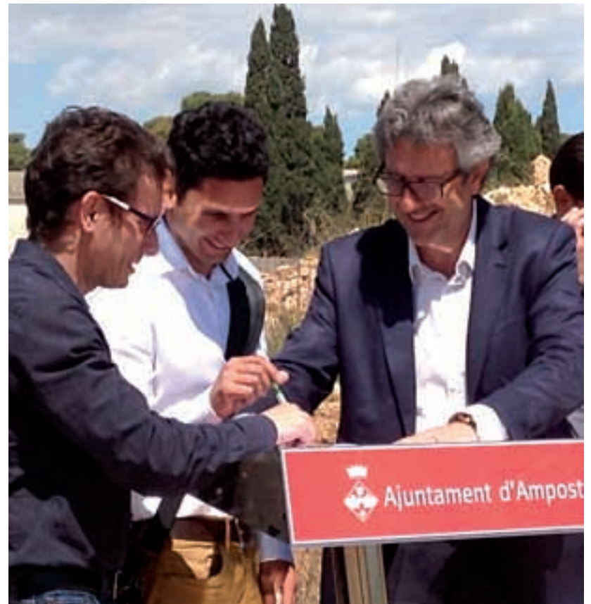
Signatura de l'acta de replanteig. Els dos arquitectes ampostins s'encarregaran de la direcció d'obra.