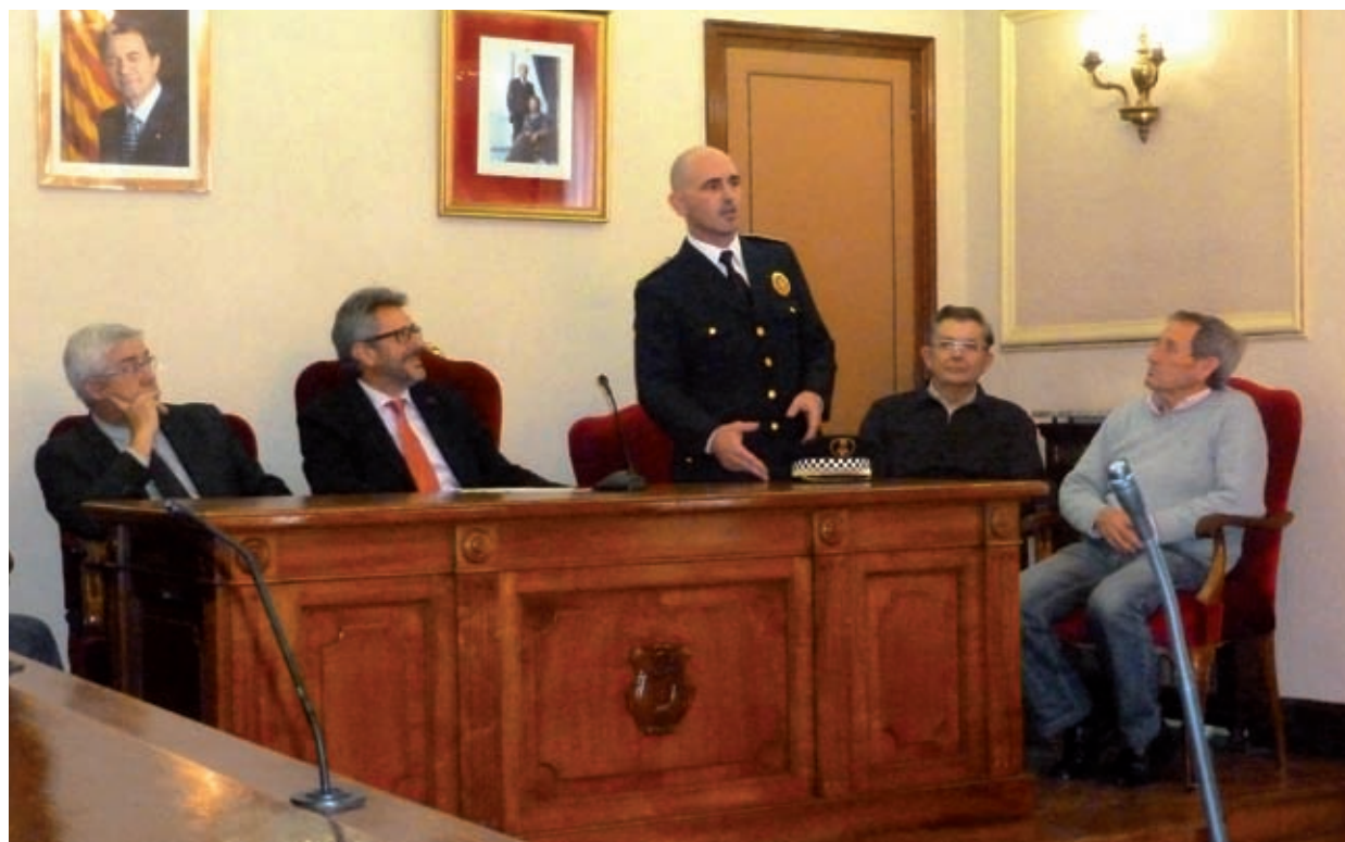
XAVIER SARAGOSSA SENTÍS, NOU CAP DE LA POLICIA LOCAL