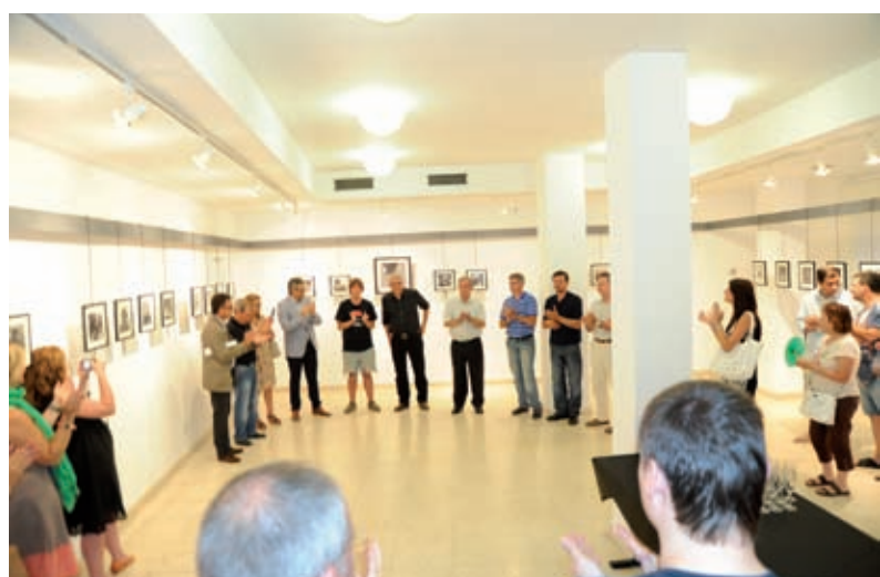
Per la seva exposició de fotografies a Festes