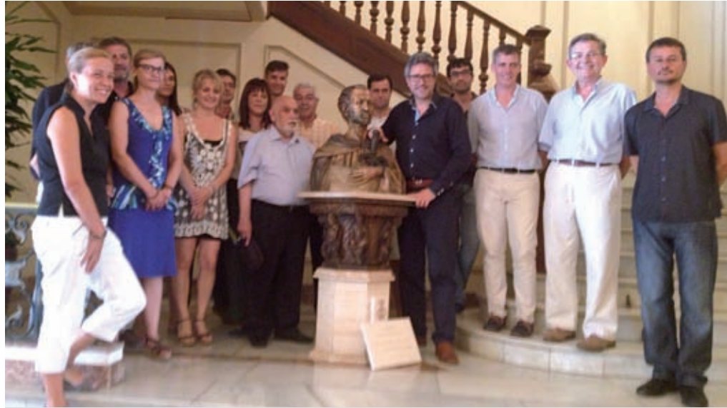
Un bust de Ramon Berenguer IV presideix des d'aquest passat mes d'agost l'escala principal del vestíbul de l'Ajuntament d'Amposta. L'obra, de la mateixa col·lecció i factura que la que està ubicada a la font de la plaça que porta el nom del mateix comte, ha estat una donació de l'escultor Joan Baptista Alamar. A l'acte d'entrega hi van assistir els regidors de l'Ajuntament d'Amposta, l'artista i la seva família. ■

Començaré per l'encomanament, a casa des del meu tio, el meu pare i tota la família sempre havíem tingut