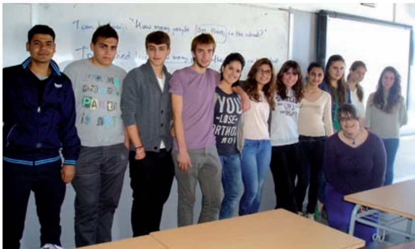
Primer de Batxillerat de l'Institut de Tecnificació