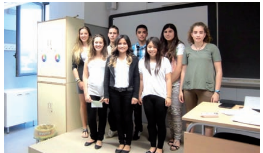
Tercer d'ESO de l'Institut de Tecnificació