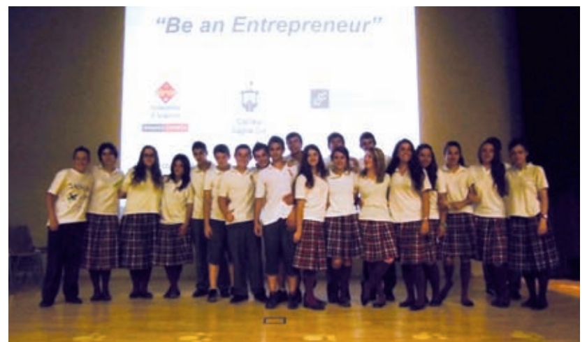
Tercer d'ESO del Col·legi Sagrat Cor