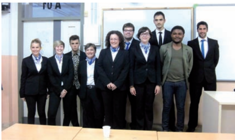
Grau de Turisme de l'IES Montsià