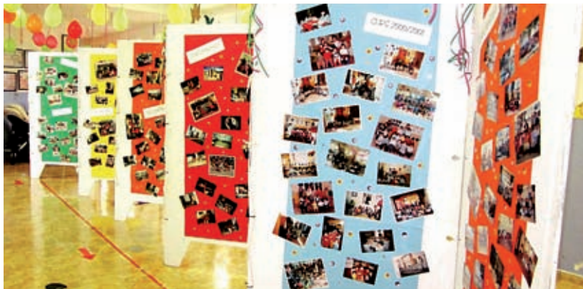
JORNADA DE PORTES OBERTES