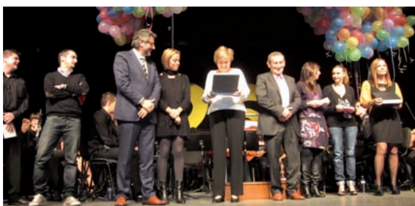
LLIURAMENT DE LA PLACA COMMEMORATIVA ALS 25 ANYS DE DOCÈNCIA