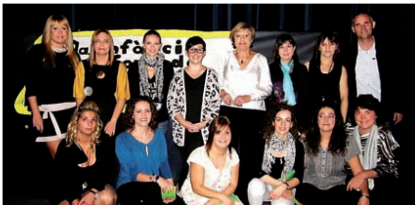
L'EQUIP EDUCATIU DE LA GRUNETA