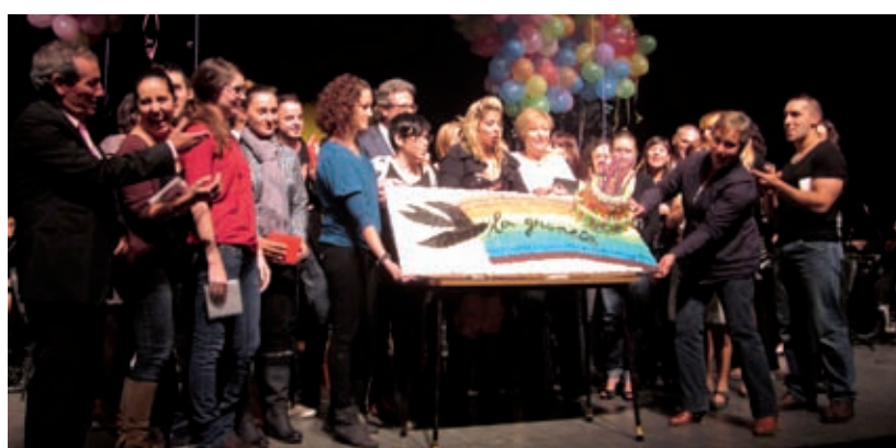
PASTÍS COMMEMORATIU DE L'ANIVERSARI