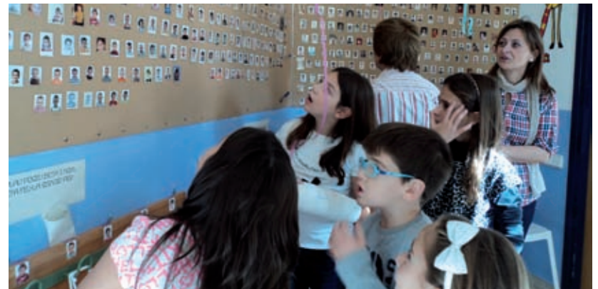
DESCOBERTA D'UN MATEIX