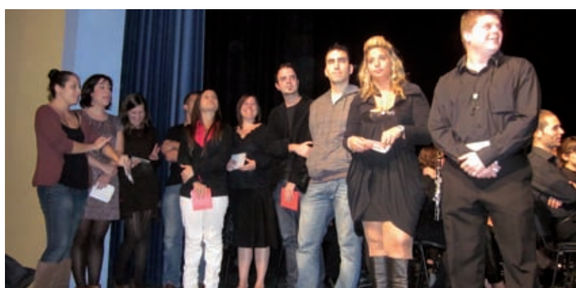
ALUMNES DE LA PRIMERA PROMOCIÓ CURS 87-88