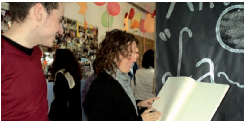
SIGNANT EL LLIBRE DE VISITES