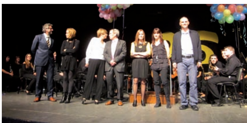
ELS REGIDORS D'ENSENYAMENT I EL 1ER. EQUIP DOCENT