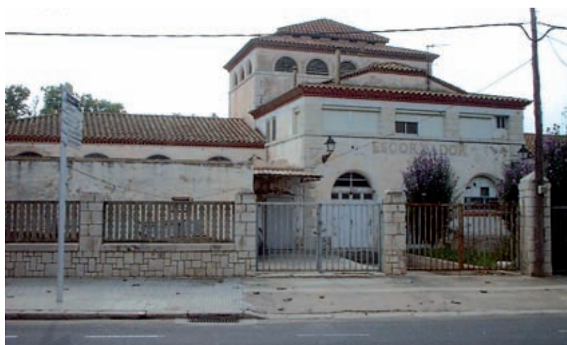
L'escorxador abans de la seva rehabilitació

El turisme de les experiències i els sentits en el Delta ha de retrobar noves formulacions d'activitats i de singularitat en el propi paisatge, en les formes de vida i treball propis, en la pròpia cultura, en els productes i en la cuina autòctons. És per això que la nova oficina de turisme d'Amposta, que es vol ubicar en l'antic edifici de l'escorxador, ha d'aprofitar: la seva connexió amb el Delta i els seus paisatges, els conceptes i coneixements a l'entorn dels productes i la cuina de proximitat, els potencials