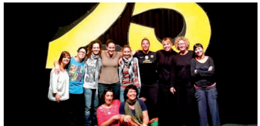
MUNTATGE DE L'ESCENARI