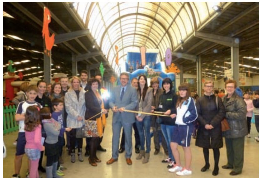
Moment en que l'alcalde d'Amposta inaugura el saló