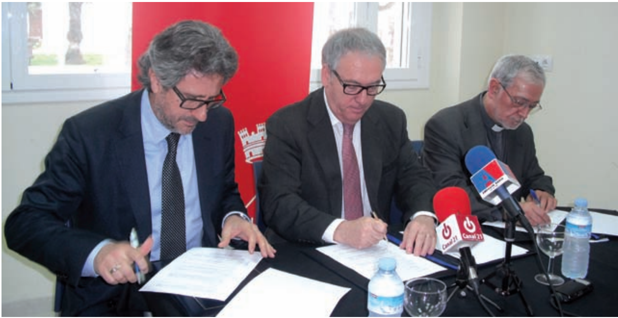
Formalitzat entre Ajuntament, Diputació i Bisbat