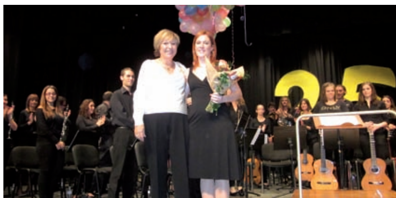
LLIURAMENT DEL RAM A LA DIRECTORA DE LA BANDA