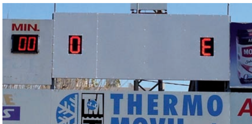
El camp de futbol municipal, seguint amb les millores a les instal·lacions disposa de nou marcador i d'un magatzem per al futbol base. ■