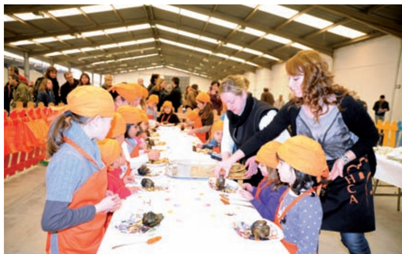
La novetat d'enguany, el taller de cuina per als més menuts.

Amposta celebra anualment dues grans festes gastronòmiques, la primera dedicada a la carxofa i la segona a l'arròs, producte estrella del Delta. Ferré considera Amposta una capital gastronòmica perfecta per degustar el maridatge entre ingredients del camp i del mar, "a més, disposem d'una gran xarxa de restaurants amb una relació qualitat preu increïble", sentencià. ■