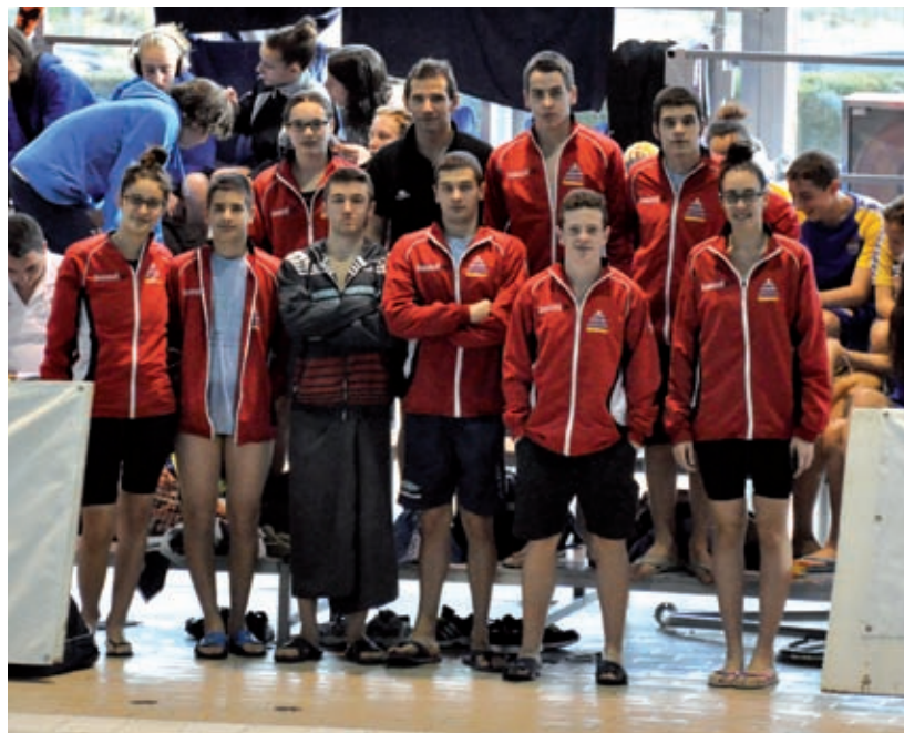
La plantilla del Club Natació Amposta a la piscina del Club Natació Sabadell. CNA

La segona jornada, el divendres 8 iniciava la competició representant